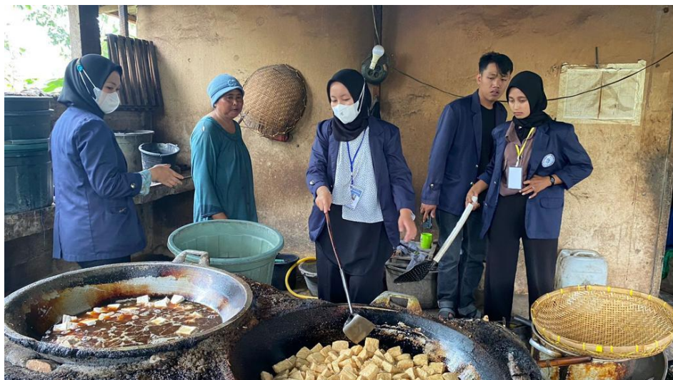
Gambar 2.3.16 PembuatanInovasi Produk Tahu Kopong

Mahasiswa membantu pemilik UMKM mengembangkan varian inovasi produk selain produk tahu kopong saja, namun berbagai variant ahu lainnya, guna meningkatkan daya Tarik masyarakat untuk mencoba varian inovasi yang lainnya.