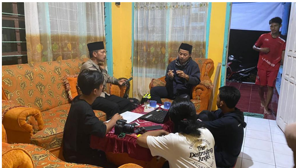
Gambar 2.3.4 Musyawarah Bersama untuk kegiatan acara 17 agustus