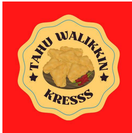
Gambar 2.1.5 desain logo tahu