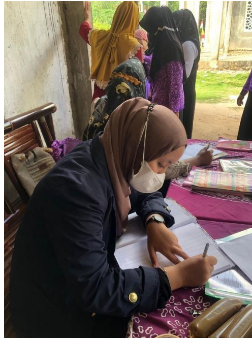
Gambar 2.3.15 Posyandu

Mahasiswa PKPM membantu Ibu Ibu Pkk melaksanakan kegiatan posyandu yang diselenggarakan rutin oleh pihak dess dan bidan desa.