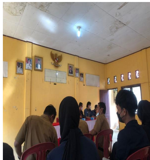
Gambar 2.3.1 penerimaan mahasiswa pkpm