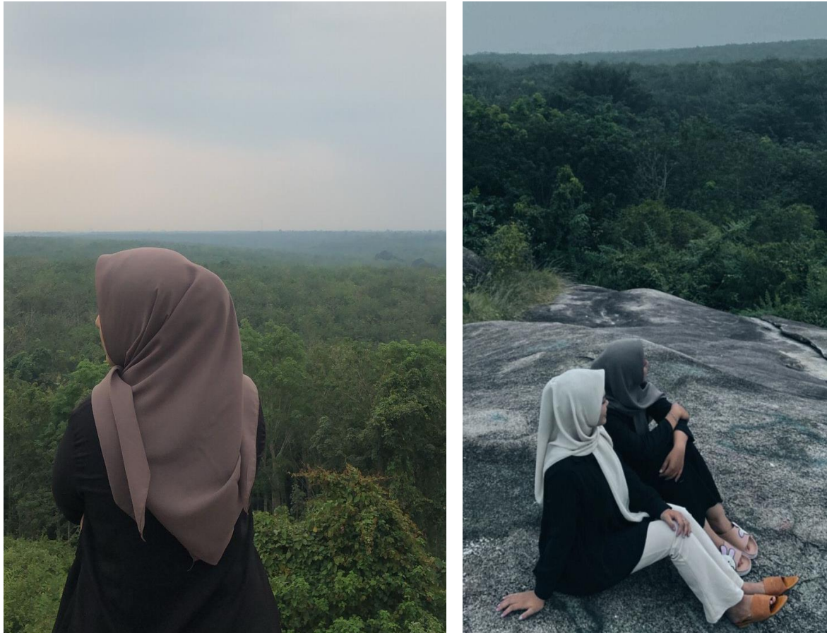
Gambar 2.3.10 Memperkenalkan objek wisata batu granit

Mahasiswa dituntut untuk tetap produktif bahkan saat waktu senggang tiba saya mencoba untuk mengexplore dan memperkenalkan objek wisata yang sangat belum terexpose ke masyarakat.