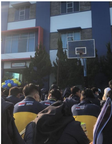
Gambar 2.3.1 pelepasan mahasiswa pkpm

Pelepasan dan Penerimaan Mahasiswa PKPM ini bertujuan untuk melepas dan meminta izin kembali kepada masyarakat sasaran untuk bisa mengabdikan dalam jangka waktu satu bulan kedepan dengan harapan kedepannya dapat memberikan solusi terkait masalah yang dialami oleh pelaku UMKM di desa Purwodadi Dalam kecamatan Tanjung Sari Kabupaten Lampung selatan, maka dari itu, perlu adanya pelepasan dan penerimaan untuk pemaparan sederhana mengenai program kerja yang akan dilaksanakan.