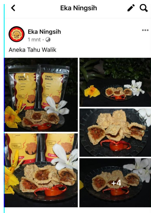
gambar 2.1.4 penjualan Facebook