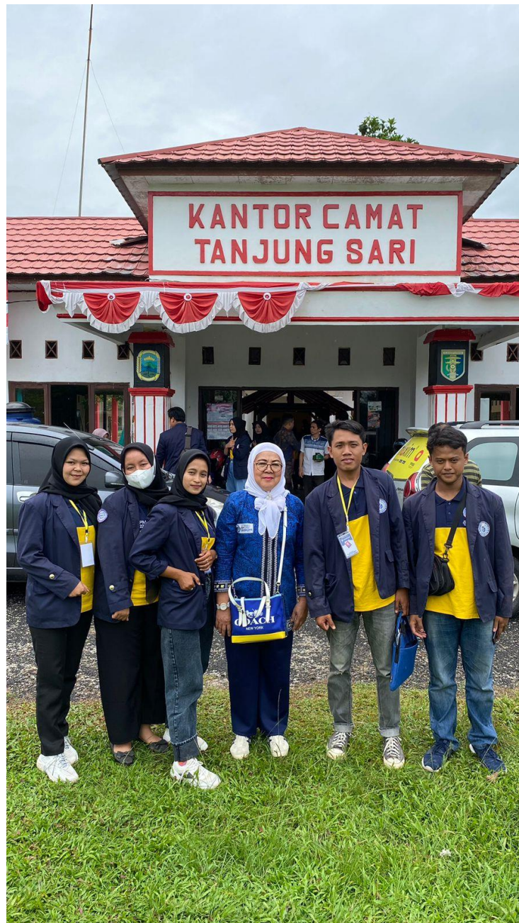
Gambar 2.3.23 Penarikan Mahasiswa PKPM

Penarikan Mahasiswa PKPM dilakukan setelah mahasiswa mengabdikan selama kurang lebih 30 hari. Melalui program PKPM ini diharapkan mahasiswa mendapatkan pengalaman belajar melalui keterlibatan secara langsung di masyarakat dan memberikan kesempatan untuk mengembangkan pemikiran di kehidupan sosial.