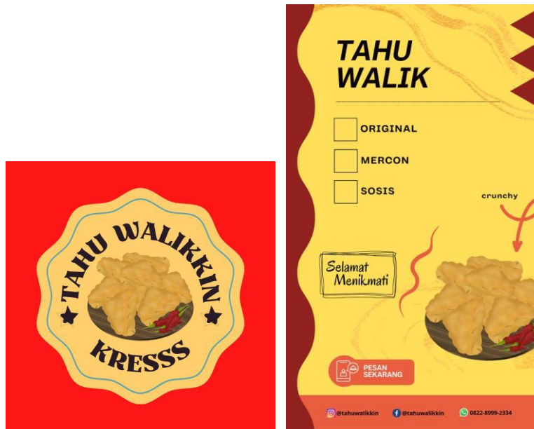
Gambar 2.3.17 pembuatan stiker logopengemasan tahu

Mahasiswa membantu pemilik UMKM dalam pembuatan logo pengemasan produk agar dapat menjadi daya Tarik dan hak paten akan produk yang dijual.