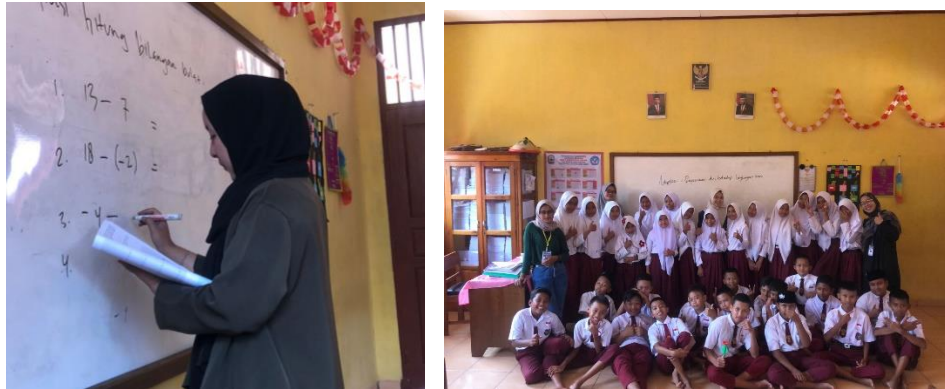
Gambar 2.3.7 Membantu kegiatan pembelajaran SD

Membantu kegiatan pembelajaran di SD di desa Purwodadi Dalam, guna menggali potensi yang ada pada siswa/siswi SD yang ada di Desa Purwodadi Dalam, agar Sumber Daya Manusia (SDM) yang ada dapat berkembang secara optimal.