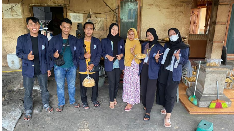
Gambar 2.3.2 kunjungan Mahasiswa ke UMKM

Tujuan kunjungan ini adalah untuk mendapatkan beberapa informasi mengenai potensi desa yang bertujuan untuk meningkatkan kesejahteraan, kesehatan, dan perkembangan UMKM di Desa Purwodadi Dalam.