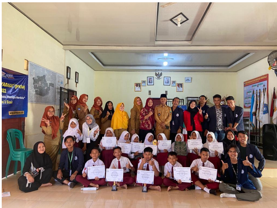
Gambar 2.3.19 Kegiatan LCT