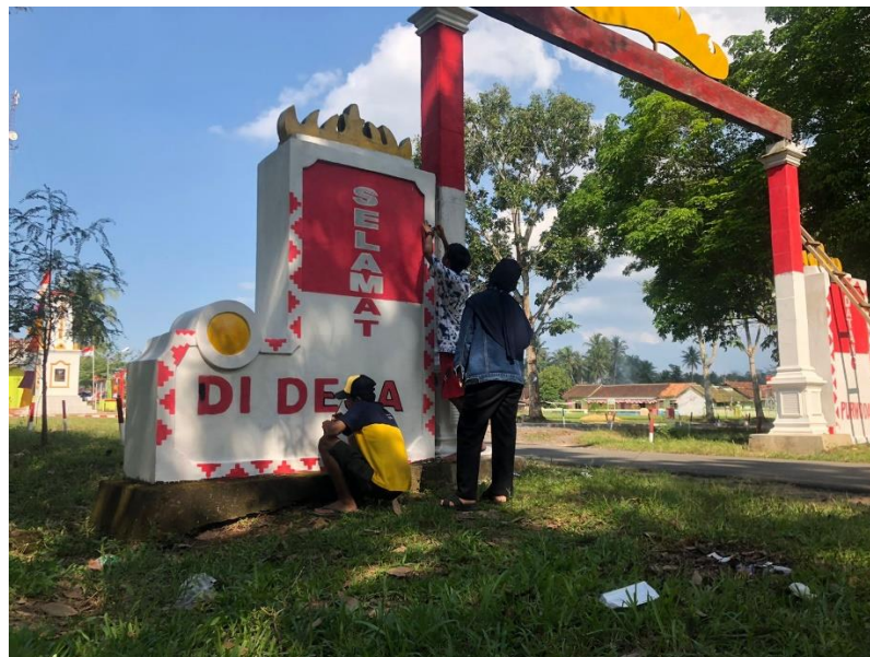
Gambar 2.3.5 Gotong Royong