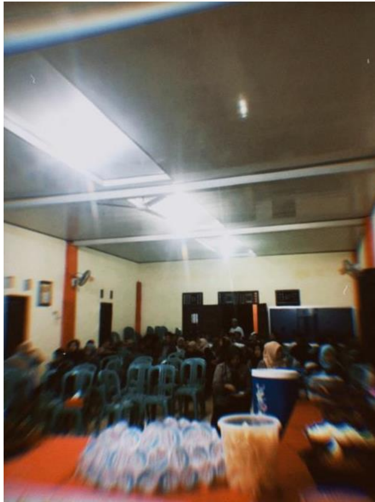
Gambar 2.3.22 Perpisahan Mahasiswa dan pemilik UMKM serta masyarakat desa

Acara perpisahan menjadi momentum untuk mengucapkan terima kasih kepada pihak UMKM yang telah memberikan kesempatan kepada mahasiswa PKPM untuk aktualisasi diri. Selain itu merupakan perpisahan Bersama aparaturnya desa dan masyarakat desa.