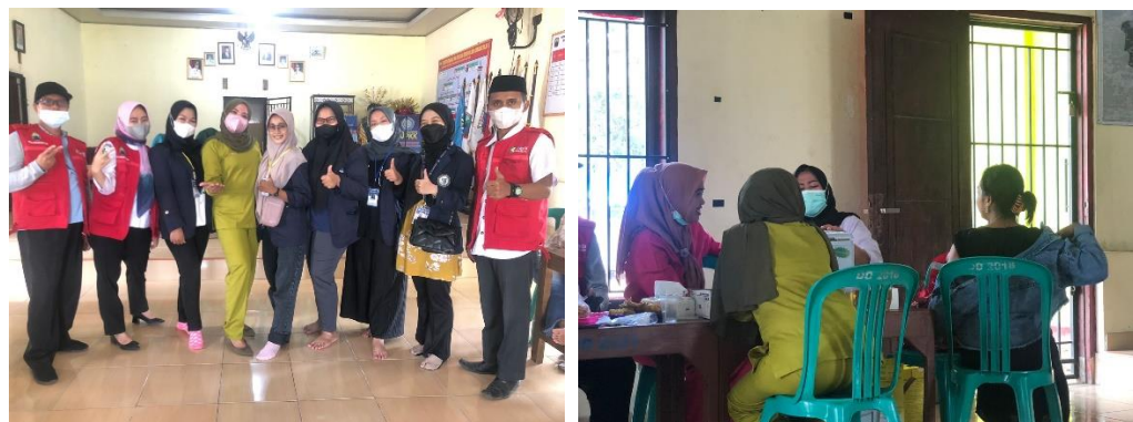
Gambar 2.3.3 Membantu kegiatan vaksin

Membantu kegiatan Vaksin di desa Purwodadi Dalam, agar masyarakat terjaga imunitas tubuh di masa pandemic covid-19.