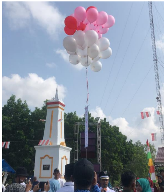
Gambar 2.3.9 Kegiatan 17 Agustus