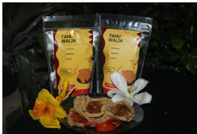
Gambar 2.3.18 Foto Produk UMKM

Membantu pemilik UMKM untuk foto produk inovasi tahu untuk meningkatkan mutu dan dsaya Tarik masyarakat, serta agar produk yang dibuat lebih higienis da tahan lama.