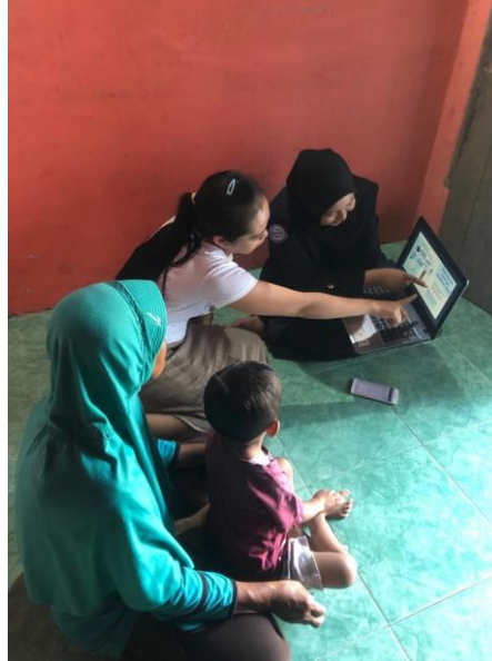
Gambar 2.3.13 Pengenalan strategi marketing kepada pemilik UMKM