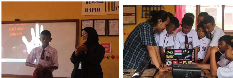
Gambar 2.3.8 Sosialisasi Mengenai PHBS dan Pengenalan Komputer

Sosialisasi kepada siswa/siswi SD di desa purwodadi dalam mengenai Prilaku Hidup Bersih dan Sehat (PHBS) agar siswa/siswi dapat menerapkan prilaku hidup bersih dan sehat di lingkungan sekolah maupun di lingkungan masyarakat. Sosialisasi mengenai pengenalan computer guna meningkatkan pengetahuan siswa/siswi terhadap computer .