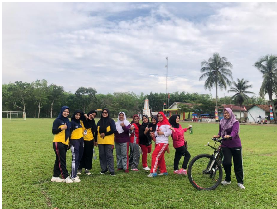
Gambar 2.3.6 Senam rutin Bersama ibu ibu desa purwodadi dalam