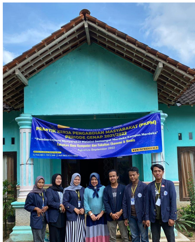
Gambar 2.3.14 Kunjungan DPL

Kunjungan Dosen Pembimbing Lapangan guna untuk mengetahui dan memantau mahasiswa PKPM secara langsung dilapangan dalam kegiatan dan Program kerja yang dilakukan mahasiswa apakah terdapat kendala dan hambatan, serta memberikan saran dan arahan terhadap mahasiswa PKPM.