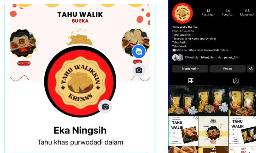
Gambar 2.3.12 pembuatan media social

Membantu Pemilik UMKM membuat social media untuk meningkatkan penjualan guna mengembngkan usaha yang dimiliki. Manfaat utama dari penggunaan media sosial yaitu sebagai transformasi media digital marketing. Pemanfaatan platform ini akan menjadi media pemasaran yang unggul dibandingkan dengan pemasaran secara manual. Penggunaan media ini akan menjangkau caloncustomer jauh lebih luas. Disamping itu pendistribusian produk akan lebih