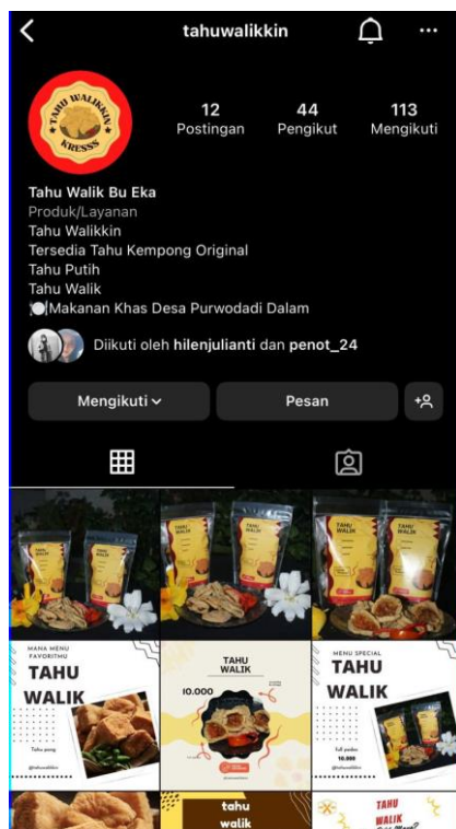
Gambar 2.1.3 akun instagram