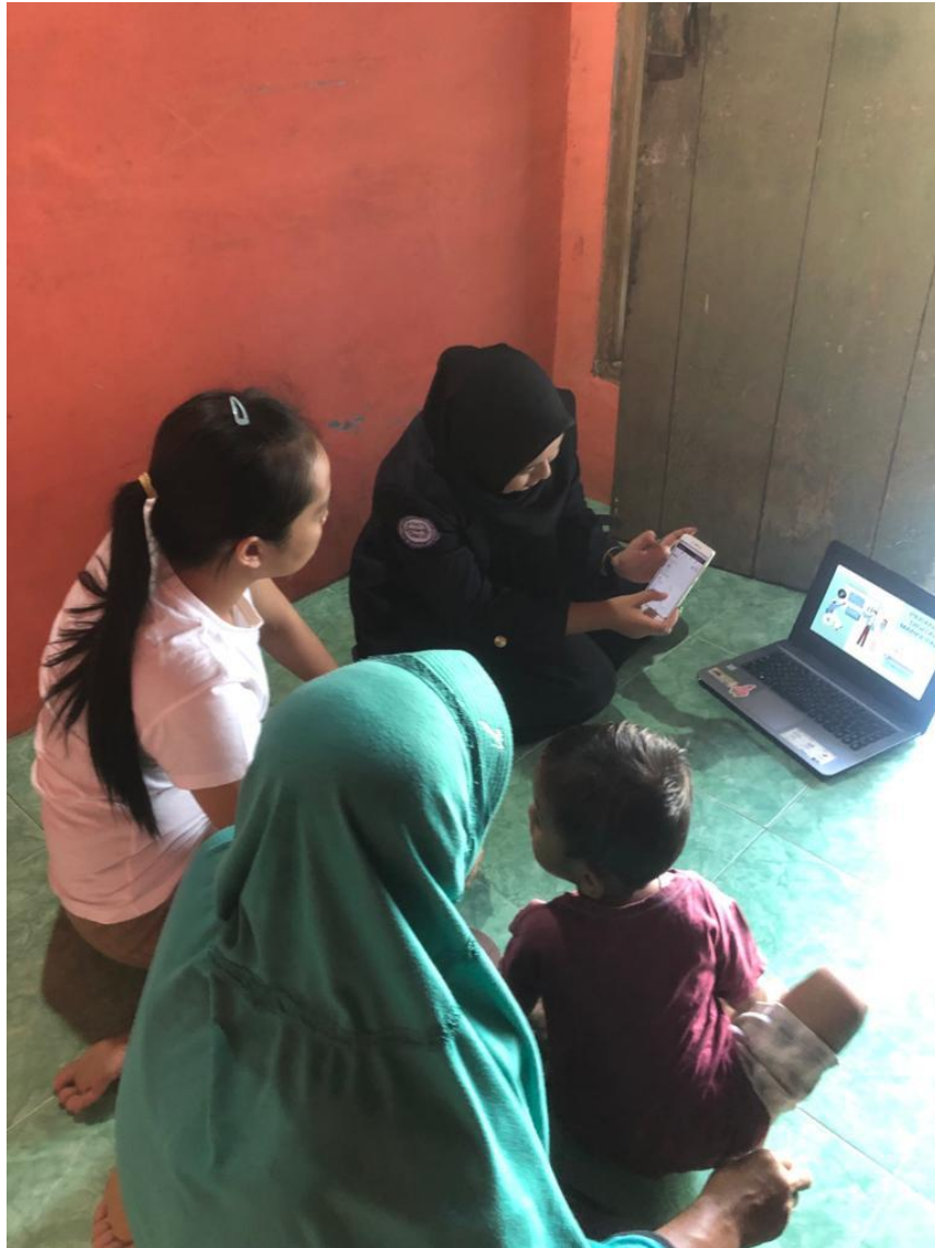
Gambar 2.3.11 Pengenalan Sosial Media Kepada Pemilik UMKM

Mengenalkan social media kepada pemilik UMKM Tahu agar dapat mengerti apa itu social media, dan bagaimana menjalankan social media, guna mengikuti perkembangan di era digital.