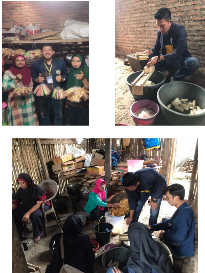
Gambar 2.2 Pengelolaan Bahan Baku Dan Pengemasan

untuk berjalanya aktifitas produksi. Dan dalam pengelolaannya harus di laksanakan dengan baik agar hasil dan kinerja dapat maksimal. Pengemasan ini bertujuan untuk menampilkan image dan pandangan terhadap suatu isi produk, maka pengemasan biasanya dibentuk atau didisain dengan sebaik mungkin sehingga dapat menampilkan pandangan yang baik dan memiliki daya tarik konsumen.