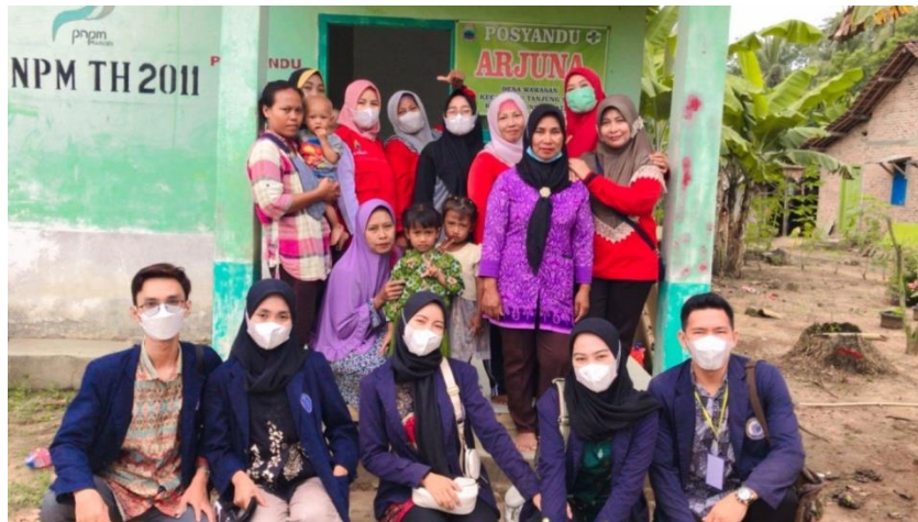
Gambar 2.3 Kegiatan Sosial Bersama Ibu-Ibu Posyandu

Keluarga Berencana, Imuniasi, Gizi, dan pendidikan pola hidup sehat yang di terapkan kapada masyarakat khususnya di Desa Wawasan.