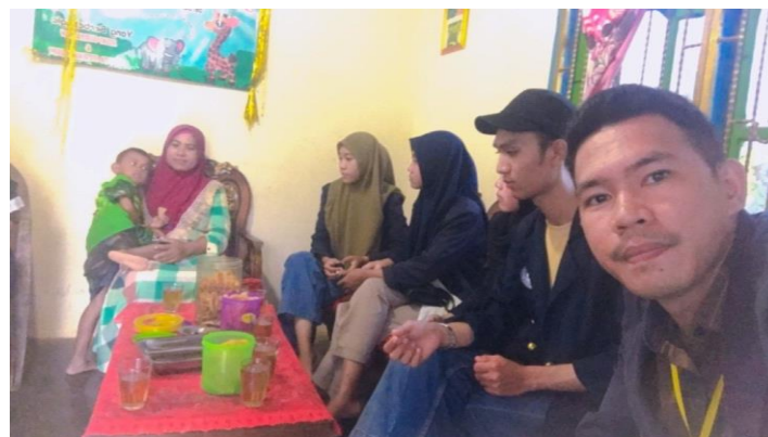
Sosialisasi Kepada Ibu-Ibu UMKM KWT Maju Bersama