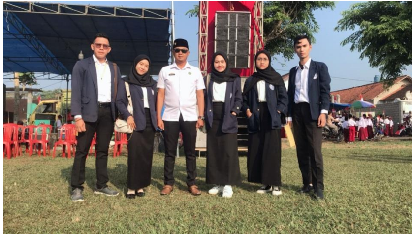
Menghadiri Dan Mengikuti Upacara 17 Agustus