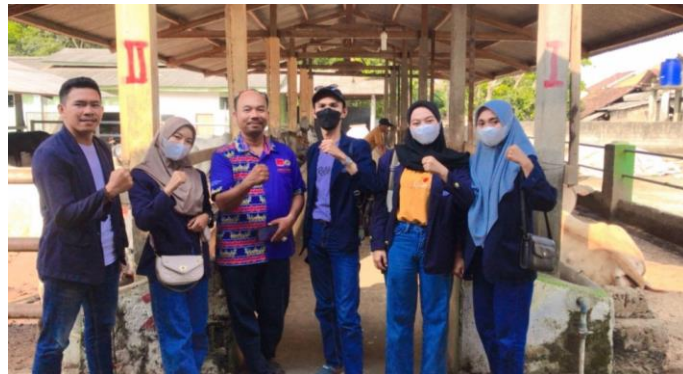
Kunjungan Kepertenakan sapi