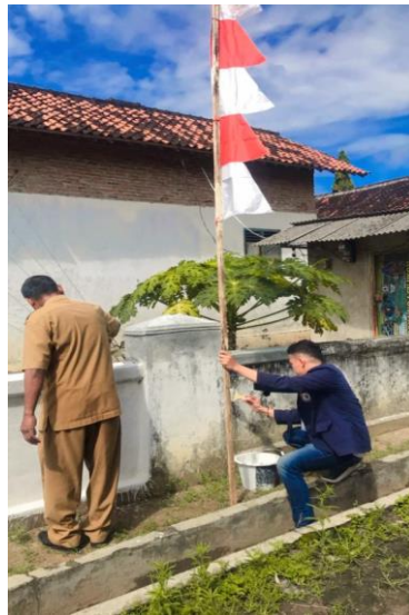
Kegiatan Mengecat Bersama Aparatur Kampung Di Bali Desa