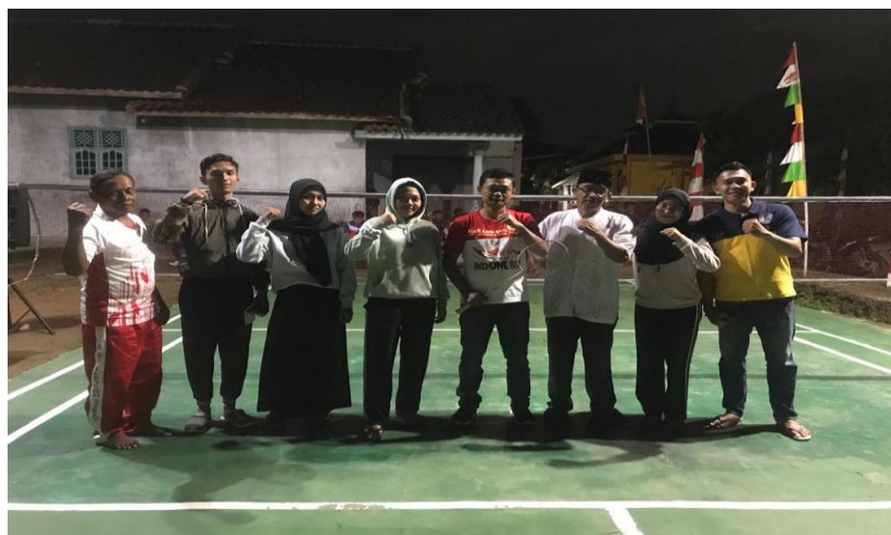
Pembukan Turnamen Bulutangkis