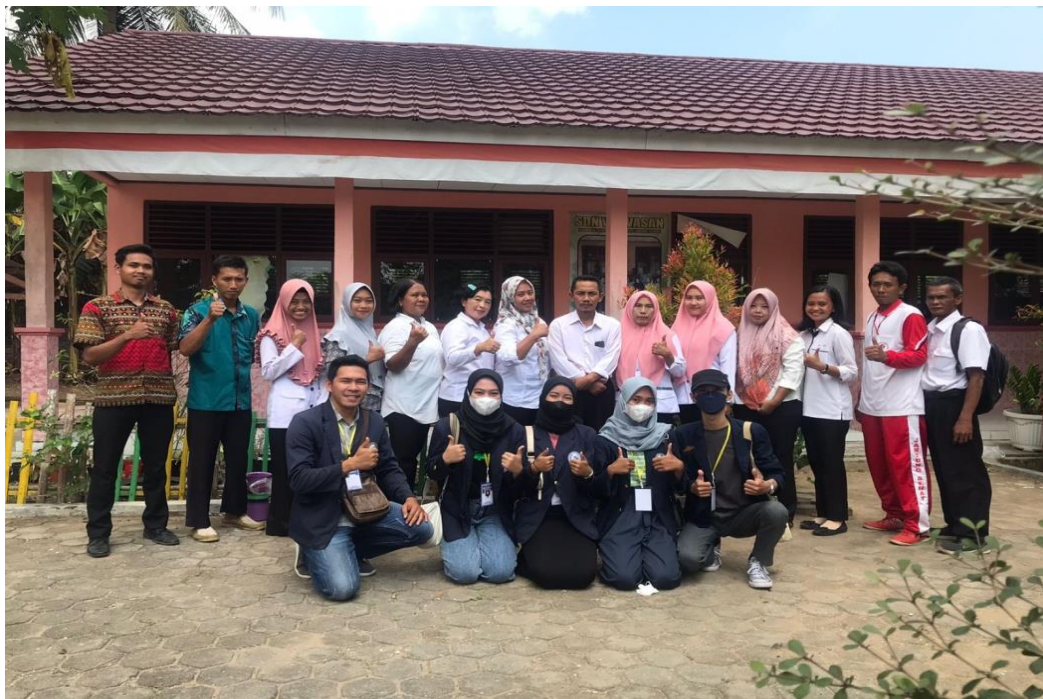
Foto Bersama Bpk Ibu Dewan Guru SD Wawasan