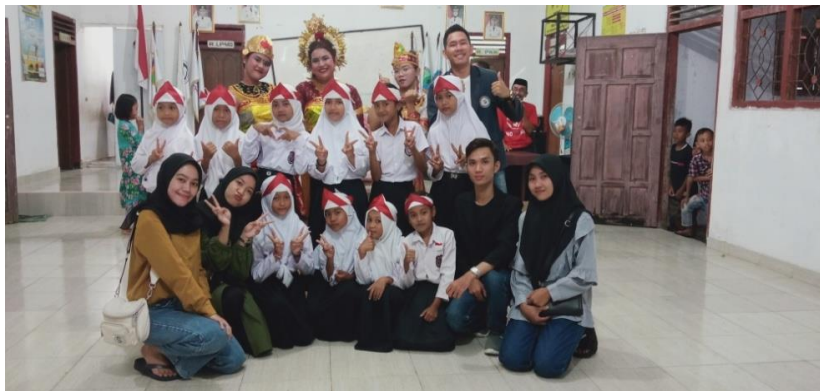
Mengikuti Malam Puncak Pembagian Hadiah Lomba 17 Agustus