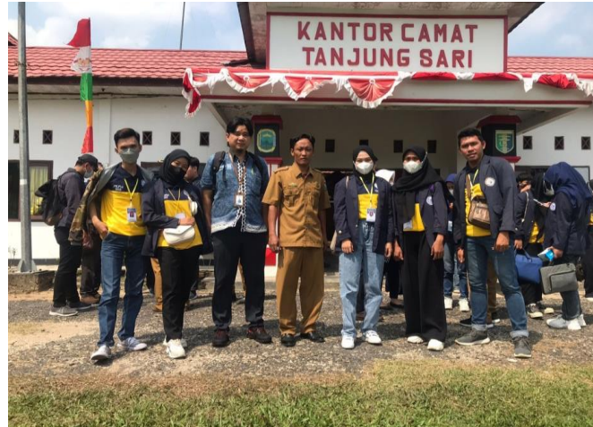
Penyerahan Mahasiswa PKPM Dikantor Kecamatan