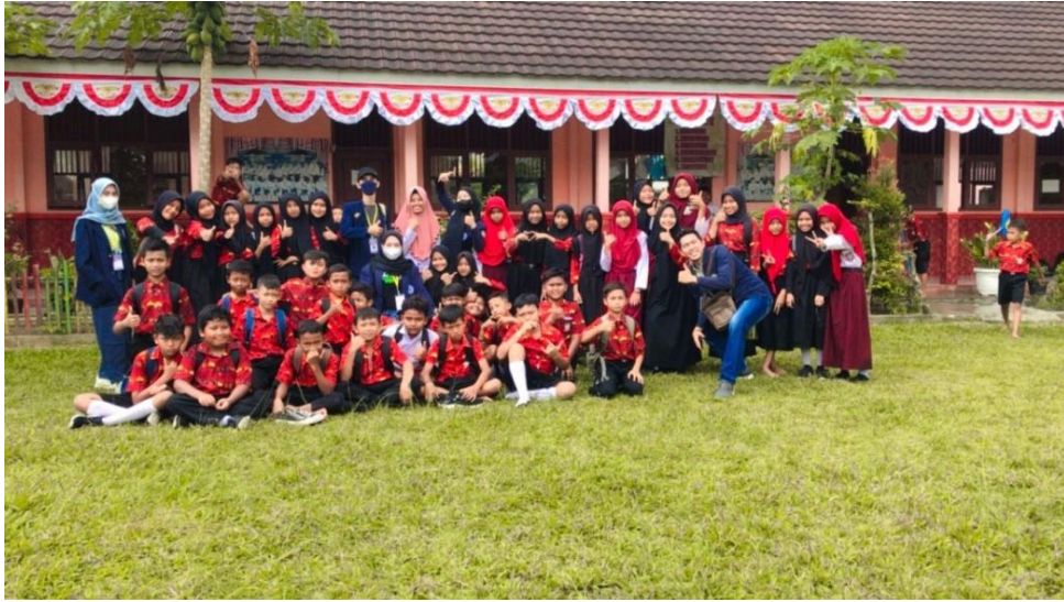
Sosialisasi Ke SD Wawasan