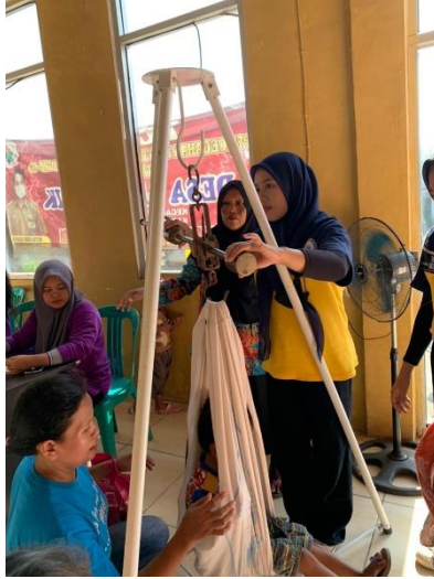
Gambar 17. Menimbang bayi pada kegiatan posyandu balita