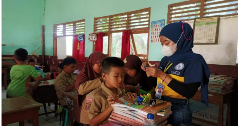
Gambar 11 . Mengajarkan Siswa/I pembuatan kerajinan tangan