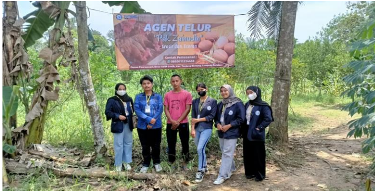
Gambar 13. Penyerahan benner UMKM Telur