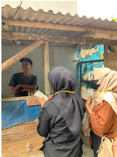
Gambar 12. Pelatihan Pembukuan terhadap UMKM Telur

Kegiatan ini bertujuan untuk membantu Pemilik UMKM Telur agar lebih mudah untuk mengatur keuangannya.