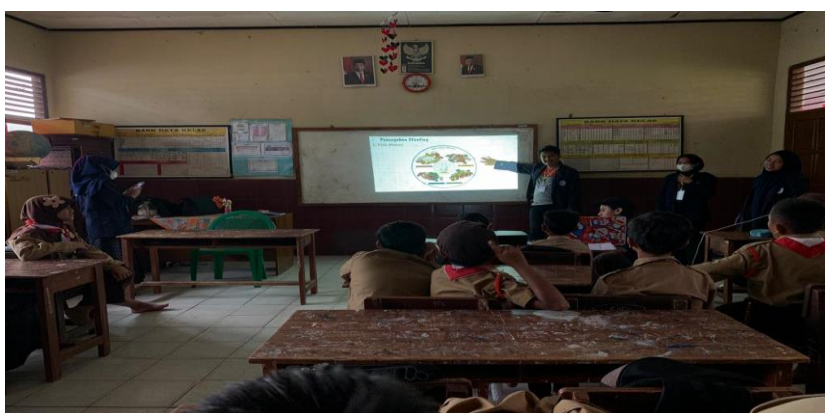
Gambar 2. Melakukan Sosialisasi Stunting

Dengan adanya program pemerintah mencegah stunting penulis membantu dengan menjelaskan kepada siswa/i SDN 2 Galih Lunik tentang pentingnya pencegahan stunting. Stunting adalah masalah kurang gizi kronis yang disebabkan oleh kurangnya asupan gizi dalam waktu yang cukup lama, sehingga mengakibatkan gangguan pertumbuhan pada anak yakni tinggi badan anak lebih rendah atau pendek (kerdil) dari standar usianya.