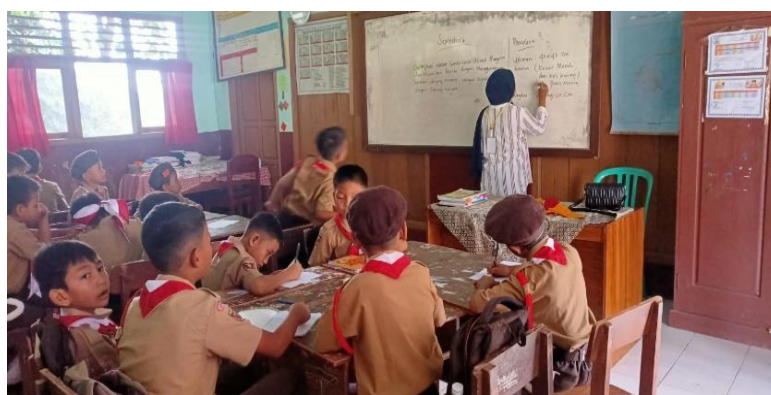
Gambar 10. Pemberian Materi Siswa/I

Kegiatan ini membantu para guru untuk memberikan ilmu kepada peserta didik di SDN 2 Galih Lunik.