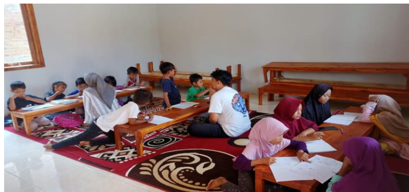
Gambar 4. Kegiatan Mengajar Di Rumah Belajar

Dengan diadakannya kegiatan Rumah Belajar ini membantu anak-anak Desa Galih Lunik mendapatkan pelajaran tambahan dengan cara mengulas pelajaran yang diajarkan oleh guru disekolah atau pun dengan membantu anak-anak mengerjakan PR dari sekolah. Dan kegiatan ini dilakukan disetiap dusun yang ada didesa galih lunik