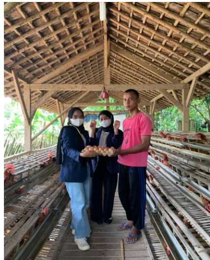
Gambar 14 .Foto Produk Telur