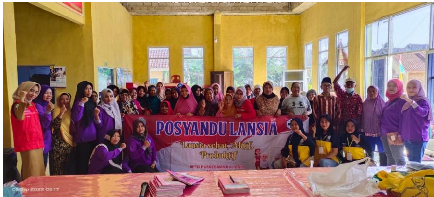
Gambar 18. Mengikuti Kegiatan Posyandu Lansia