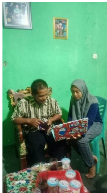
Gambar 6. Penyerahan Akun Facebook dan Logo UMKM Bengkel Las