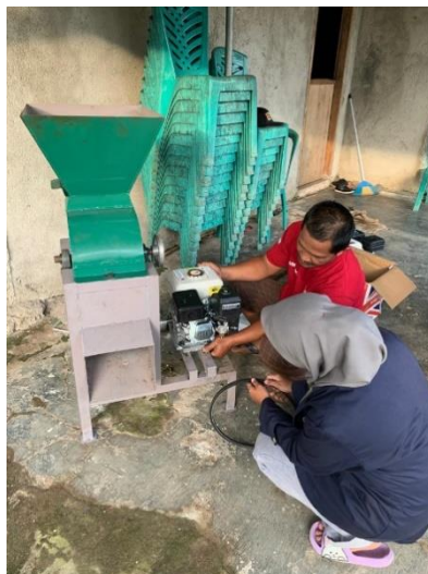
Gambar 9. Foto Produk UMKM Bengkel Las