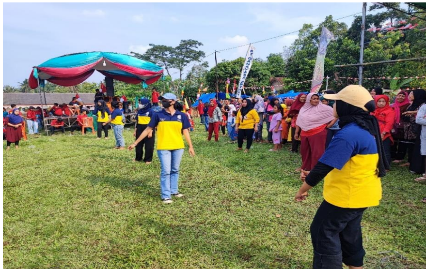
Gambar 16 . Berpartisipasi dalam memeriahkan Perlombaan HUT RI