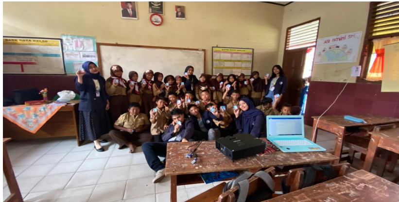
Gambar 3. Foto Bersama Siswa SDN 2 Galih Lunik