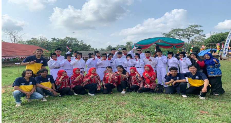
Gambar 15. Kegiatan mengikuti Upacara HUT RI