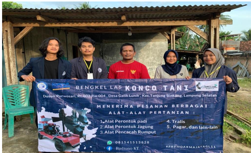
Gambar 7. Penyerahan Benner UMKM Bengkel Las