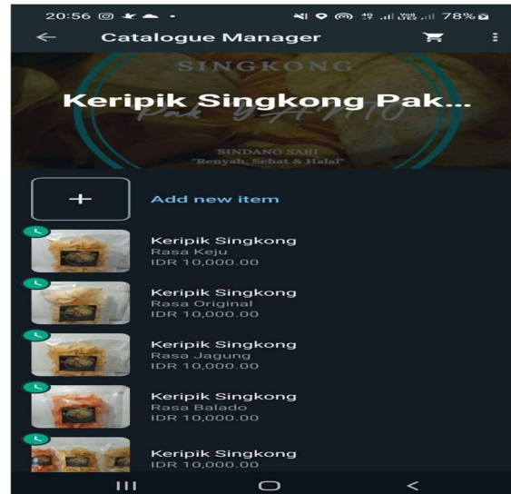
Gambar 2.2 Foto dari Whatsapp Business UMKM Keripik Singkong