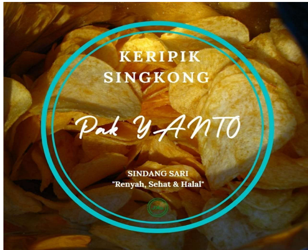
Gambar 2.5 Foto Produk Pengemasan Keripik Singkong (Sebelum)