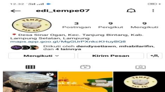
Gambar 1.3 Kegiatan Pemasaran Produk

Pemasaran Tempe tidak hanya dipasarkan secara offline tetapi juga dipasarkan melalui media sosial seperti Instagram, Facebook dan juga WhatsApp.