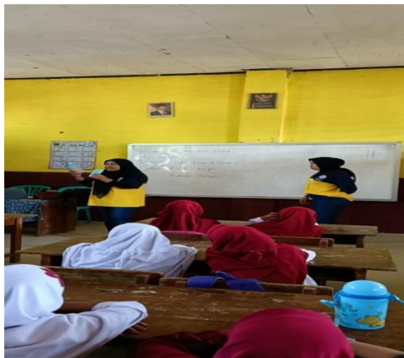
Gambar 1.6 Pentingnya Menabung Sejak Dini

Pentingnya menabung sejak dini membantu mengelola uang untuk masa depan, bertujuan untuk mengajak anak-anak untuk kebiasaan baik secara terus menerus. Sosialisasi ini dilakukan di SD Negeri 01 Sinar Ogan mengajarkan anak-anak untuk menghargai uang, disiplin dan hidup hemat.