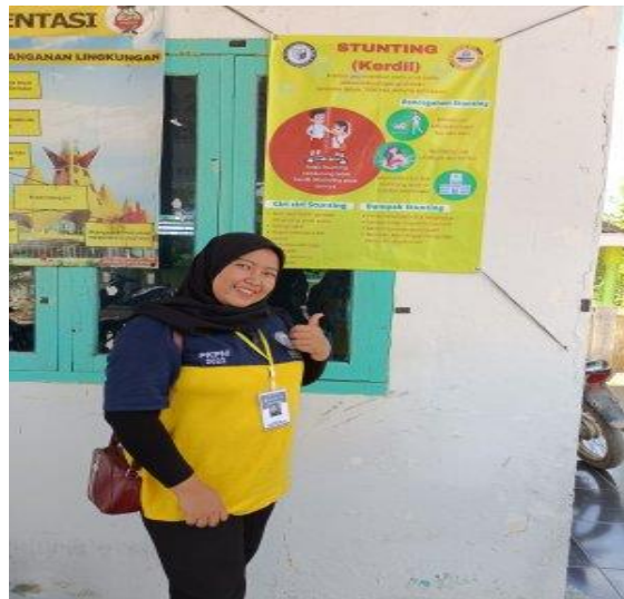
Gambar 1.8 Pemasangan Poster Stating