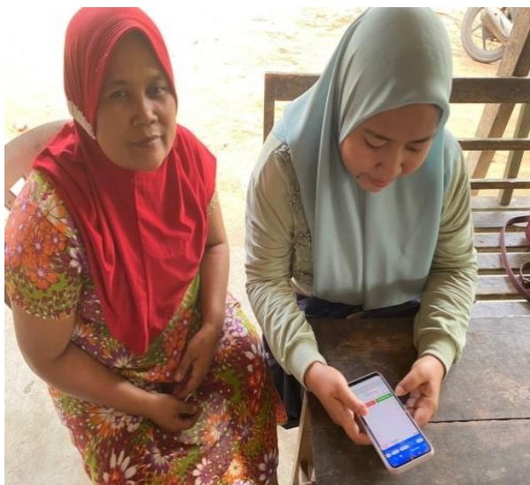
Gambar 1.7 Sosialisasi Pembukuan Ibu Rumah Tangga Dengan Buku kas

Sosialisasi ini dilakukan untuk membantu ibu rumah tangga mengelola keuangan. Kegiatan ini memotivasi wawasan dan pemahaman mengenai pembukuan dan penyusunan laporan keuangan demi terciptanya keharmonisan keluarga.