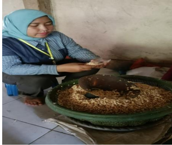
Gambar 1.1 Proses Pembuatan Tempe