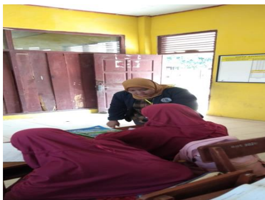
Gambar 1.9 Pendampingan Belajar

Di salah satu SD adalah SDN 1 Sinar Ogan. Sekolah Dasar ini menerapkan sekolah tatap muka. Pendampingan ini dilakukan agar siswa tetap bisa belajar dan dengan mudah menyerap ilmu yang sedang mereka pelajari. Banyak siswa yang kurang paham dengan pembelajaran. Kegiatan pendampingan ini dilakukan dengan cara membantu pengerjaan tugas dan juga menjelaskan kembali materi yang mereka dapat dari guru.