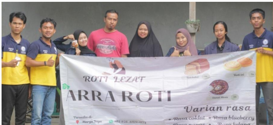
Kegiatan Pemasangan Banner Pemilik UMKM Arra Roti