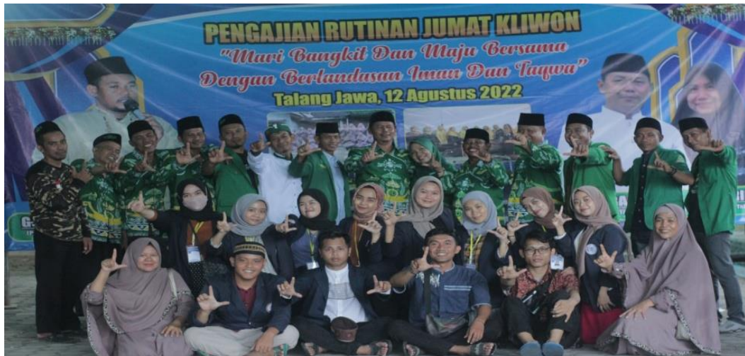
Kegiatan Pengajian Rutin Jumat Kliwon Desa Talang Jawa