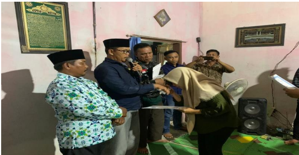
Pemberian Piagam Penghargaan Kepada Mahasiswa PKPM IIB Darmajaya