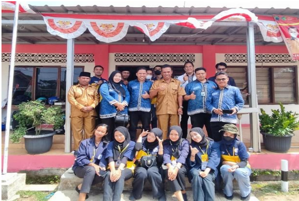
Kegiatan Pelepasan Mahasiswa PKPM di Balai Desa Talang Jawa