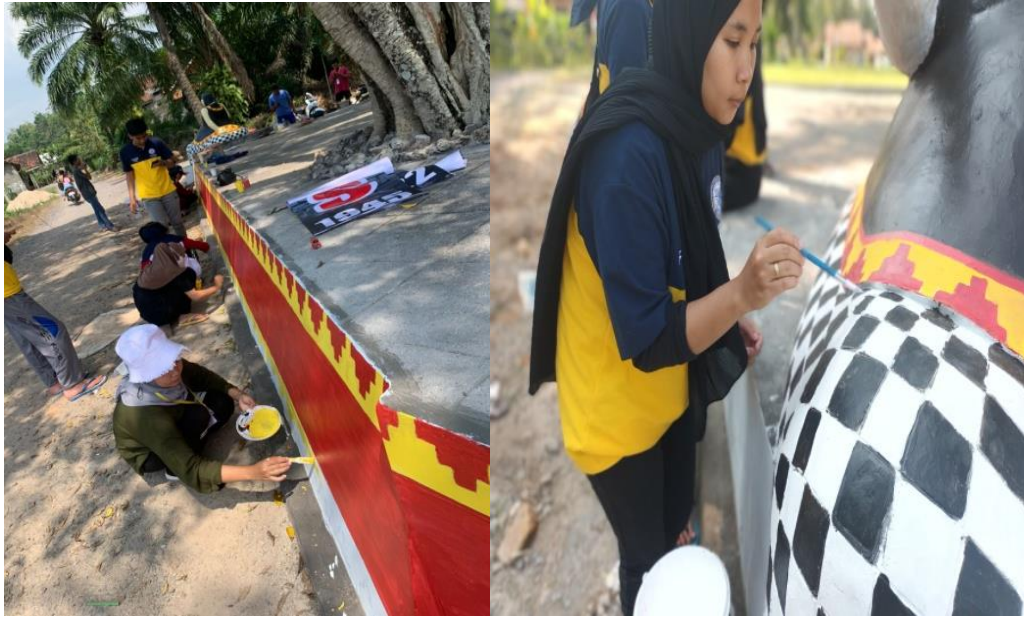
Membantu Menghias Dan Melukis Gapura Di Lapangan Desa Talang Jawa