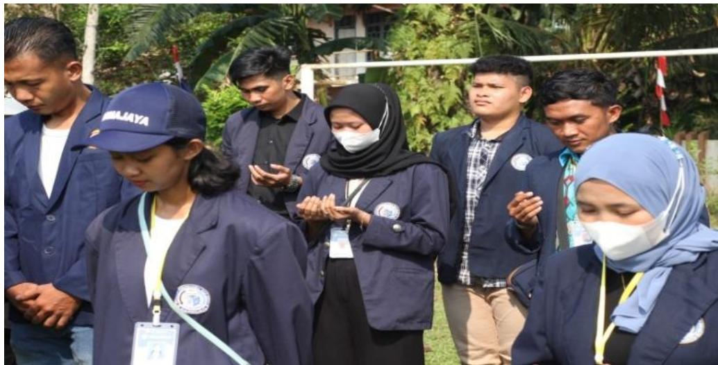
Kegiatan Upacara Kemerdekaan Republik Indonesia ke-77