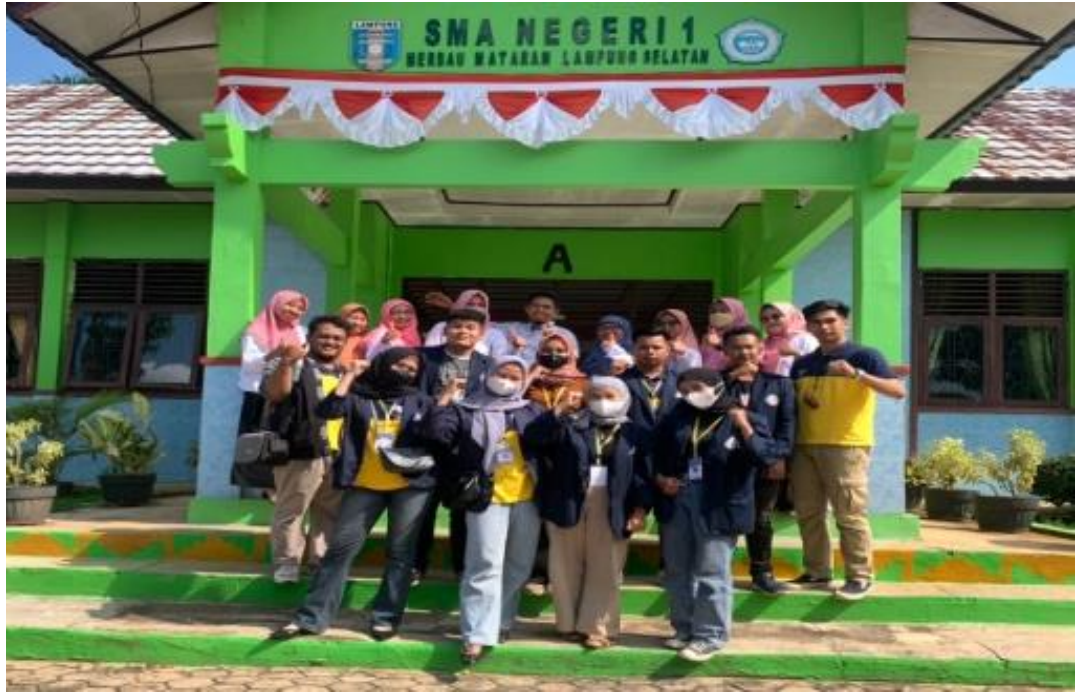
Foto Bersama Dengan Dewan guru SMAN 1 Merbau Mataram