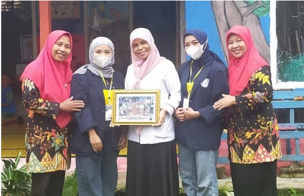
Pemberian Cendera Mata Kepada TK Bina Mulya II