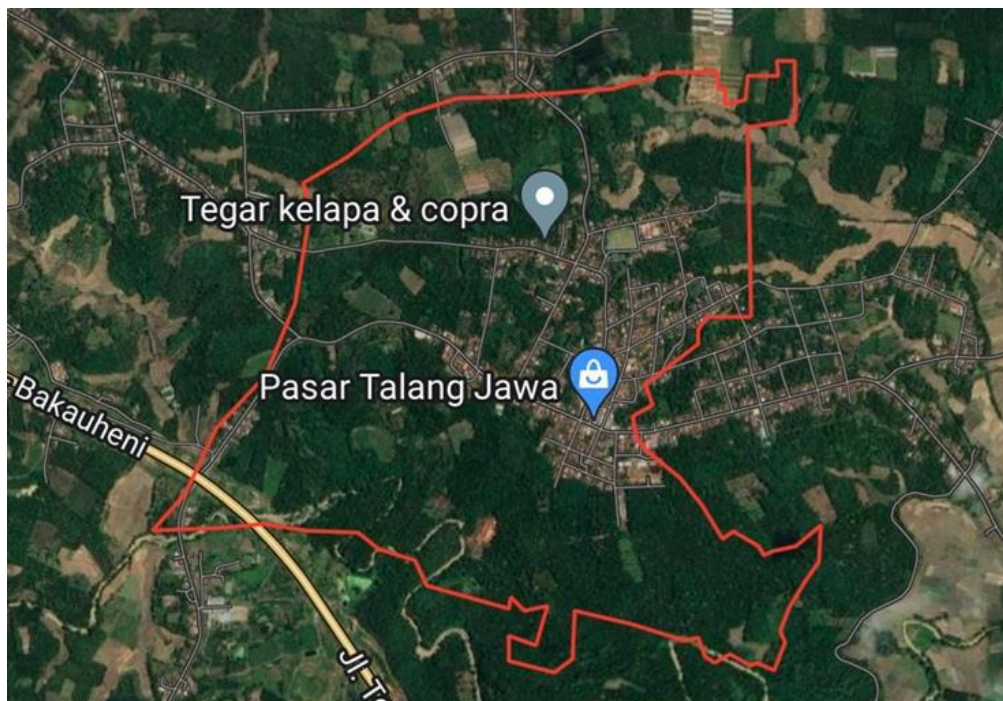
Peta Lingkungan Desa Talang Jawa