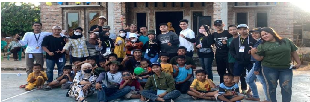
Membantu Pelaksanaan Lomba 17 Agustus di Dusun Marga Jaya