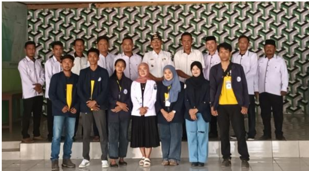
Pelepasan Mahasiswa PKPM Dengan Aparat Desa