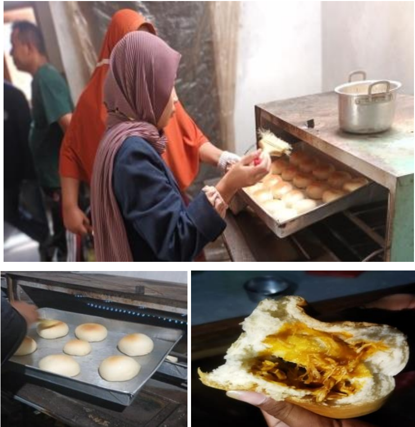
Gambar 2.3 Kegiatan Produksi Roti Isi Ayam