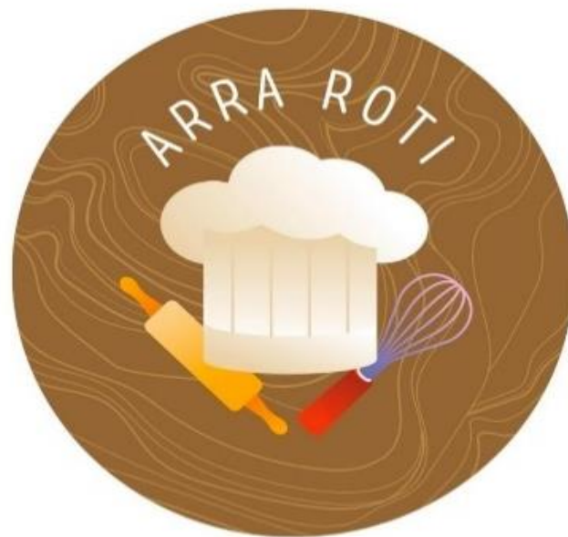
Gambar 2.1 Logo UMKM Arra Roti

Logo, dan banner merupakan sebuah identitas usaha yang sangat bermanfaat bagi sebuah usaha. Adanya logo, kartu nama, dan banner, pelanggan akan lebih mudah mengetahui informasi tentang usaha tersebut.