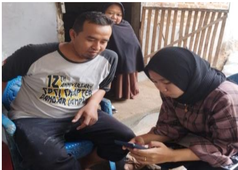
Gambar 2.8 Pelatihan Penggunaan Aplikasi Stroberi Kasir

pembukuan secara digital, proses pencatatan akan lebih cepat dan laporan keuangan akan lebih akurat