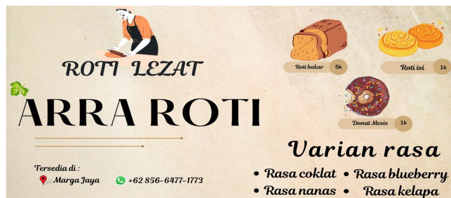
Gambar 2.2 Banner UMKM Arra Roti