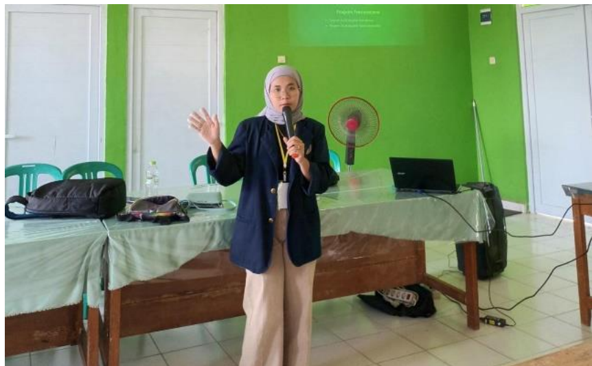
Gambar 2.10 Kegiatan Mengajar di SMAN Merbau Mataram

Kegiatan di SMA Negeri 1 Merbau Mataram ini merupakan kegiatan sosialisasi mengenai “Profil dan Sejarah DARMAJAYA”