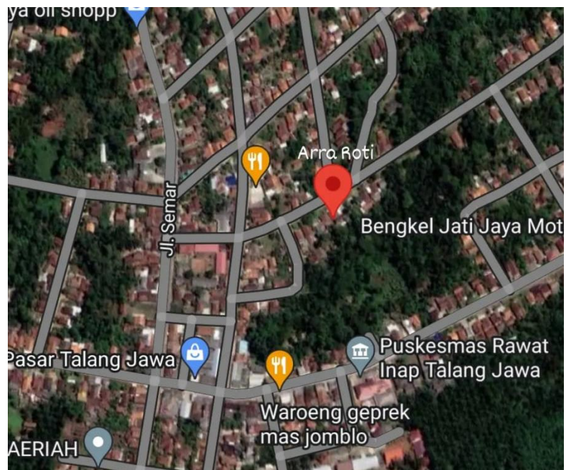
Gambar 2.6 Peta UMKM Arra Roti