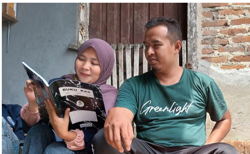
Gambar 2.7 Pelatihan pencatatan keuangan

Kegiatan ini memberikan pemahaman mengenai pencatatan akuntansi secara manual dibuku catatan keuangan. Dengan adanya laporan keuangan yang tepat dan jelas, pemilik UMKM akan lebih mudah mengetahui perkembangan keuangan UMKM yang dimilikinya.