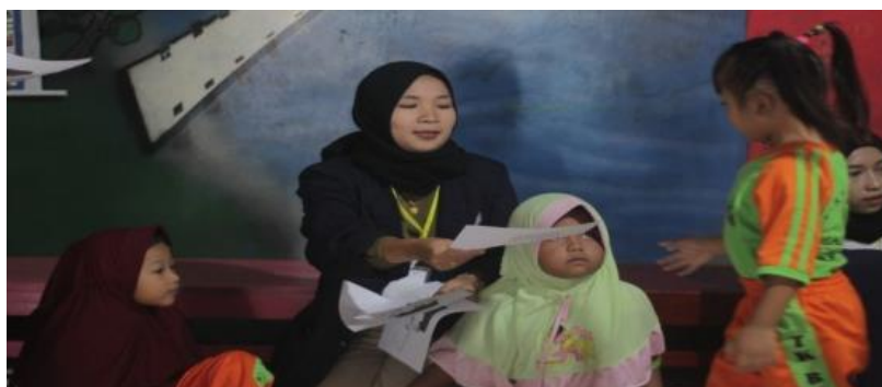
Gambar 2.9 Kegiatan Mengajar TK Bina Mulya II

TK Bina Mulya II adalah jenjang pendidikan anak usia dini yang berada di Dusun Tasik Madu, Desa Talang Jawa, Kecamatan Merbau Mataram, Kabupaten Lampung Selatan. Pada kesempatan ini, penulis membantu kegiatan belajar mengajar di TK Bina Mulya II.