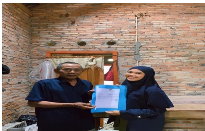
Gambar 2.3.6 Pendaftaran Perizinan NIB