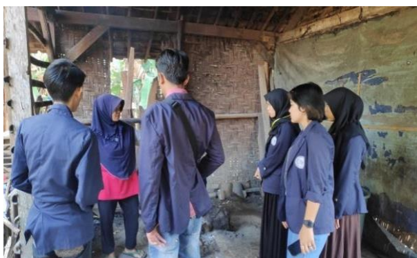
Gambar 2.3.2 Kunjungan Ke UMKM Tempe Mbah Mul