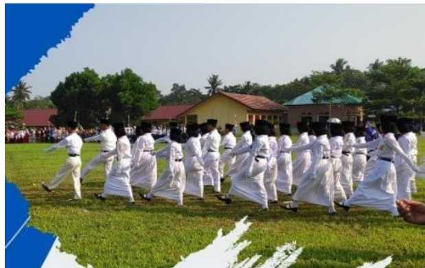
Gambar 2.3.5 Perayaan 17 Agustus 2022 Desa Purwotani

Pada hari kemerdekaan Republik Indonesia yang ke – 77 tepatnya pada hari Rabu, 17 Agustus 2022 kami melaksanakan Upacara Bendera di lapangan balai desa purwotani. Semua warga hadir untuk ikut serta memperingati hari kemerdekaan Indonesia.