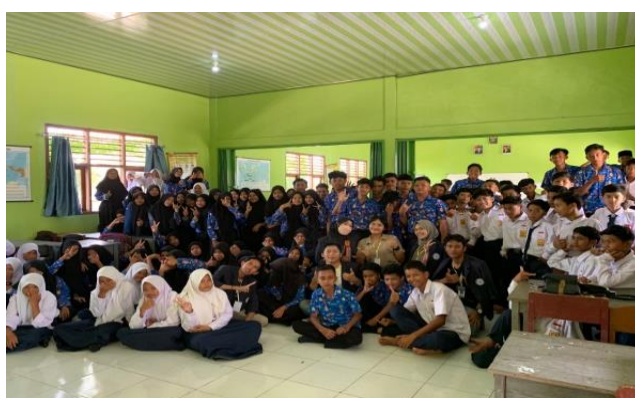
Gambar 2.3.8 Pembelajaran SMP Purwotani

Kegiatan pada hari berikutnya yaitu memberi pengajaran pada siswa SMP mengenai cara menggunakan komputer yang baik dan benar, serta memberi pengajaran tentang menabung.