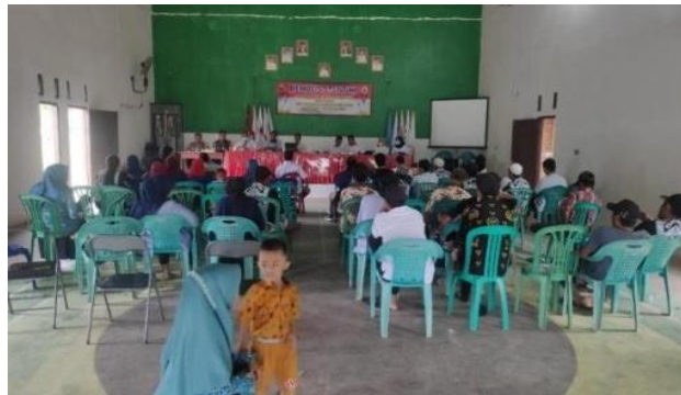
Gambar 2.3.9 Pembuatan Plang Jalan & Sosialisasi Stunting