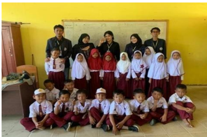
Gambar 2.3.7 Pembelajaran SD Purwotani