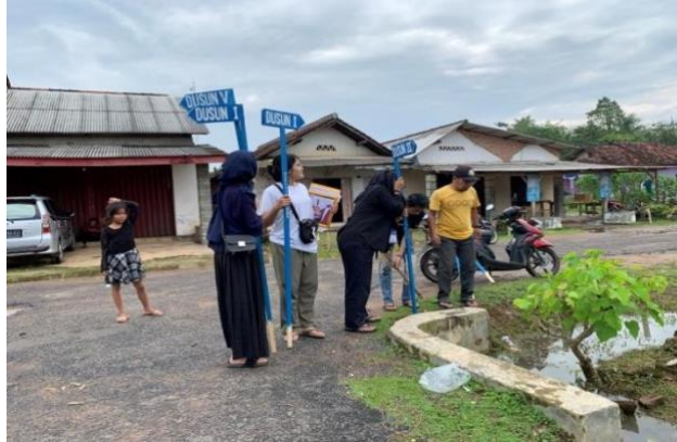
Gambar 2.3.10 Pemasangan Plang Jalan