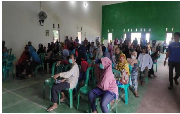
Gambar 2.3.4 Administrasi BLT

Pada hari Senin, 15 Agustus 2022 kami melakukan kegiatan di Balai Desa terkait pendataan Administrasi Dalam pembagian BLT.