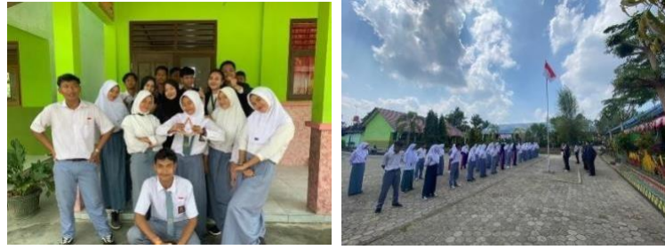
Mengunjungi Paskibraka Desa kertosari di SMA Assalam