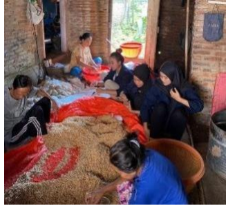
Membantu pengemasan tempe