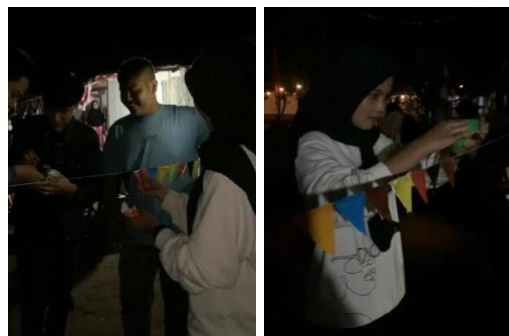
Membantu Persiapan Lomba di Dusun 1