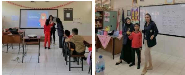
Kegiatan Sosialisasi Pengenalan Perangkat Laptop Kepada Siswa/i SDN 1 Kertosari