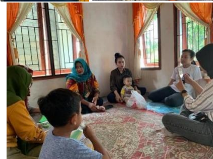
Mengunjungi Indikasi Stunting