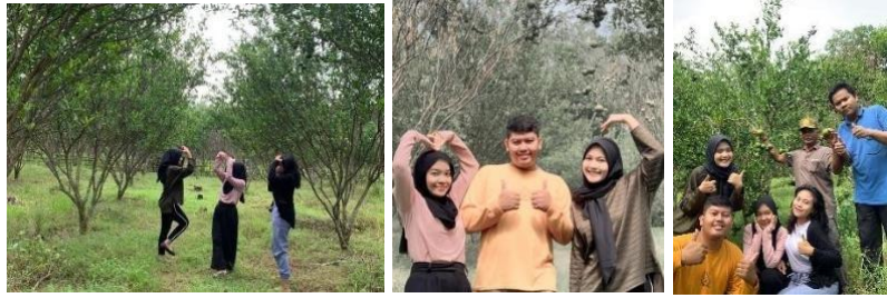
Mengunjungi Kebun Jeruk