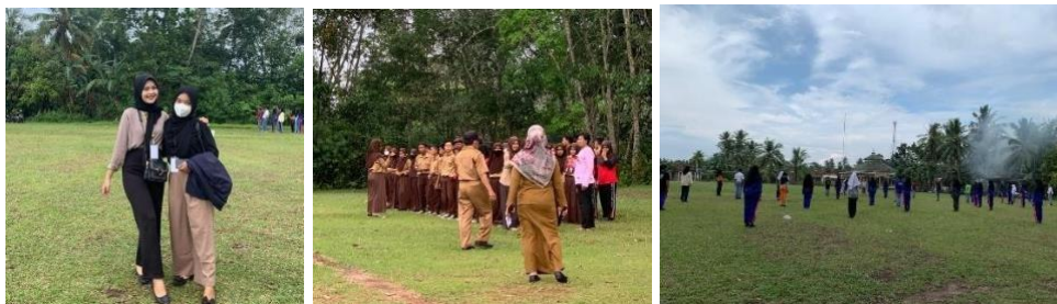
Gladi Bersih Upacara Kemerdekaan