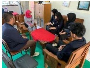
Meminta Izin Sosialisasi Perangkat Laptop kepada Pihak Sekolah