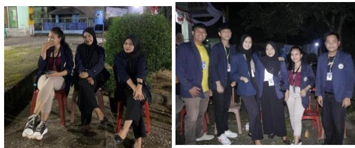
Panitia Penerima Tamu Wayangan