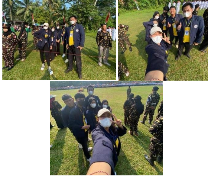
Mengikuti Upacara Kemerdekaan 17 Agustus 2022 di Lapangan Desa Kertosari