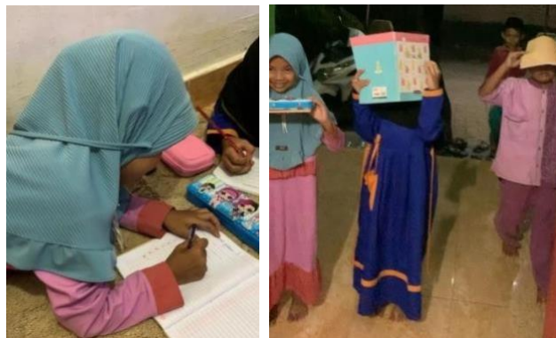
Mendampingi anak-anak mengerjakan tugas sekolah