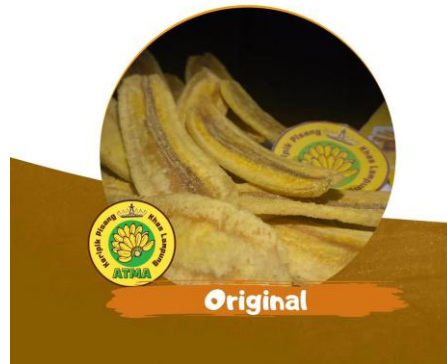
Gambar 2.5 & Gambar 2.6