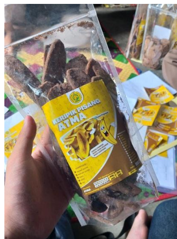
Gambar 2.3 & Gambar 2.4