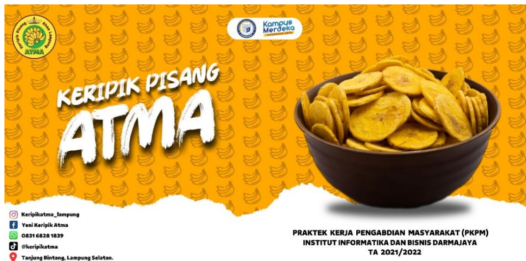
Gambar 2.2 Desain Banner Baru UMKM Keripik Pisang Atma