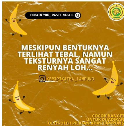
Gambar 2.5 Tampilan Konten Desain promosi Keripik Pisang Atma

sebagai sarana komunikasi terbaik dengan konsumen ataupun calon konsumen. Proses ini memanfaatkan desain grafis, saat desain Promosi yang dibuat dengan desain grafis di sebarakan melalui akun sosial media maka akan menambah daya tarik dari produk yang dipasarkan.