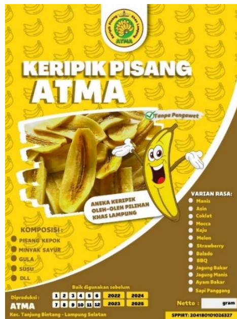
Gambar 2.4 Desain Kemasan Setelah Dilakukan Rebranding