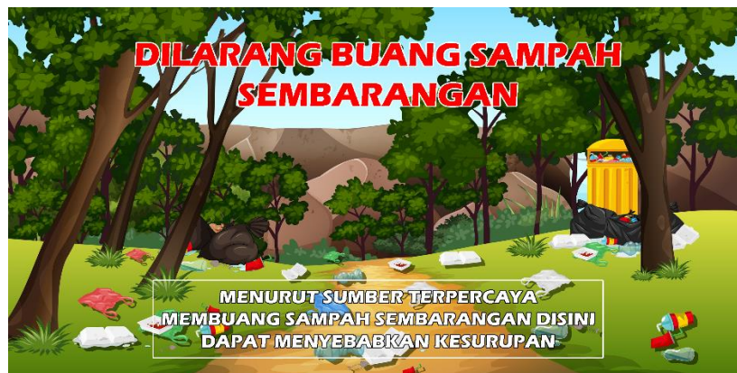
Gambar 2.11 Desain Banner Dilarang Membuang Sampah Sembarangan