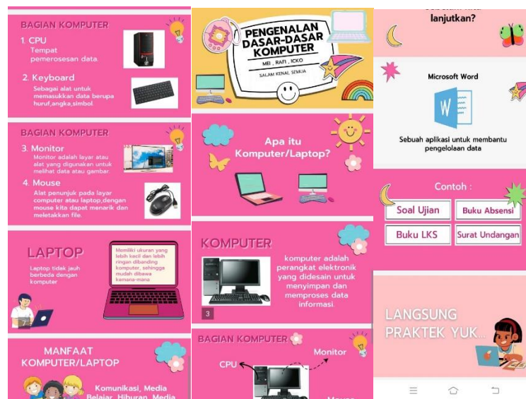
Gambar 2.8 Tampilan Power Point Pengenalan Dasar-Dasar Komputer