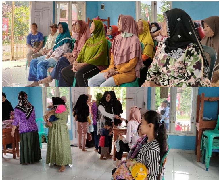
2.15 Foto Saat Posyandu Lansia dan Posyandu Balita

Selain membantu kegiatan gotong royong dan ikut serta dalam memeriahkan hari kemerdekaan, setiap minggu juga selalu membantu kegiatan posyandu rutin di posyandu yang ada di desa Srikaton, dimulai dari posyandu balita , ibu hamil hingga lansia. Pada kegiatan posyandu yang dilakukan ikut membantu dalam pendataan, registrasi, penimbangan berat badan, pengukuran tinggi badan hingga membantu menertibkan antrian dan membantu memberikan vitamin. Saat posyandu lansia ikut serta dalam senam lansia yang di lakukan setiap kegiatan posyandu berlangsung. Posyandu di Desa Srikaton selalu ramai dan masyarakat yang mengikuti kegiatan baik dari ibu hamil dan lansia sangat mudah di atur dan tertib dalam antrean.