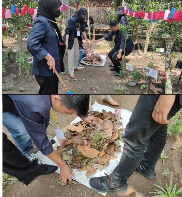
Gambar 2.12 Melakukan Gotong Royong Di Kebun Toga

gunung batu 1. Kegiatan gotong royong berlangsung sampai siang hari lalu di lanjutkan dengan persiapan lomba hingga sore hari.