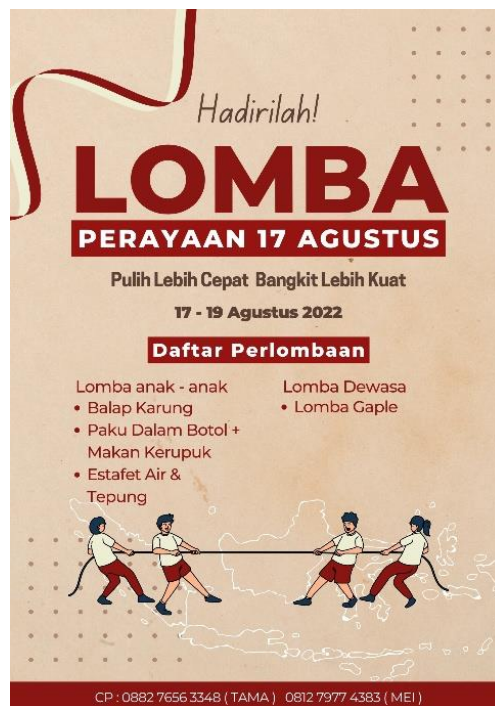
Gambar 2.14 Tampilan Poster Lomba Perayaan HUT RI