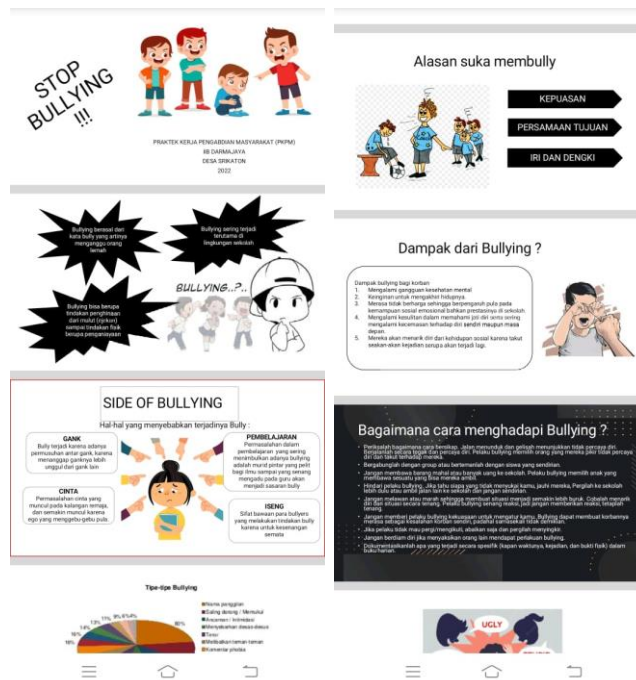
Gambar. 2.9 Tampilan Power Point Stop Bullying