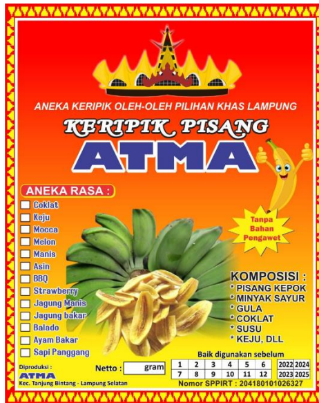
Gambar 2.3 Desain Kemasan Sebelum Dilakukan Rebranding