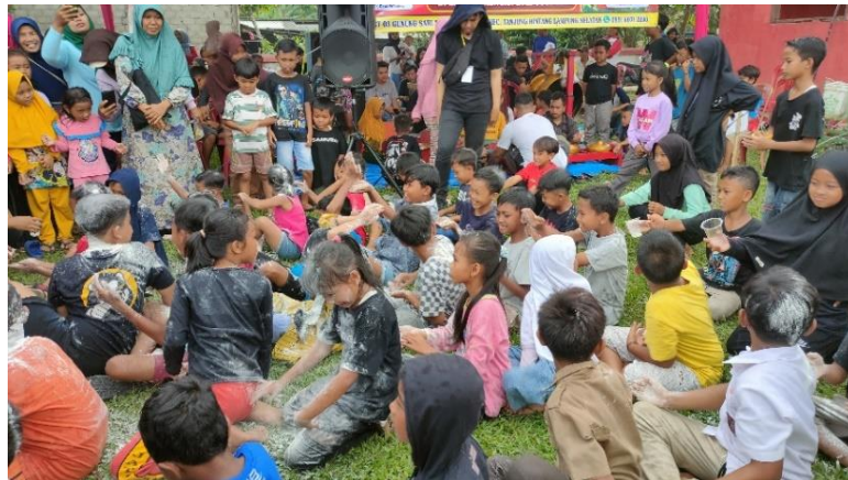
Gambar 2.13 Lomba Dalam Rangka HUT RI Ke 77

dan pamflet acara lalu menyebarkan kesetiap dusun, dengan begitu setiap dusun yang ada di Desa mengirim perwakilannya untuk berpartisipasi di acara yang kami selenggarakan di Lapangan Srikaton.