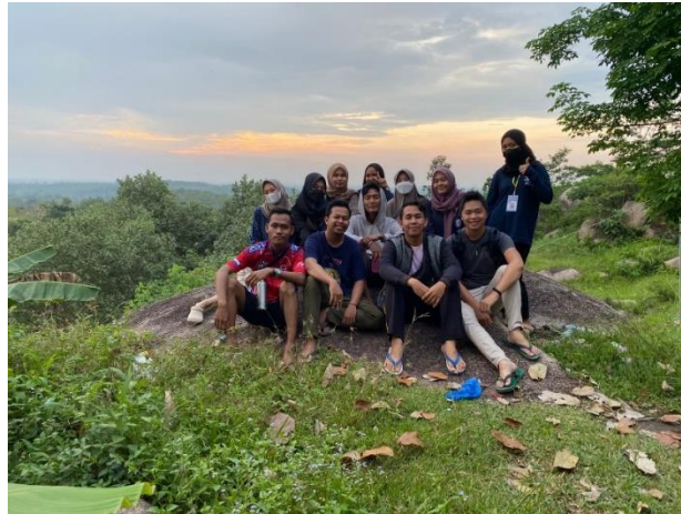
Gambar 2.10 Foto Bersama Saat Pengambilan Video Konten Promosi Wisata