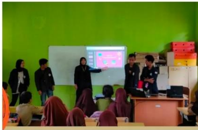
Gambar 2.7 Foto Saat Sosialisasi Di SDN 1 Srikaton

Pemberian Edukasi ini bertujuan untuk memberikan pengetahuan dan pengenalan Komputer dan cara menggunakan Microsoft Word kepada anak-anak yang ada di SDN 1 Srikaton agar bertambahnya wawasan anak-anak sehingga mereka dapat lebih mengetahui tentang teknologi dan hal itu dapat menambah kepercayaan diri dari anak-anak bila mereka nantinya berhasil menguasai Microsoft Word dan juga memberikan edukasi tentang bahayanya Bully di lingkungan sekolah, yang mana tanpa kita sadari tindakan Bully banyak terjadi di lingkungan sekolah.