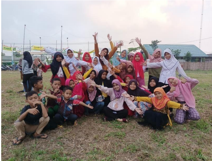
Gambar 8. Pelatihan Upacara HUT RI ke 77