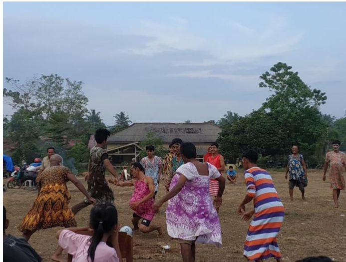
Gambar 10. Kegiatan perlombaan

Kegiatan ini merupakan Perlombaan dalam rangka memperingati Hut RI Ke 77 yang diadakan oleh desa Panca Tunggal. Kami ikut hadir dalam meramaikan perlombaan di desa Panca Tunggal serta kami juga dapat mengikuti perlombaan yang ada.