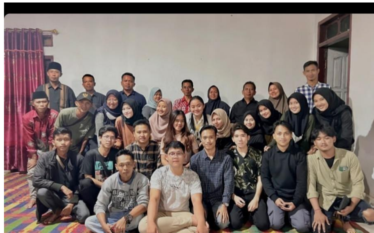
Gambar 11. Silaturahmi ke rumah Perangkat Desa

Kegiatan ini bertujuan untuk mengenal dan mempererat hubungan dengan perangkat desa panca tunggal.