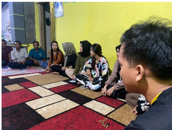
Gambar 9. Rapat Kordinasi Dengan Karang Taruna Dusun Trimulyo III

Kegiatan Diskusi dengan pemuda dan pemudi karang taruna yaitu perkenalan kami mahasiswa/I PKPM yang akan membantu menjadi panitia acara Hut RI Ke 77 di desa Panca Tunggal. Dan Pembagian tugas Masing-masing individu untuk memegang perlombaan sehingga acara dapat berjalan dengan lancar.