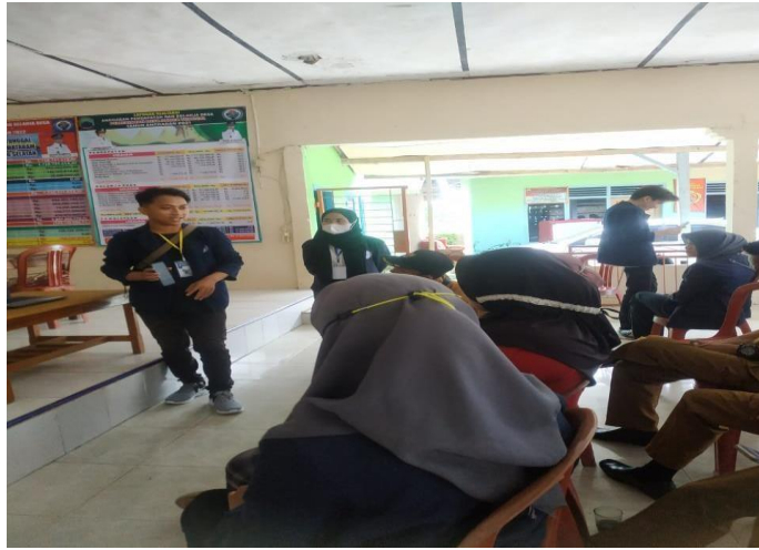
Gambar 1. Pengenalan aplikasi design bagi masyarakat