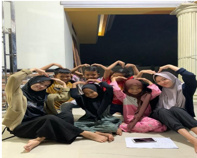
Gambar 12. Belajar Rutin Bersama Anak-Anak Dusun Trimulyo

Kegiatan belajar Bersama anak-anak Dusun Trimulyo ini rutin di adakan guna membantu anak-anak dan memberikan sedikit pengetahuan di luar pembelajaran di sekolah