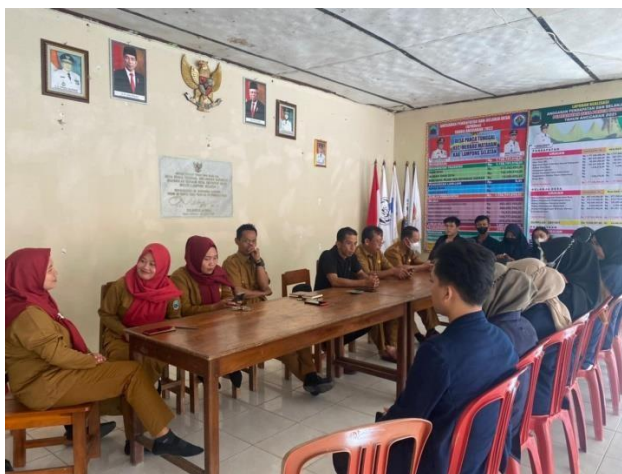
Gambar 4. Penyambutan mahasiswa/i PKPM di Balai Desa

Kegiatan penyambutan mahasiswa/I PKPM kelompok kami di Balai Desa , Desa Panca Tunggal oleh Seluruh Perangkat Desa. Kami juga sekaligus meminta izin untuk dapat mengabdikan kepada Desa Panca Tunggal selama 1 Bulan.