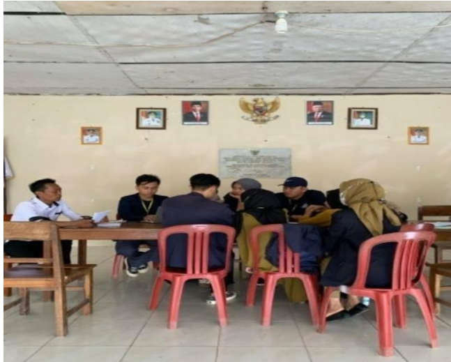
Gambar 5. Rapat Persiapan Perlombaan memperingati HUT RI ke 77

Kegiatan ini kami lakukan bersama perangkat desa Panca Tunggal untuk mempersiapkan perlombaan HUT RI ke 77. Macam macam perlombaan yang diadakan yaitu Panjat pinang, Estafet Sarung, Estafet Tepung, dsb.