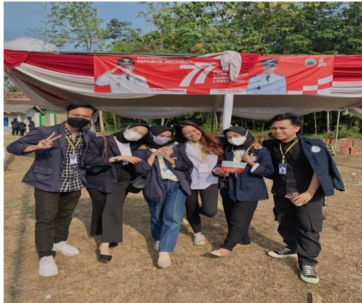
Gambar 16. Upacara peringatan Hut RI Ke 77

Kegiatan Upacara peringatan HUT RI ke 77. Selain itu, kelompok PKPM juga terlibat dalam kepanitiaan perlombaan anak-anak, ibu-ibu, hingga bapak-bapak yang melibatkan semua warga desa sebagai peserta lomba