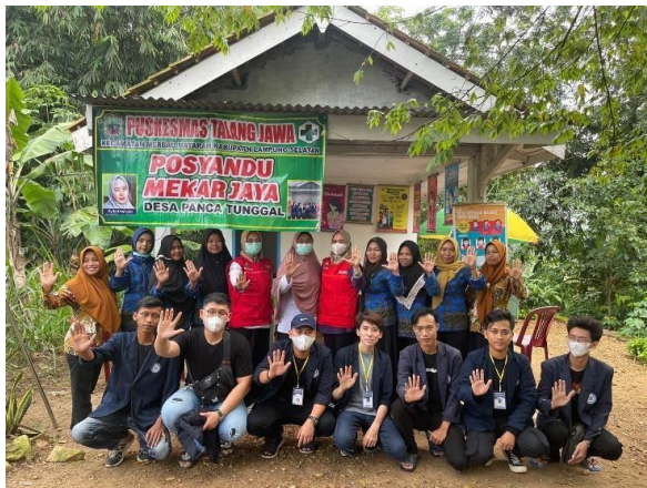
Gambar 13. Membantu Pelayanan Posyandu

Kegiatan ini untuk membantu petugas posyandu melayani warga desa panca tunggal untuk memberikan layanan kesehatan ibu dan anak, KB, imunisasi.