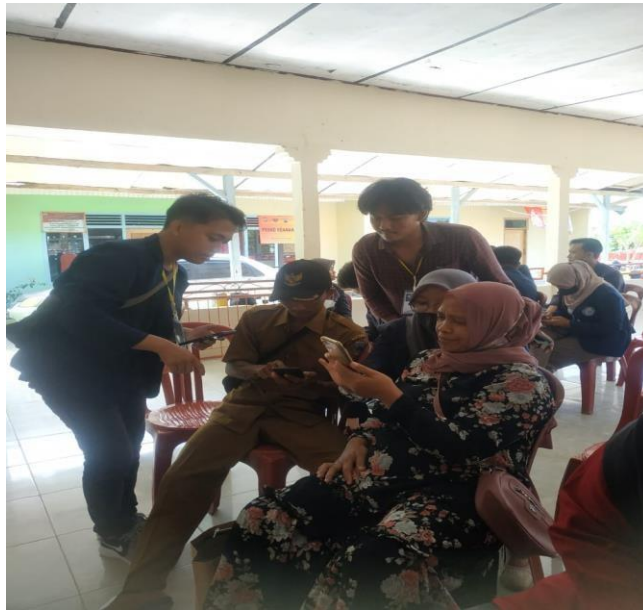
Gambar 2. Pembuatan akun canva

Berikut merupakan kegiatan pembuatan akun, di mulai dari pendaftaran akun baik menggunakan Google ataupun melalui Facebook, serta membuat Username dan Password untuk aplikasi Canva.