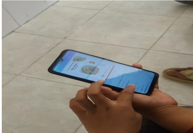
Gambar 3. Pembuatan desain

Pada sesi ini masyarakat diperkenankan untuk membuat desain sendiri dengan menggunakan aplikasi Canva. Masyarakat juga di bebaskan untuk berkreasi dalam pembuatan desain.