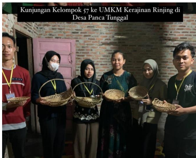
Gambar 7. Kunjungan ke UMKM Rinjing

Kegiatan ini kami melakukan kunjungan ke beberapa UMKM yang ada di Desa Panca Tunggal untuk meminta Perizinan Praktek Kerja Pengabdian Masyarakat (PKPM) kepada pemilik usaha mandiri tersebut. Dan juga kami melakukan wawancara kepada pemilik UMKM untuk mengetahui apa yang menjadi keluhan bagi usaha mandiri seperti kesulitan melakukan pemasaran , peningkatan kualitas pengemasan produk serta kesulitan pencatatan keuangan.