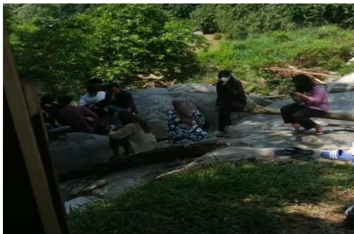
Gambar 15. Kunjungan ke Wisata Batu Kincir

Berkunjung ke salah satu wisata yang ada di desa Panca Tunggal yang bertujuan untuk mengenalkan wisata batu kincir.