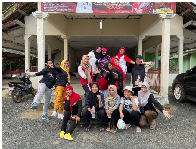
Gambar 6. Kegiatan senam rutin.

Kegiatan senam rutin ini dilaksanakan Setiap Hari Selasa dan Sabtu. Senam yang di isi oleh ibu – ibu di Desa Panca Tunggal baik yang usia muda maupun lansia. Kegiatan ini diadakan untuk menambah semangat berolahraga khususnya lansia agar tetap merasa sehat.