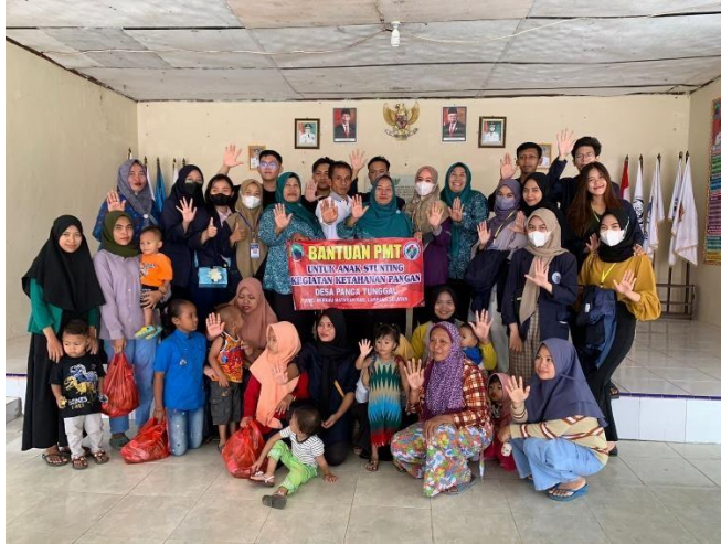
Gambar 14. Membagikan Bantuan BLT Untuk Anak Stunting

Kegiatan ini sebagai bentuk perhatian untuk anak stunting dengan cara pemberian makanan kepada balita dalam bentuk kudapan yang aman dan bermutu.