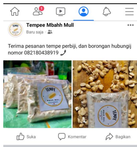
Gambar 2.2.3 Media Sosial

Hasil kegiatan dari pembuatan akun facebook, dapat mempermudah UMKM Tempe dalam mempromosikan produknya. .