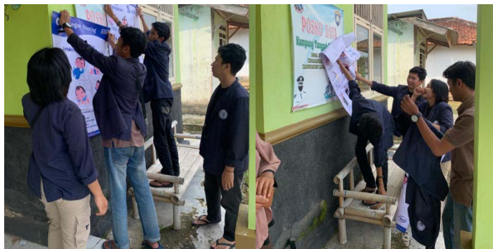
Gambar 2.2.8 Program Pemasangan Banner Stunting Dan PHBS

Hasil kegiatan dari program kerja yang telah saya lakukan ini yaitu saya dapat memberikan pengetahuan tentang stunting dan PHBS secara langsung guna menanggulangi masalah kurangnya gizi dan pentingnya kebersihan bagi kesehatan