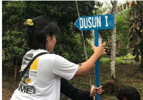
Gambar 2.2.9 Program Pembuatan Dan Pemasangan Papan Jalan

Hasil kegiatan dari program kerja ini yaitu membantu pengguna jalan untuk menentukan arah jalan yang akan di tuju agar tidak tersesat, dan membedakan antara satu dusun dengan dusun yang lain.