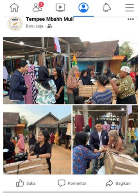
Gambar 2.2.4 Mempromosikan Produk Tempe Melalui Media Sosial