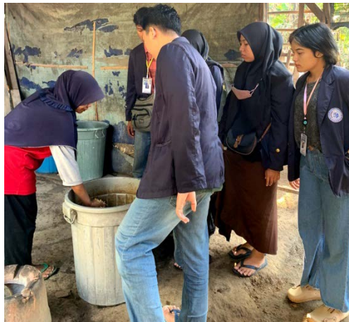
Gambar 2.2.1 Proses Pembuatan Tempe

Hasil kegiatan program kerja yang telah saya lakukan yaitu membantu proses pembuatan tempe mulai dari yang awalnya masih berbentuk kacang kedelai sampai menjadi sebuah tempe. Proses pembuatan tempe sendiri dilakukan oleh adik dari bapak Ruswanto dan bapak Ruswanto sendiri yang bertugas untuk memasarkan dan mengantarkan tempe kepada konsumen.