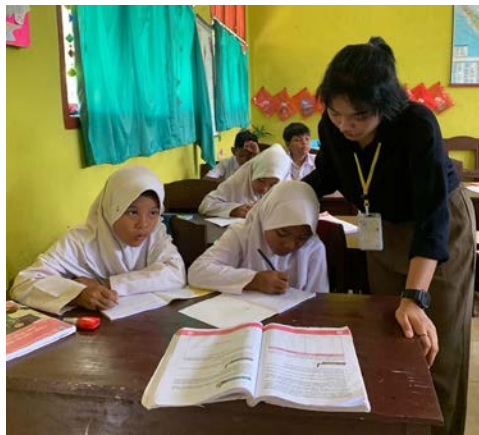
Gambar 2.2.7 Program Belajar Mengajar

Hasil kegiatan dari program kerja yang telah saya lakukan ini yaitu saya dapat mendampingi dan membantu adik-adik dalam belajar. setelah saya melakukan kegiatan ini mereka senang mendapatkan ilmu tentang pelajaran Bahasa Inggris dan teknologi informasi dan komputer.