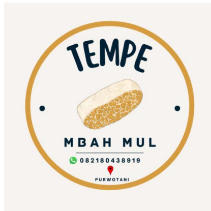
Gambar 2.2.2 Desain logo produk