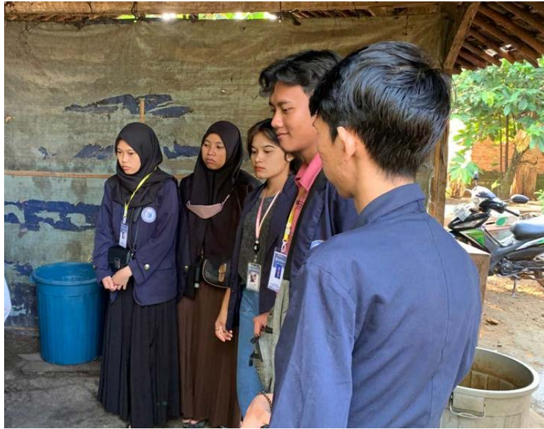
kunjungan UMKM Tempe