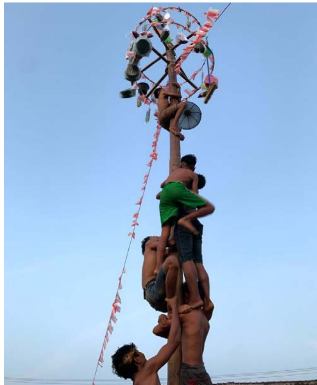
Kegiatan 17 Agustus