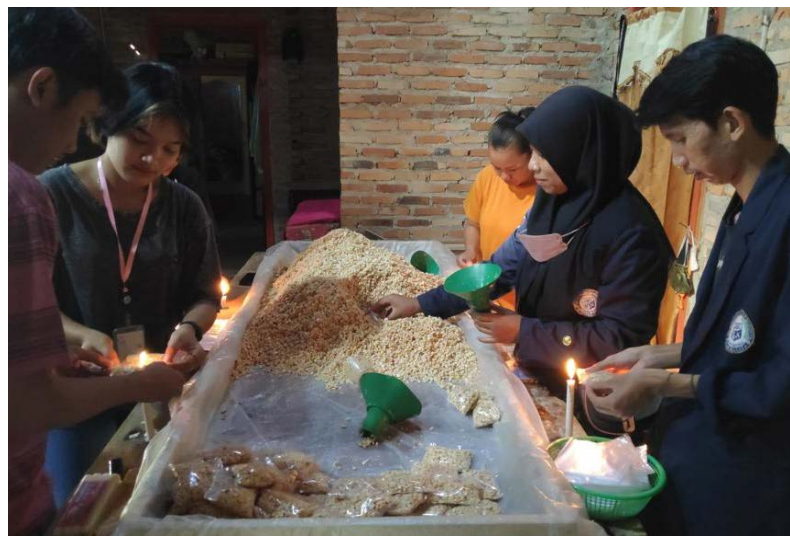
Membantu pengolahan Tempe