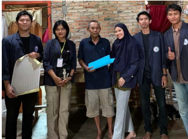
Penyerahan Surat Izin NIB Dan Logo