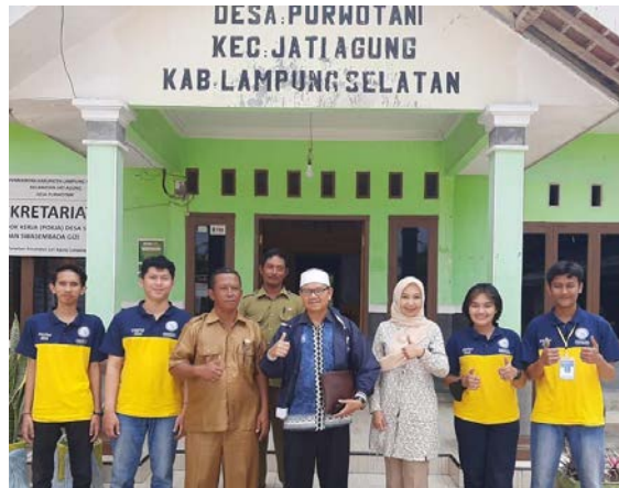
Penyerahan surat izin kepada Kepala Desa