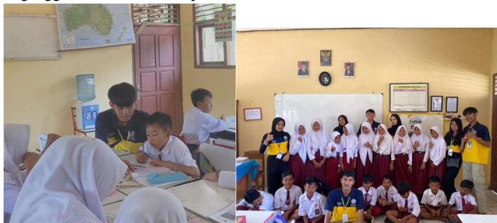
Gambar 1.3 Sosialisasi Dan Pendampingan Belajar Di SD 1 Trimulyo

Melakukan sosialisasi dan pendampingan belajar kepada siswa/siswi SD 1 Trimulyo. Dengan tema “Bahaya Gadget Bagi Kesehatan”, dengan dimaksudkan bahwa seberapa bahaya kecanduan gedit. Tema tersebut diharapkan anak-anak untuk tidak menggunakan gadget dengan sembarangan karena selain berdampak bagi kesehatan fisik, kecanduan gadget juga bisa mengganggu kesehatan mental pada anak dan membuat anak sulit untuk fokus.