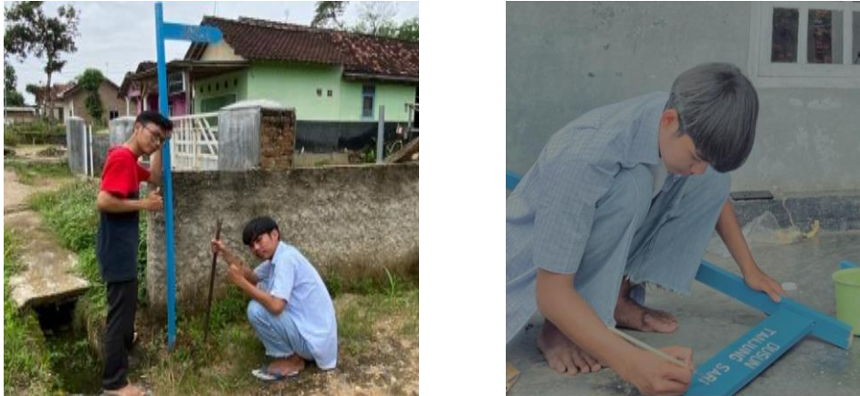
Gambar 1.6 Pembuatan Plang Jalan

Tujuan dari adanya pembuatan papan nama atau plang jalan adalah untuk memberikan informasi kepada masyarakat dan pengguna jalan lainnya yang ingin mencari lokasi atau jalan tertentu di Desa Trimulyo.