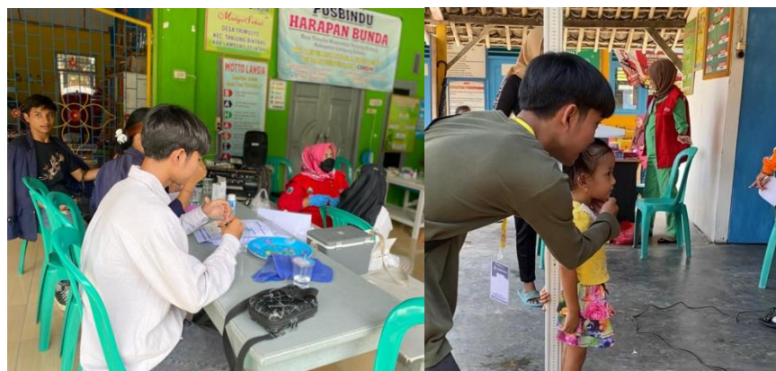
Gambar 1.5 Kegiatan Pencegahan Stunting dan Posyandu Rutin

Kegiatan Posyandu merupakan kegiatan rutin bulanan yang dilakukan secara rutin di Desa Trimulyo untuk meningkatkan peran, serta masyarakat untuk mengembangkan kegiatan kesehatan dan Keluarga Berencana. Sosialisasi ini merupakan langkah serius dalam mengedepankan kesejahteraan masyarakat Desa Trimulyo dengan meningkatkan informasi dan edukasi kepada masyarakat mengenai stunting dan gizi anak.