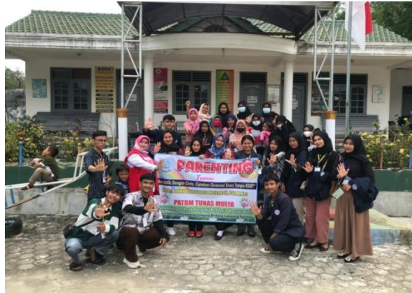
Gambar 1.4 Kegiatan Parenting di Desa Trimulyo

Parenting adalah pola asuh orang tua terhadap anak. Tujuan diselenggarakannya sosialisasi Parenting ini yaitu, untuk meningkatkan pengetahuan dan keterampilan orang tua dalam melaksanakan pengasuhan dan pendidikan anak di dalam lingkungan keluarga dengan dasar-dasar karakter yang baik. Parenting dilakukan di TK Permata Bunda dengan dihadiri oleh warga desa trimulyo