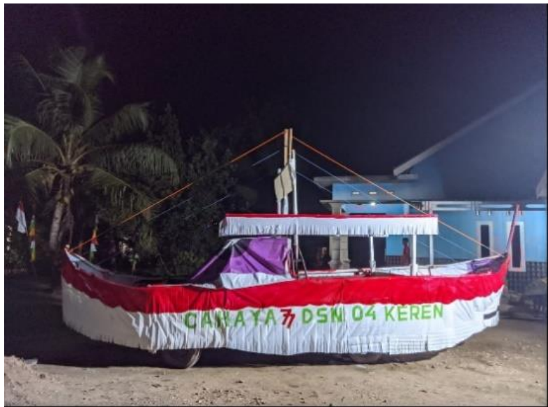
Gambar 2.13 Kendaran Karnaval