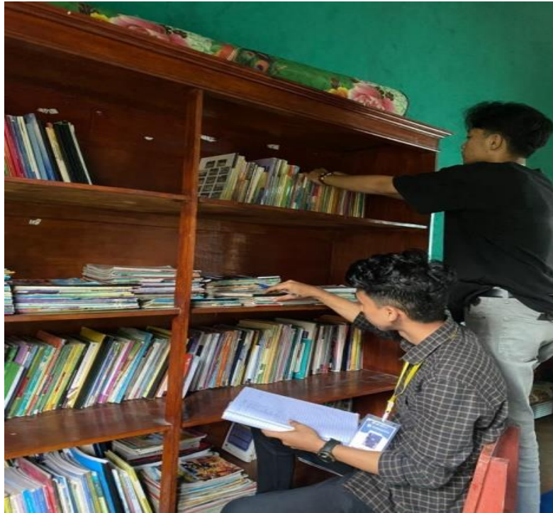
Gambar 2.1 Memeriksa buku perpustakaan