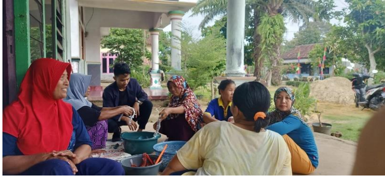
Gambar 2.14 Membuat Hiasan Dari Plastik & Air