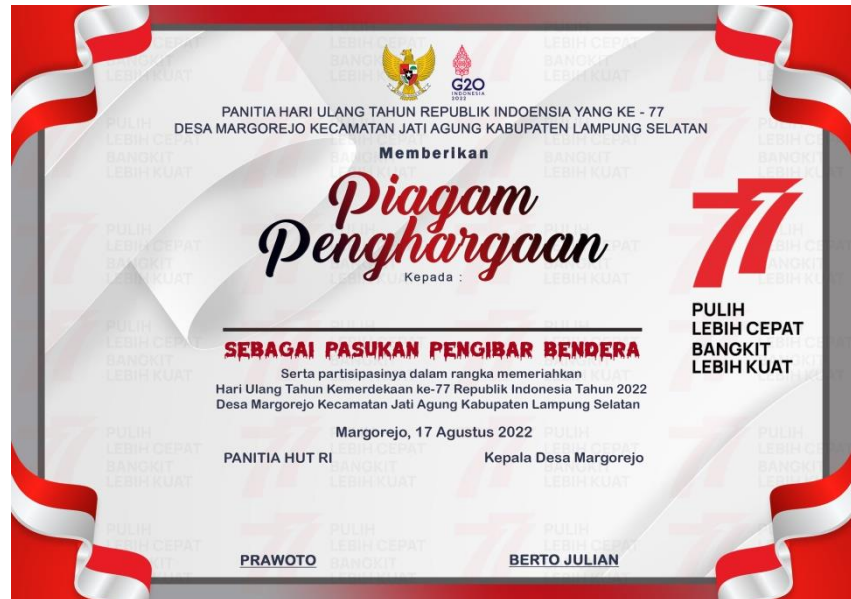
Gambar 2.11 Hasil Desain Sertifikat