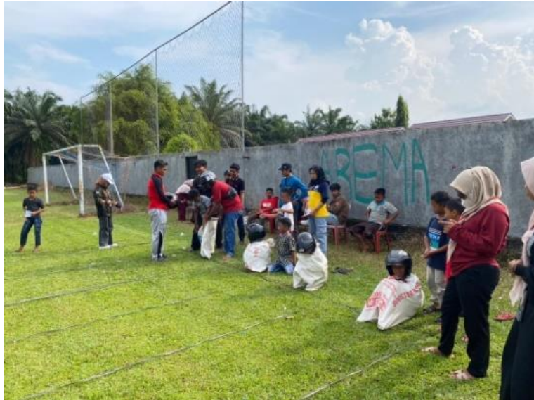
Gambar 2.20 Menjadi Panitia Lomba Balap Karung

kekompakkan dan semangat kerjasama untuk menyukseskan kegiatan.