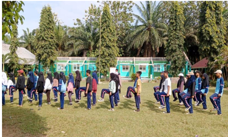
Gambar 2.17 Mengawasi Sesi Latihan Paskibra