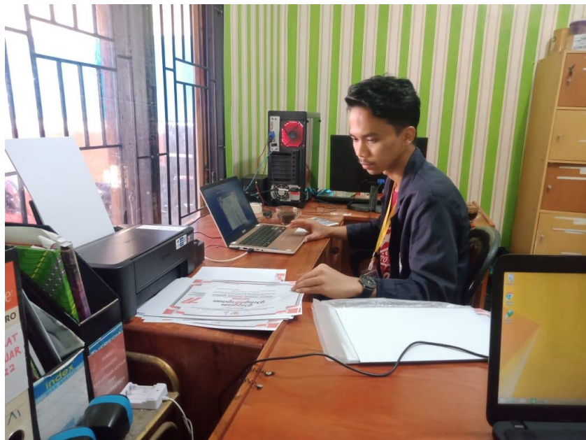
Gambar 2.10 Mencetak sertifikat