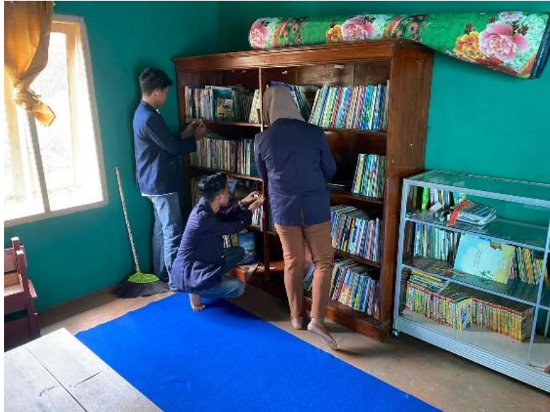
Gambar 2.26 Mengecek Buku Di Perpus

Kegiatan ini berupa penataan perpustakaan, seperti membersihkan ruangan, menempatkan buku dengan posisi yang teratur dalam rak.