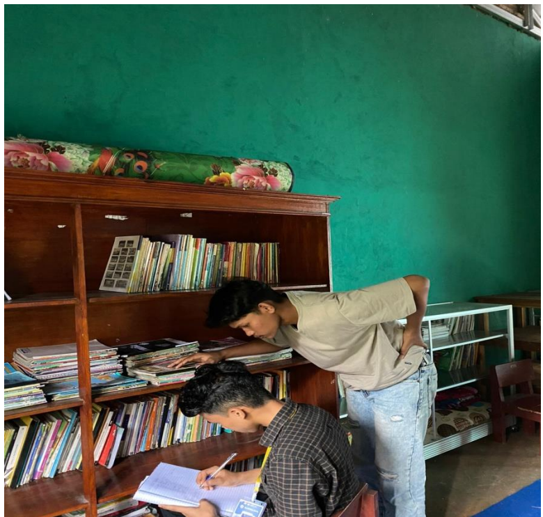
Gambar 2.2 Mendata buku perpustakaan