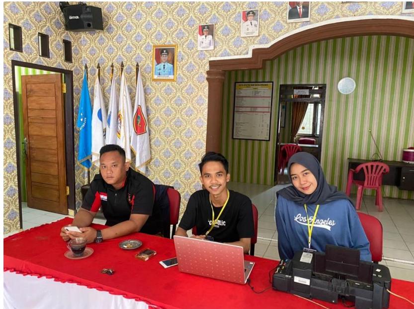
Gambar 2.9 Mendesain Sertifikat

efektif, yang dapat di manfaatkan di berbagai kegiatan desa. Kegiatan ini dilaksanakan pada Selasa, 30 Agustus 2022, dengan mendesain sertifikat menggunakan aplikasi Canva. Kemudian berlanjut di hari Rabu, 31 Agustus 2022 dengan mencetak sertifikat yang sudah didesain sebelumnya.