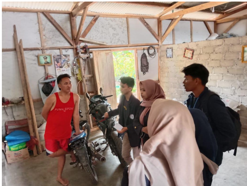
Gambar 2.25 Sosialisasi Ke Pemilik UMKM Kecambah