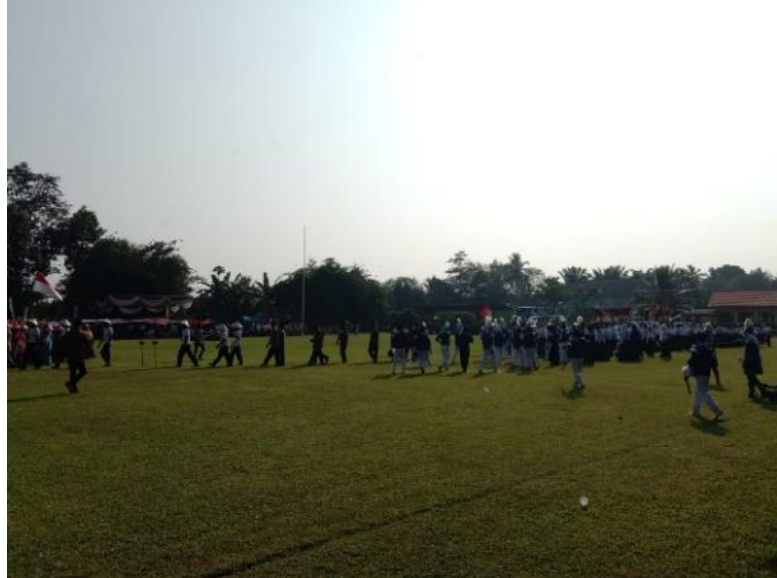
Gambar 2.18 Persiapan Upacara Bendera