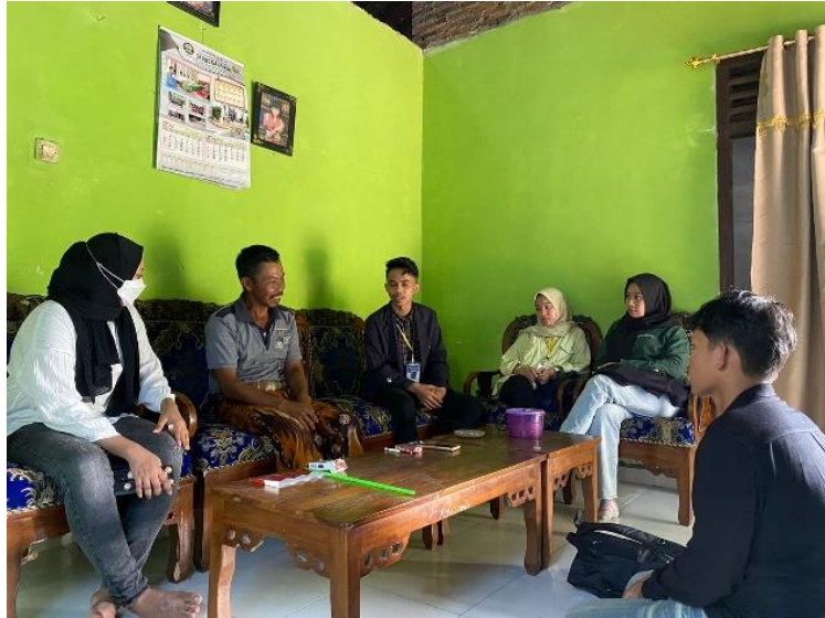
Gambar 2.21 Sosialisasi Ke Dusun 1

Untuk kebersihan dan ketertiban, masyarakat di setiap dusun telah menerapkannya dengan baik. Hal ini dibuktikan dengan adanya beberapa kontak sampah yang telah dibangun disetiap rumah guna mempermudah masyarakat tiap rumah mengelola sampahnya masing-masing.