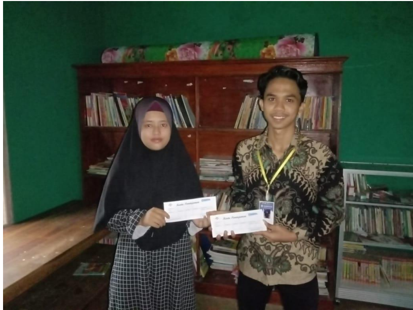
Gambar 2.6 Penyerahan kartu peminjaman buku perpustakaan