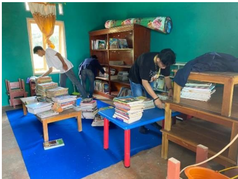
Gambar 2.27 Membersihkan dan Menata Buku Di Perpus