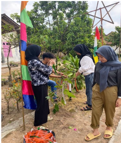
Gambar 2.15 Menggantungkan Balon Air ke Pohon