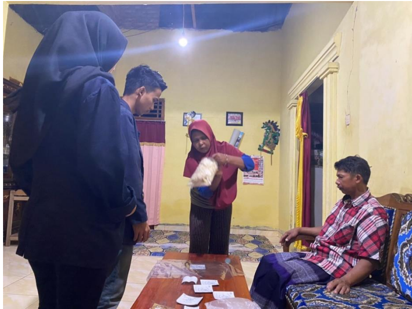
Gambar 2.7 Pengemasan produk UMKM Jamur