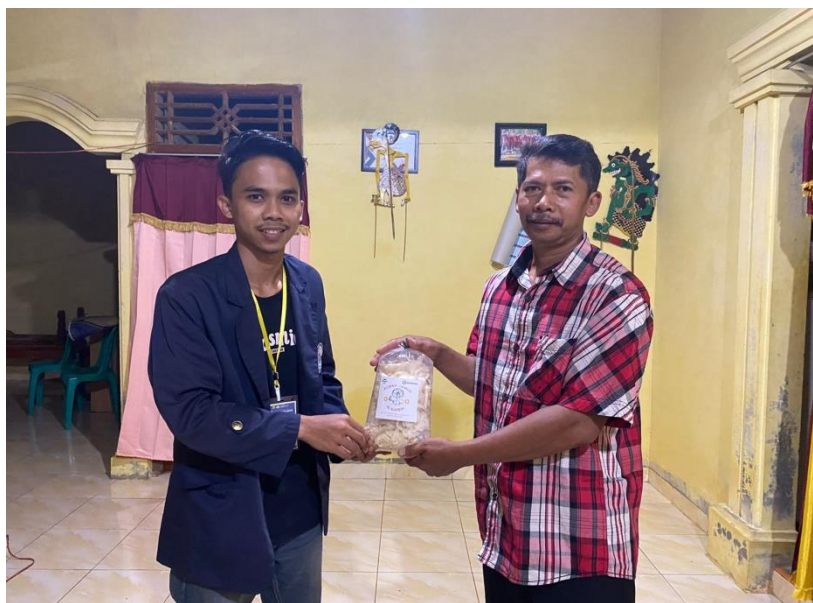
Gambar 2.8 Penyerahan desain logo UMKM Jamur