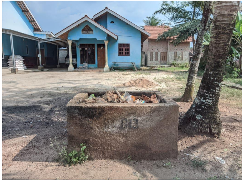
Gambar 2.23 Keberadaan Kotak Sampah Tiap Rumah