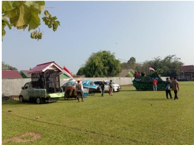
Gambar 2.19 Penampilan Karnaval