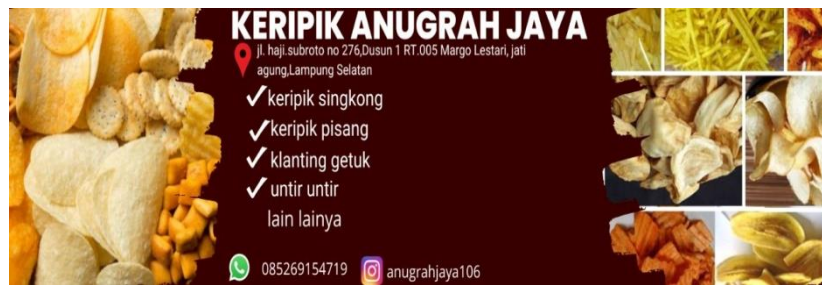
gambar 2 hasil desain banner

Banner memiliki banyak manfaat untuk promosi produk atau brand perusahaan. Dari segi penghematan biaya produksi dan media promosi dengan jangka waktu yang lama.