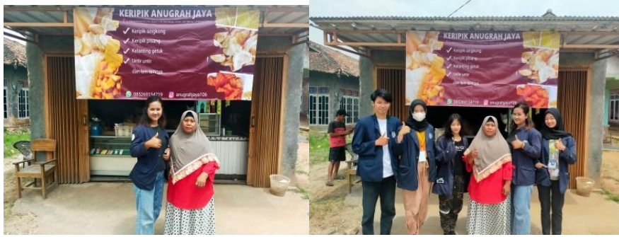
gambar 3 pemasangan banner di toko