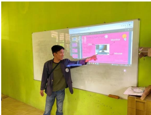
Gambar 2.5 penjelasan tentang dasar dasar komputer