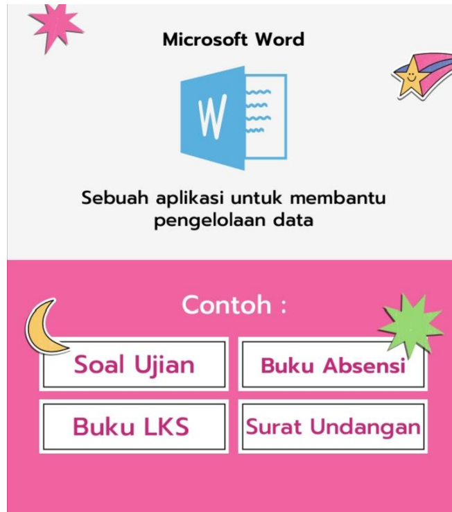
Gambar 2.3 Menggambarkan Sebuah Aplikasi Microsoft Word Dan contoh Hasil Pembuatannya

Mouse adalah salah satu perangkat keras masukan (input) penting yang harus ada ketika kita ingin mengoperasikan sebuah komputer. Fungsi utama mouse sebagai alat penunjuk atau pointing device, menjadi sangat penting dan berguna ketika pertama kali ditemukan.