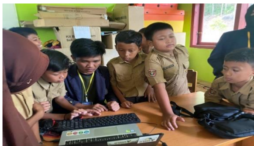
Gambar 2.6 mengajarkan penggunaan mouse dan keyboard