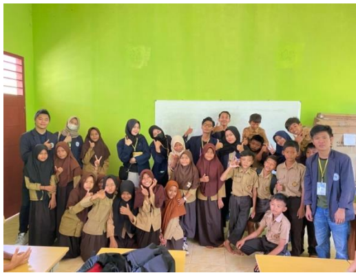
Gambar 2.8 Sesi Poto Bersama Siswa Siswi SDN 1 Sri Katon