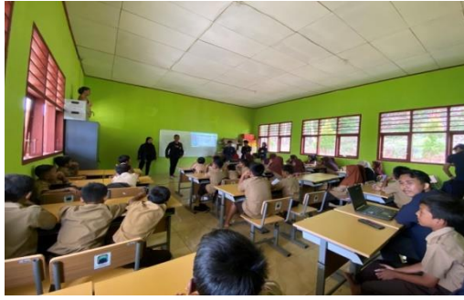
Gambar 2.7 Suasana Mengajar Dengan Siswa Siswi SDN 1 Sri Katon