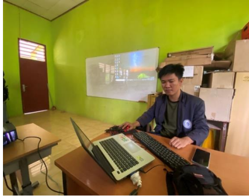
Gambar 2.4 Persiapan Materi yang akan di ajarkan

Berikut beberapa dokumentasi kegiatan yang dilakukan selama mengajar di kelas SDN 1 Sri Katon.