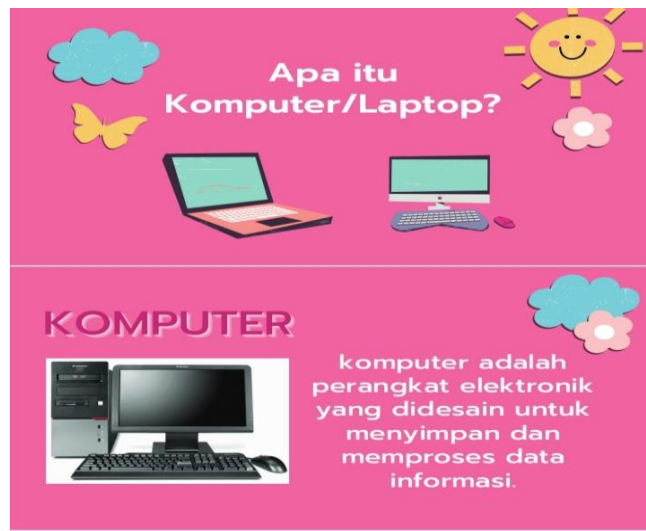
Gambar 2.1 Menggambarkan Pengertian Komputer

komputer komputer adalah perangkat elektronik yang didesain untuk menyimpan dan memproses data informasi