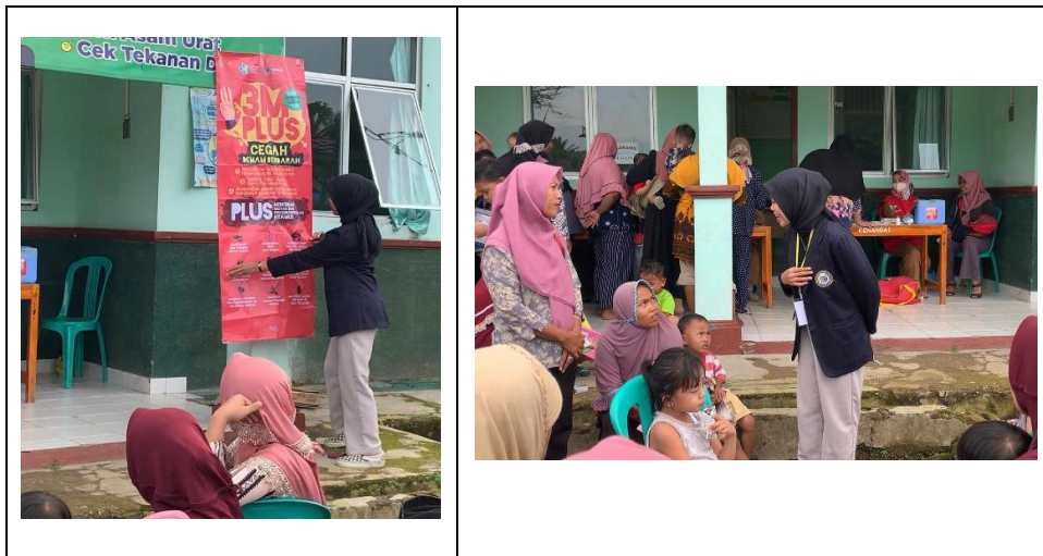
Tabel Gambar 2.6 Proses Penyuluhan dan Edukasi Demam Berdarah