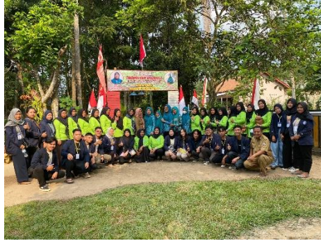
Gambar 2.9 Foto kegiatan penilaian acara TOGA