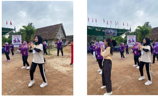
Gambar 2.7 Foto Senam Bersama masyarakat desa jati indah

Senam sangat bermanfaat dalam mengembangkan komponen fisik dan kemampuan gerak (motor ability). Orang-orang yang terlibat senam akan berkembang daya tahan ototnya, kekuatannya, power, kelenturan, koordinasi, kelincahan serta keseimbangan.