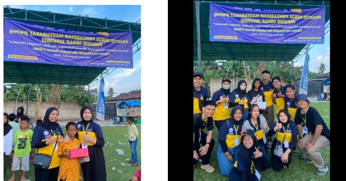
Gambar 2.6 Foto bersama pemenang lomba 17-an