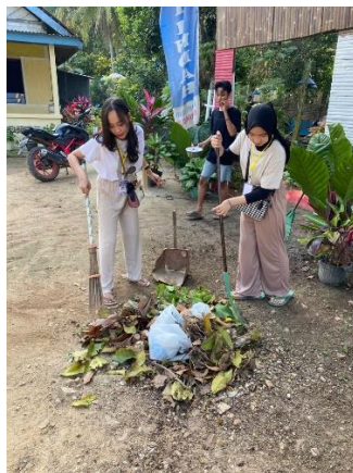
Gambar 2.8 Foto kerja bakti persiapan acara TOGA

Salah satu tujuan dari gotong royong adalah menumbuhkan sikap saling membantu antar masyarakat . Dimana orang-orang membantu dan menolong orang lain yang membutuhkan, menyelesaikan suatu tantangan secara bersama, dapat mempererat tali persaudaraan meningkatkan rasa solidaritas.