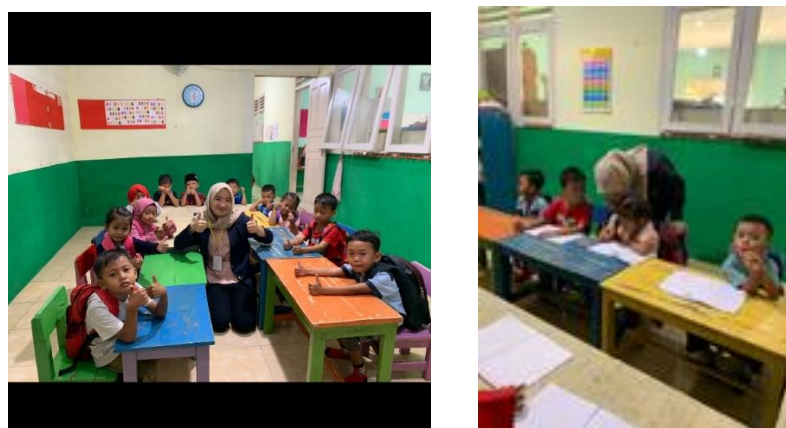
Gambar 2.4 kegiatan mengajar di TK Assyafiyah

Program kerja ini bertujuan untuk membantu agar anak-anak belajar memahami dan bisa menulis angka, huruf dan meningkatkan kreatifitas anak-anak Tk ketika menggambar dan mewarnai.