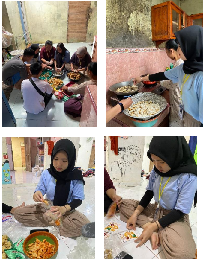
Gambar 2.11 Proses produksi keripik tahu e3

memulai usahanya sejak tahun 2015. Berikut merupakan pembuatan keripik tahu.