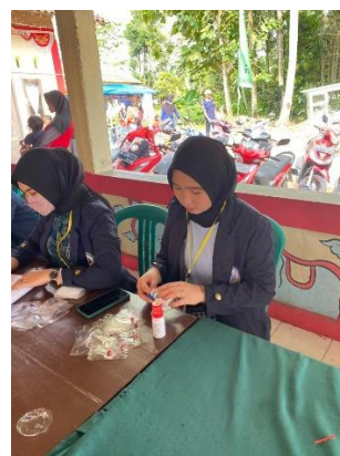
Gambar 2.10 Foto kegiatan posyandu di desa jati indah