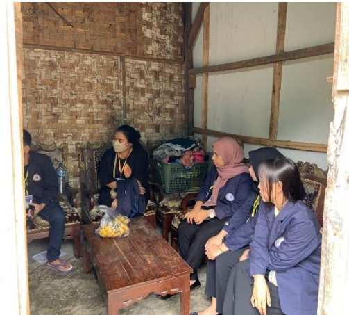
Gambar 2.1 Survei lokasi UMKM

oleh pemilik UMKM Keripik tahu selain itu survei juga merupakan tahapan awal sebelum merancang dan melaksanakan sebuah strategi dalam pemasaran dan pengembangan inovasi pada produk UMKM yang berkaitan. Dengan dilakukannya sebuah survei kita dapat mengetahui kebutuhan apa saja yang dibutuhkan oleh suatu UMKM, sehingga program atau rencana pengembangan inovasi dapat terlaksana sesuai kebutuhan yang diperlukan oleh pihak terkait.