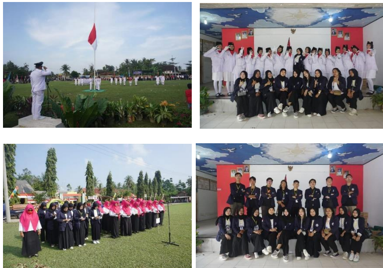
Gambar 2.5 Foto Kegiatan Upacara HUT-RI Desa jati indah

Upacara HUT-RI untuk memperingati hari sakral kemerdekaan Bangsa Indonesia . Upacara Peringatan detik- detik Proklamasi Kemerdekaan Bangsa Indonesia dan Pengibarang Sang Merah Putih serta lomba- lomba di tingkat desa. Upacara bendera dapat meningkatkan sikap kebersamaan dan persatuan di sekolah maupun di desa karena : pertama upacara membuat semua peserta upacara yang akan senantiasa bersama – sama mengikuti aba-aba dari pemimpin upacara dan berpakaian seragam , sehingga menunjukkan sikap kebersamaan. Kedua upacara membuat semua peserta upacara mengingat perjuangan para pahlawan yang telah gugur.