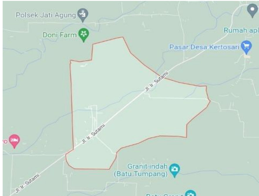
Gambar 1.1 Lokasi Purwodadi Simpang