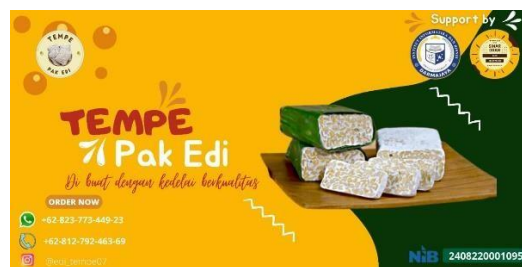
Gambar 2.5 Pembuatan Banner untuk UMKM Tempe Pak Edi

Pembuatan banner untuk UMKM Tempe Pak Edi dilakukan karena menurut pendapat saya Banner untuk UMKM itu penting, dimana banner bisa menjadi tempat informasi tentang UMKM dan juga bisa jadi sarana promosi untuk UMKM itu sendiri.