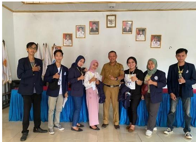
Gambar 2.3 Izin kunjungan ke kepala desa dan SDN 1 Sinar Ogan

Koordinasi izin kunjungan dilakukan agar nanti saat menyampaikan materi maupun saat membantu mengajar di SDN 1 Sinar Ogan bisa berjalan dengan baik.