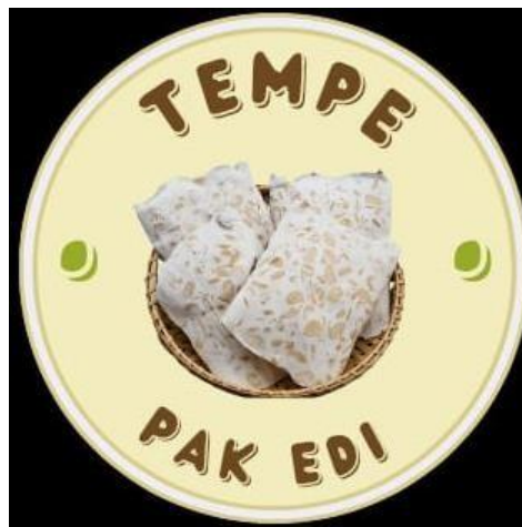
Gambar 2.6 Pembuatan Logo Produk Untuk UMKM Tempe Pak Edi

Berikut adalah hasil dari pembuatan logo untuk UMKM Tempe Pak Edi.