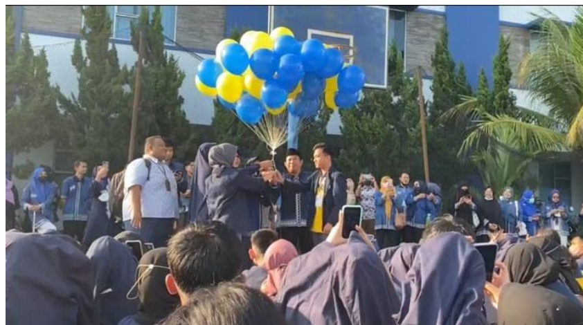
Gambar 2.2 Pelepasan dan Penyerahan Mahasiswa/I PKPM 2022

Dan sekaligus Penyambutan oleh pak Kepala Desa kedatangan yang di sambut hangat oleh masyarakat bahwa kami akan mengabdikan pada Desa Sinar Karya selama 30 (Tiga Puluh ) hari serta di dampingi oleh Ibu pembimbing lapangan.