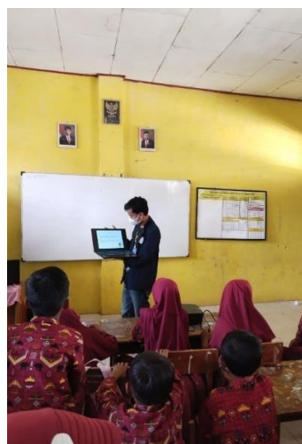
Gambar 2.8 Sosialisai penerimaan informasi yg baik bagi pelajar SDN 1 Sinar Ogan

Sosialisasi ini dilakukan agar pelajar bisa tahu mana informasi yg yang dapat dikonsumsi mana informasi yg hoax/palsu