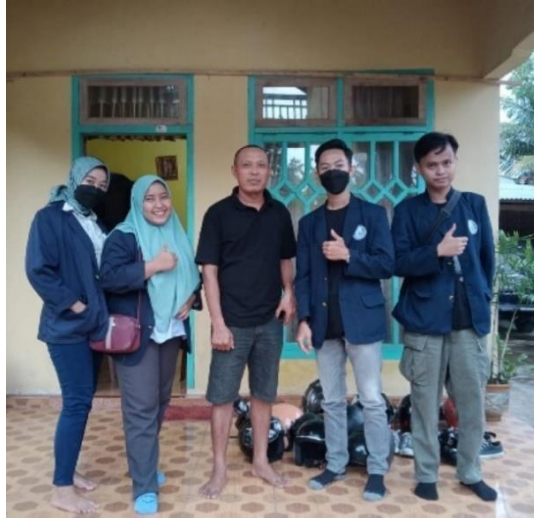
Gambar 2.1 Kunjungan pertama kali sebelum dimulainya PKPM