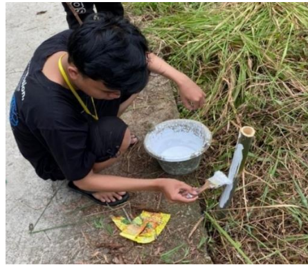
Gambar 2.9 Ikut serta membantu dalam kegiatan HUT RI yg ke 77

Dalam perayaan HUT-RI-77 kami segenap mahasiswa/i ikut serta membantu dalam kegiatan persiapan HUT RI-77 untuk memeriahkan perayaan Kemerdekaan Republik Indonesia ke -77 di Desa Sinar Ogan, Kecamatan Tanjung Bintang, Kabupaten Lampung Selatan.