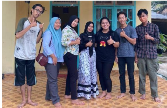
Gambar 2.10 Pertemuan dengan ibu pkk

Pertemuan dengan ibu Pkk dilakukan guna membahas tentang olahan tempe serta belajar bagaimana cara-cara dalam melakukan pembuatan olahan Tempe.