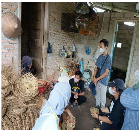
Gambar 2.11 Silaturahmi dengan UMKM

Kegiatan kunjungan yang dilakukan pada UMKM memiliki dampak positif bagi peningkatan pengetahuan kami sebagai mahasiswa dimana dengan adanya kegiatan ini dapat mengubah pandangan kami bawasannya dengan kreatifitas yang kita miliki dapat menghasilkan sebuah nilai komersil jika ditunjang dengan niat dan kemauan.