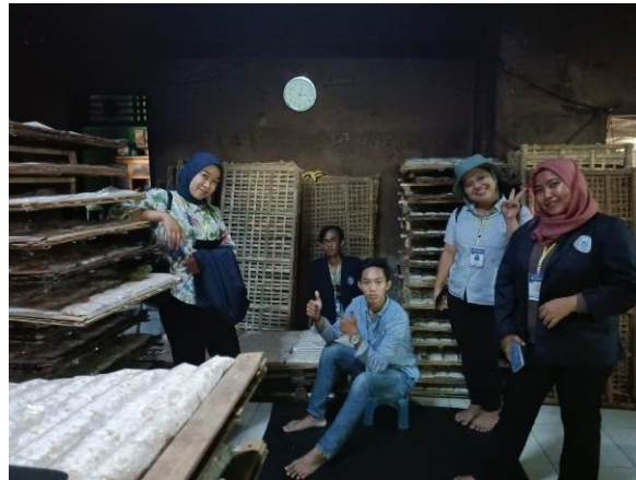
Gambar 2.4 Kunjungan UMKM Tempe