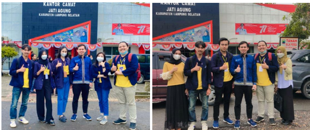
Gambar 15. Perpisahan Di Kecamatan Jati Agung