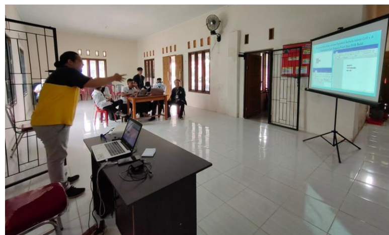
Gambar 2. Pelatihan Pengetikan aparatur desa