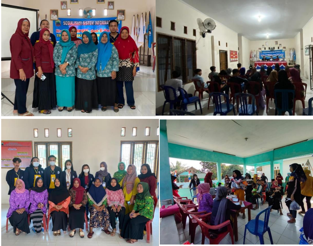
Gambar 8. Membantu Ibu-ibu pkk dalam pelatihan marketplace , pertemuan bersama ibu-ibu pkk ,karang taruna dan ikut serta membantu posyandu