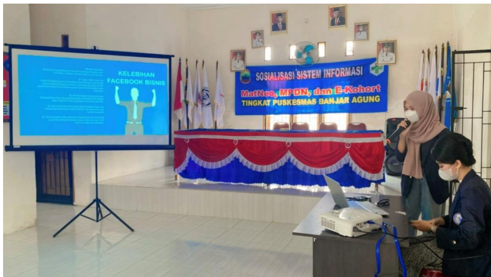
Gambar 4. Sosialisasi dan Cara Pembuatan Facebook Business