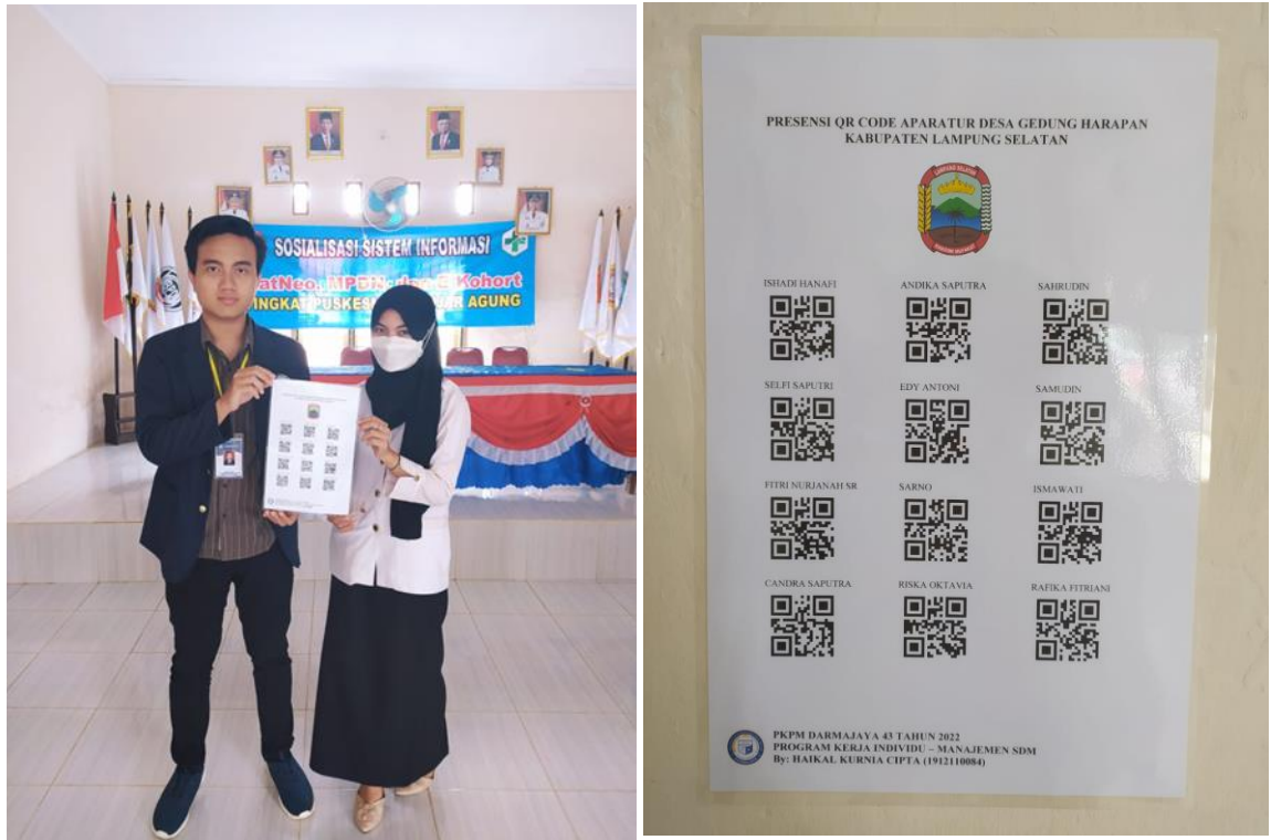
Gambar 1. Penyerahan hasil pembuatan presensi qr code