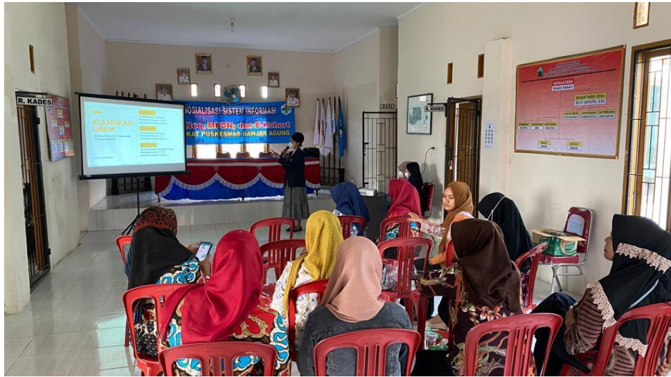
Gambar 5. Penyuluhan Program Kerja Per individu