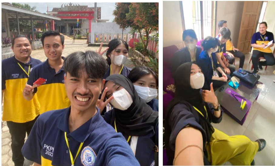
Gambar 7. Gotong Royong Mengecat balai Desa Gedung hrapan dan diskusi lomba hut ri ke 77