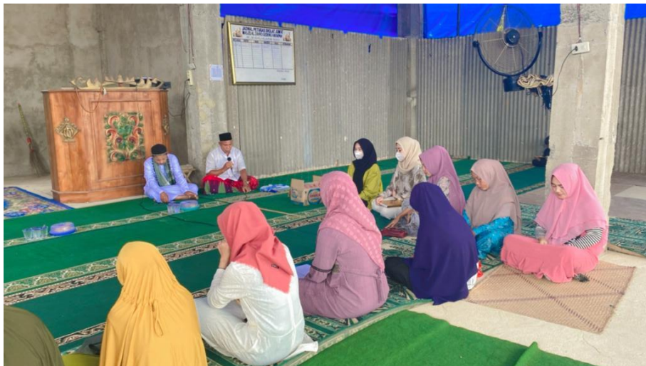
Gambar 12. Kunjungan Ke rumah Kepala dusun 1 dan 2 serta rt 01-04 serta ikut pengejian rutin ibu-ibu desa