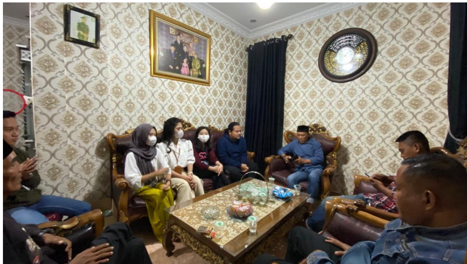
Gambar 9. pertemuan bersama aparaturnya desa , kades , kadus dan RT