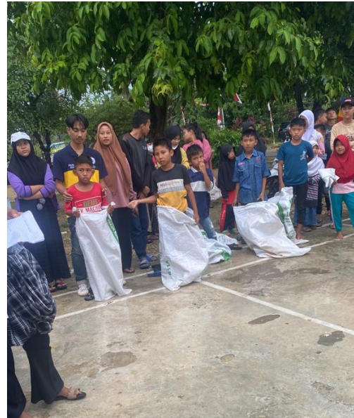
Gambar 11. Kegiatan Memperingati 17 Agustus 2022