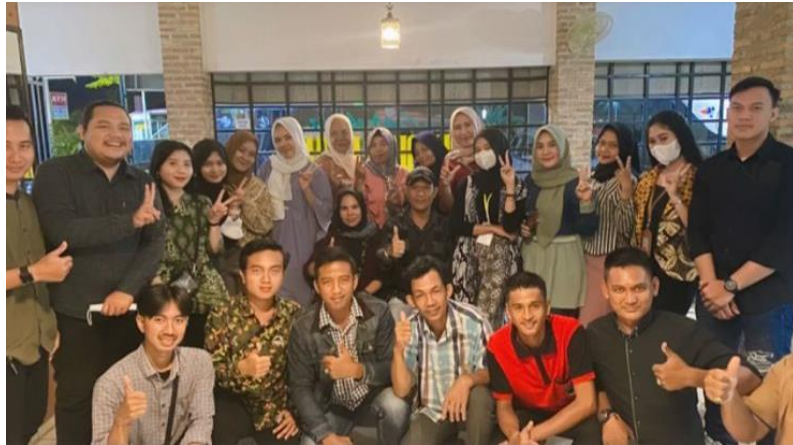
Gambar 14. Perpisahan Bersama Aparatur desa , Karang taruna , kepala desa dan ibu-ibu pkk