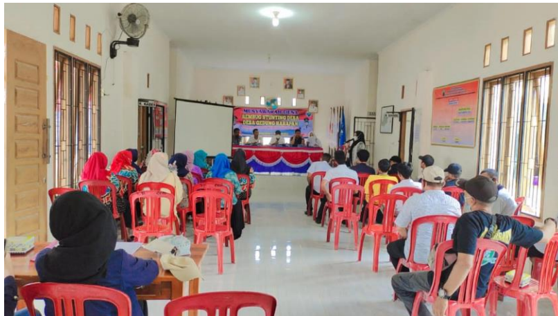
Gambar 13. Memasang Plang batas dusun dan rt serta ikut kegiatan Rembung Stunting dan RKPDEs Tahun 2023 Gedung Harapan