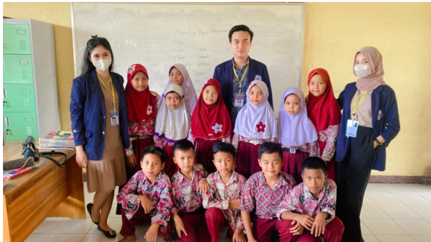
Gambar 10. Belajar Mengajar di SD Negeri Gedung Harapan