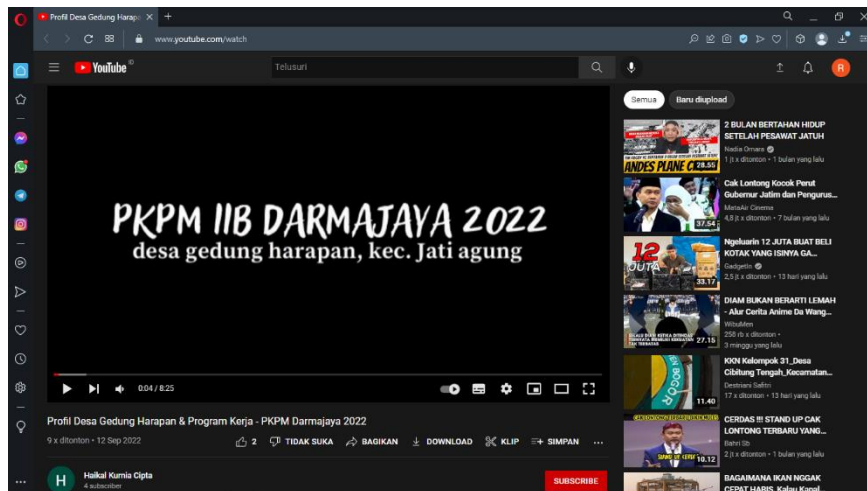
Gambar 16. Link youtube : https://www.youtube.com/watch?v=vsl474SGfsk