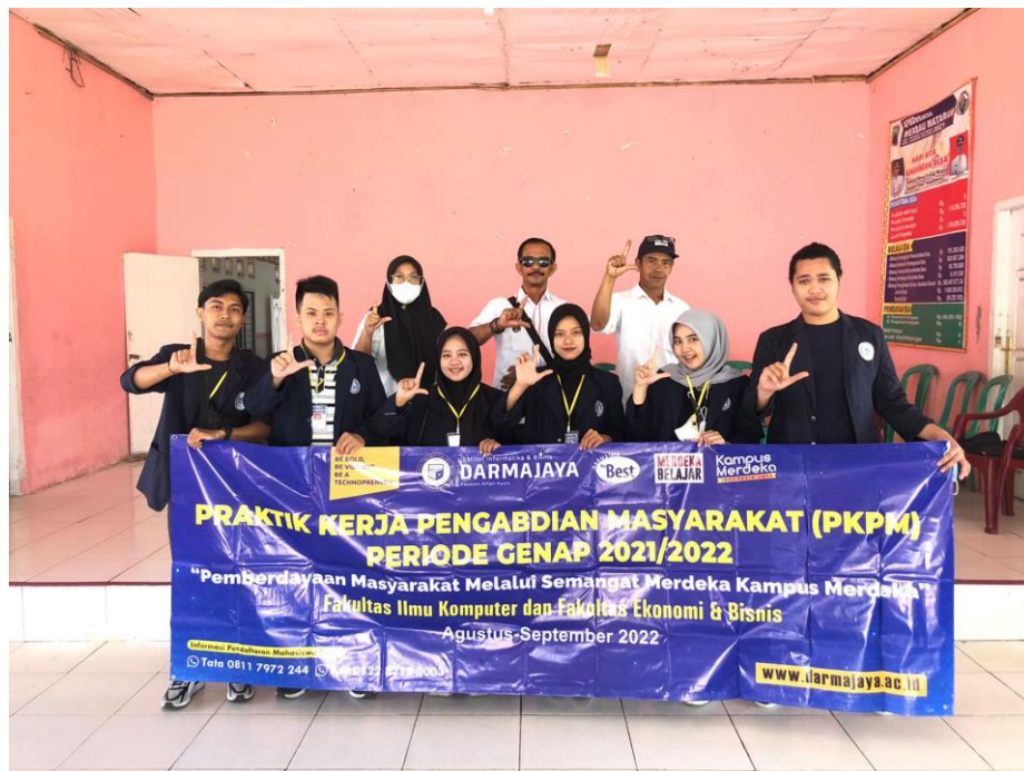
Gambar 1. Profil Desa

Desa Merbau Mataram awalnya merupakan hutan belantara yang dibuka oleh para Pejuang Kemerdekaan RI sekitar tahun 1952 yang ditransmigrasikan oleh BRN (Biro Rekonstruksi Nasional) Yogyakarta pengiriman transmigrasi BRN (Biro Rekonstruksi Nasional). Mantan Pejuang Kemerdekaan ke daerah Lampung tidak sekaligus, melainkan