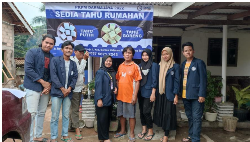
Gambar 2. Profil UMKM

UMKM Tahu menjadi umkm tujuan dilaksanakannya program kerja PKPM kali ini. Pemilik UMKM Tahu yakni :