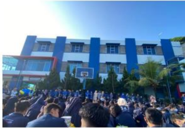
Pemberangkatan Para Peserta PKPM Di Kampus IIB Darmajaya