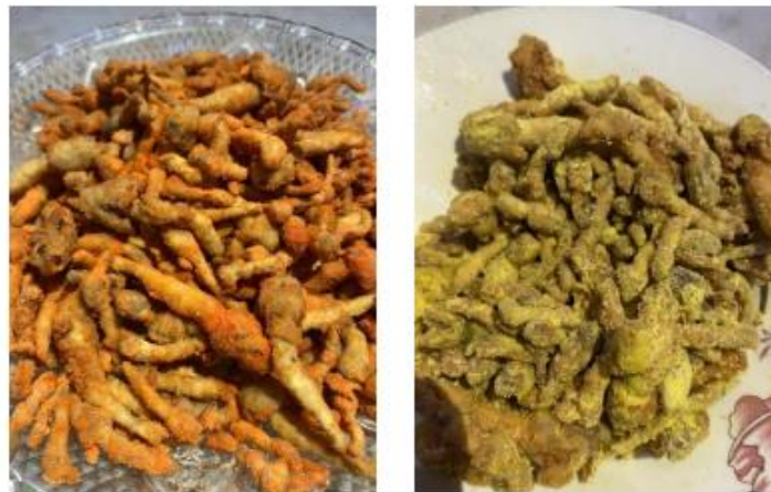
Kegiatan Membuat Jamur Janggel Krispi rasa Balado dan Jagung Bakar