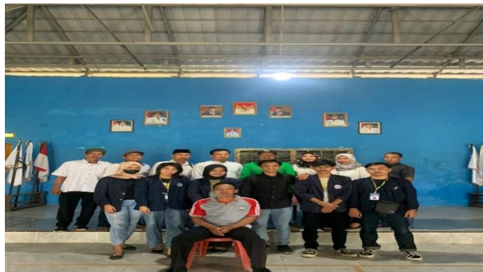
Rapat Pembentukan Panitia HUTRI di Balai Desa Margodadi