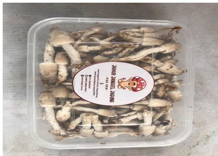
Hasil Panen Jamur Janggel yang siap dipasarkan