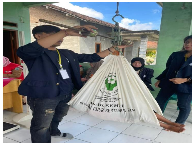
Kegiatan Stunting di Balai Desa