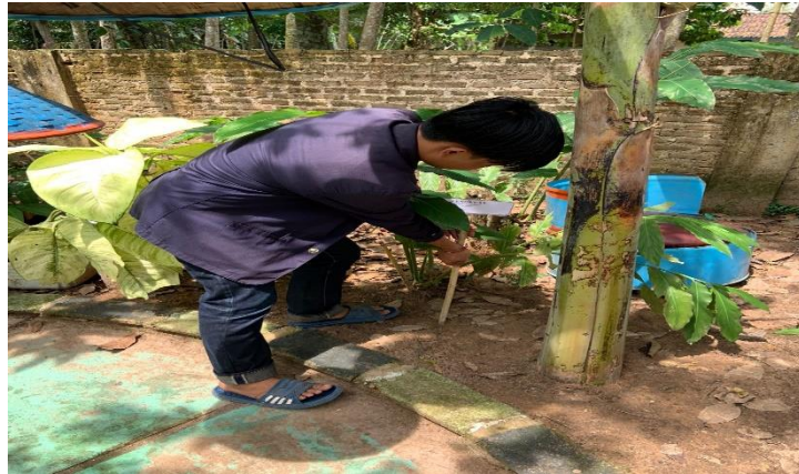
Pemasangan Papan Nama TOGA