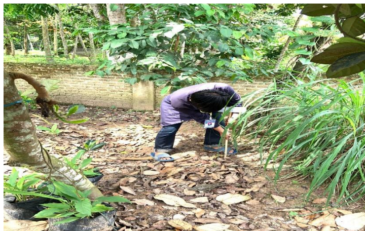
Pemasangan Papan Nama TOGA