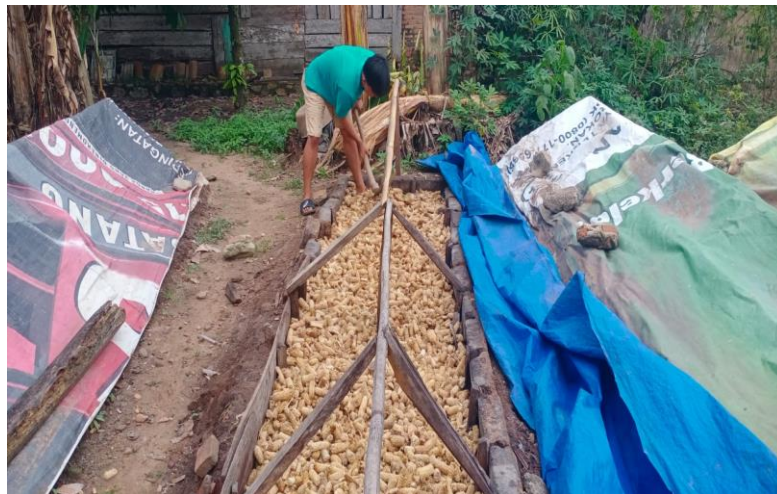
Kegiatan Memanen Jamur Janggel