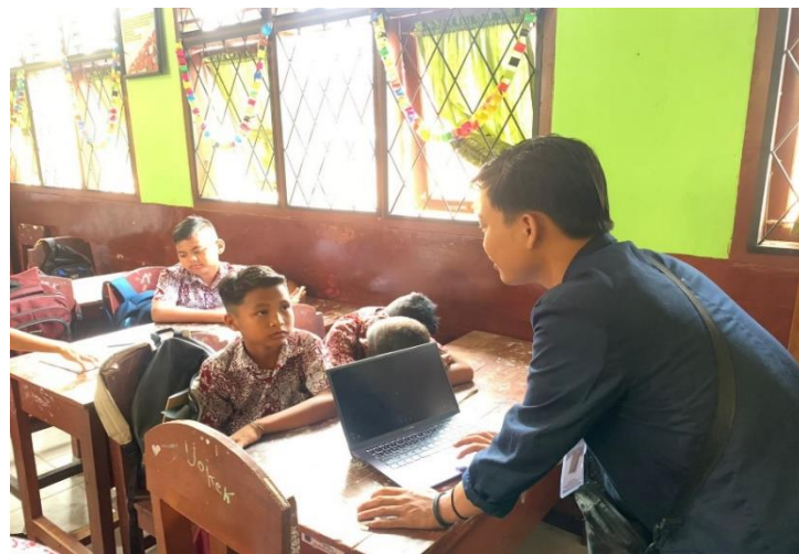
Kegiatan Sosialisasi di SDN 1 Margodadi tentang Cara Beretika