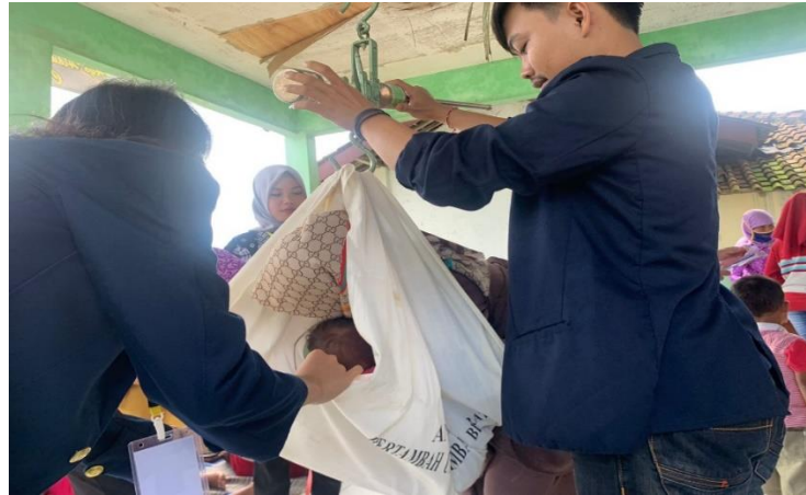
Kegiatan Stunting Posyandu di Desa