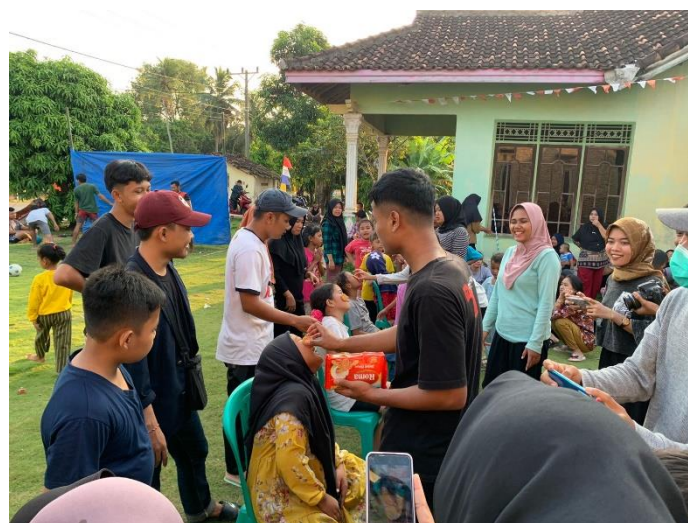
Kegiatan Lomba HUTRI di Desa Margodadi