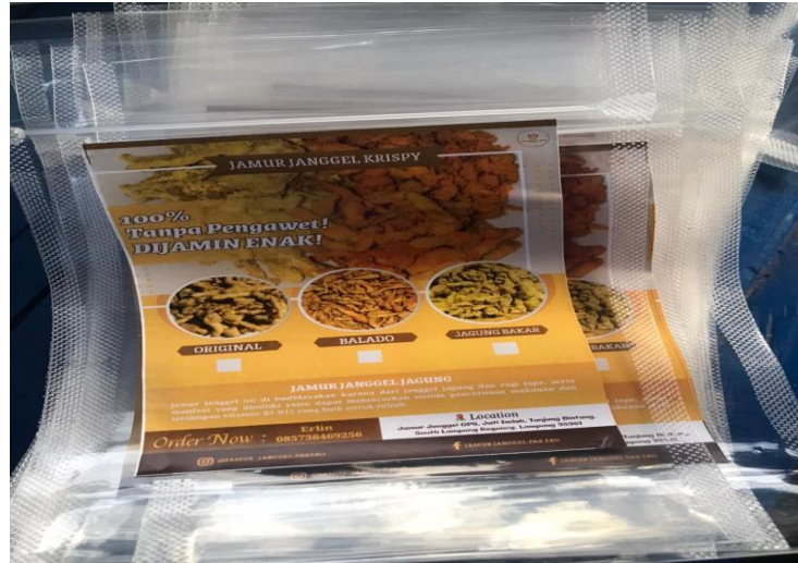
Plastik Kemasan Jamur krispi