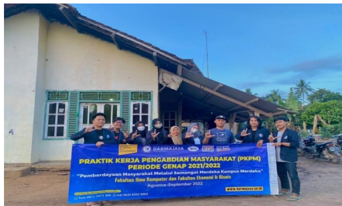
Kegiatan Kunjungan ke UMKM