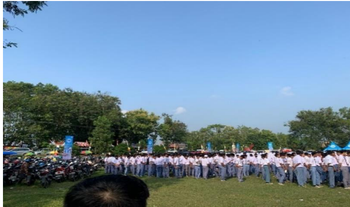
Pelaksanaan Kegiatan Upacara HUTRI di Lapangan Kecamatan Jati Agung