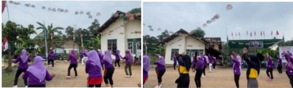
Kegiatan Senam Bersama Paguyuban Sehat