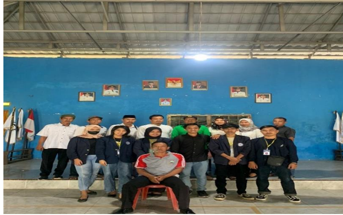
Gambar 2.4. Rapat Pembentukan Panitia HUTRI