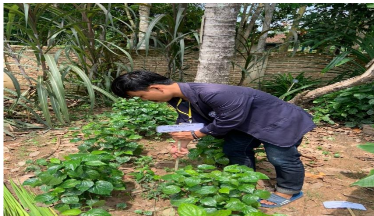
Gambar 2.1. Membuat Name Tag Toga

Adapun manfaat dari penulisan papan nama pada toga tersebut adalah untuk menambah wawasan masyarakat sekitar lingkungan Desa Jati Indah yang membacanya sehingga akan menjadi tahu bahwa nama latin atau nama ilmiah dari tanaman obat keluarga yang tertera pada papan nama tersebut.