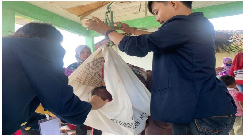
Gambar 2.5. Stunting Posyandu di Balai Desa