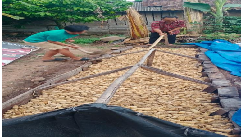
Gambar 2.7 .Membantu Memanen Jamur Janggel