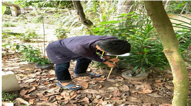
Gambar 2.2. Memasang Papan Nama (Name Tag) TOGA

Pada hari selasa Tanggal 29 Agustus 2022 setelah proses pembuatan papan nama (name tag) Tanaman Obat Keluarga selesai maka kegiatan selanjutnya adalah memasangnya persis ditempat tanaman itu ditanam dan tumbuh. Proses pemasangan ini dibantu dengan kayu yang dijadikan sebagai penyangga dan kemudian ditancapkan disamping Tanaman Obat Keluarga (TOGA) yang tumbuh. Pemasangan papan nama ini tidak memakan waktu yang lama.