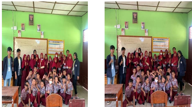
Gambar 2.6. Sosialisasi di SDN 1 Margodadi

Sosialisasi merupakan suatu proses belajar mengajar yang dapat dilakukan secara formal maupun tidak formal. Proses sosialisasi ini dilakukan pada hari Kamis Tanggal 18 Agustus 2022. Kami memberikan sosialisasi tentang cara beretika yang baik kepada siswa di sekolah.