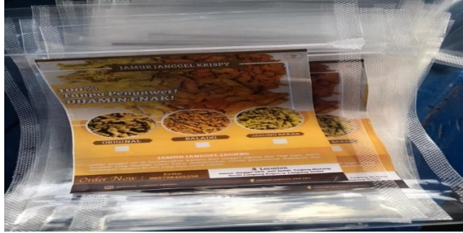
Gambar 2.9. Membuat Jamur Krispi