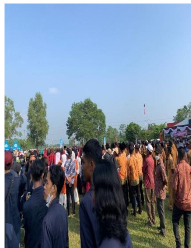
Gambar 2.5. Pelaksanaa Upacara HUTRI di Kecamatan Jati Agung