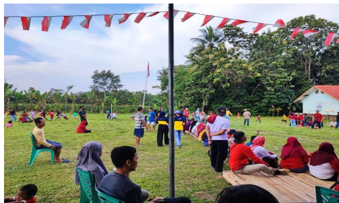
Gambar 2.22 Perlombaan

Dalam rangka perayaan HUT RI di setiap desa atau perkampungan memiliki caranya tersendiri, seperti yang ada di Desa Galih Lunik, sebelum memulai perlombaan Dusun Purwosari mengadakan upacara dan setelahnya mengadakan pawai berkeliling desa menggunakan kendaraan masing – masing yang malamnya dilanjut dengan pembagian hadiah.