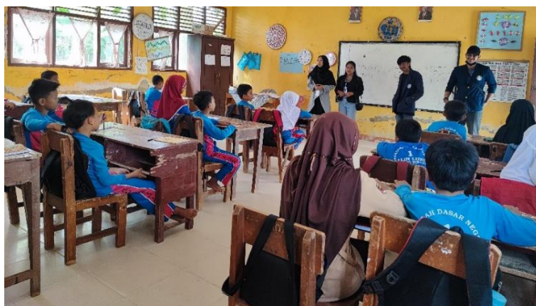
Gambar 2.16 Perkenalan Diri