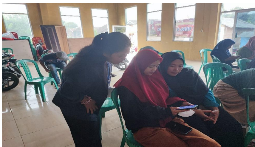
Gambar 2.24 Pendampingan Pembuatan Akun Buku Warung