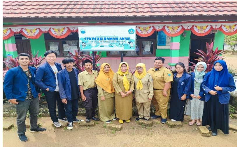
Gambar 2.19 Foto Bersama Kepala Sekolah dan Jajarannya