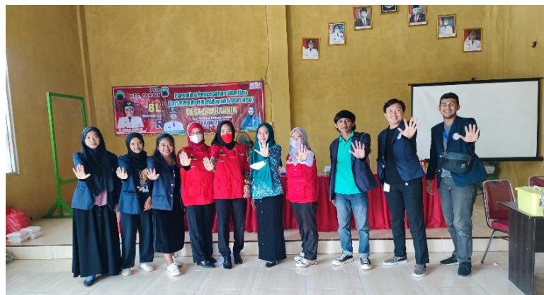
Gambar 2.27 Dokumentasi Bersama ibu-ibu posyandu