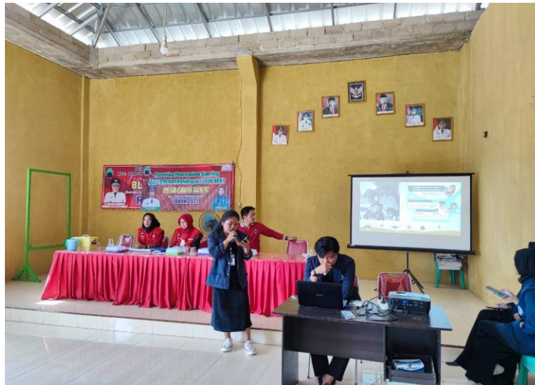
Gambar 2.26 Sosialisasi Stunting perwakilan Mahasiswa PKPM Darmajaya