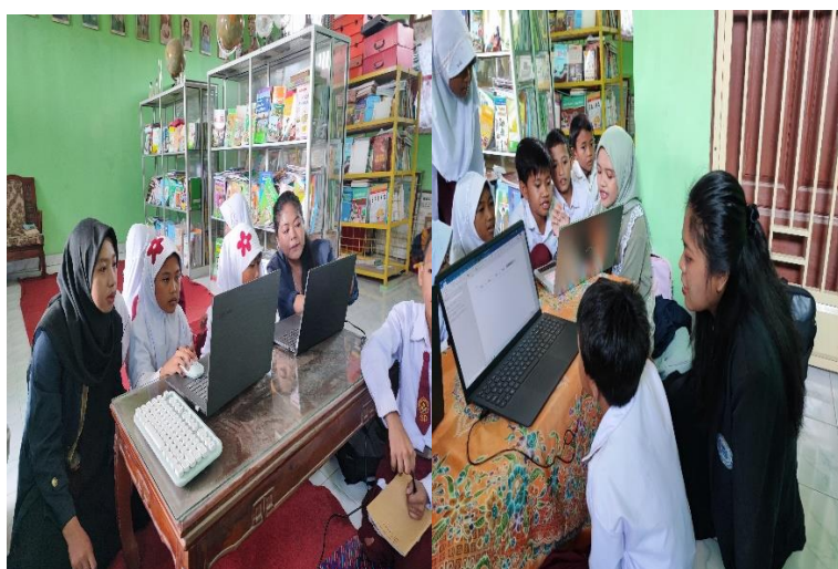
Gambar 2.17 Pelatihan Computer