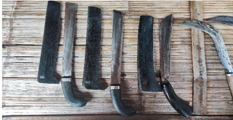
Gambar 2.7 Dokumentasi Foto Produk UMKM Pande Besi

Melakukan foto produk untuk ditampilkan di aplikasi e-commerce