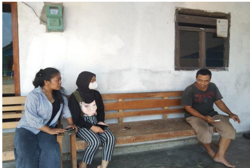
Gambar 2.6 Mendaftarkan UMKM ke Media Sosial

Memberikan informasi terkait penggunaan aplikasi e-commerce dalam peningkatan system pemasaran