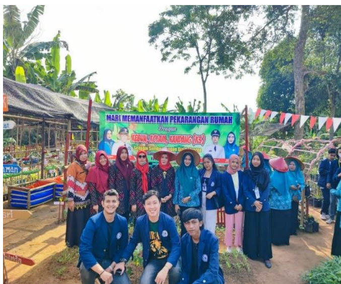
Gambar 2.2 Kegiatan Taman Obat Warga (TOGA)