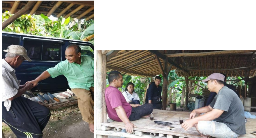
Gambar 2.11 Memberikan Pelayanan Terhadap Customer