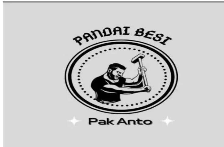
Gambar 2.5 Hasil Pembuatan Logo UMKM Pande Besi