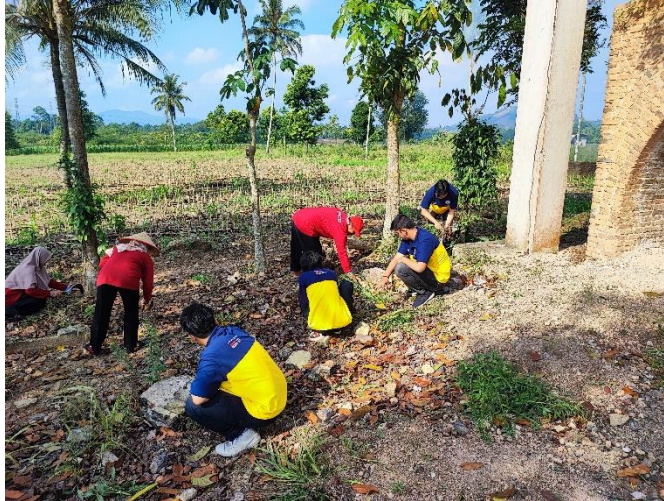
Gambar 2.15 Gotong Royong Membersihkan Benteng