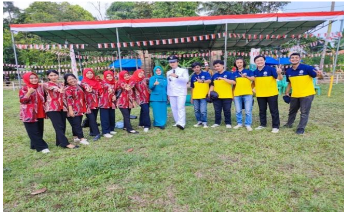
Gambar 2.21 Upacara 17 Agustus HUT RI ke-77 dan foto Bersama Bapak dan Ibu lurah

Dalam rangka perayaan HUT RI di setiap desa atau perkampungan memiliki caranya tersendiri, seperti yang ada di Desa Galih Lunik, sebelum memulai perlombaan Dusun Purwosari mengadakan upacara dan setelahnya mengadakan pawai berkeliling desa menggunakan kendaraan masing – masing yang malamnya dilanjut dengan pembagian hadiah.