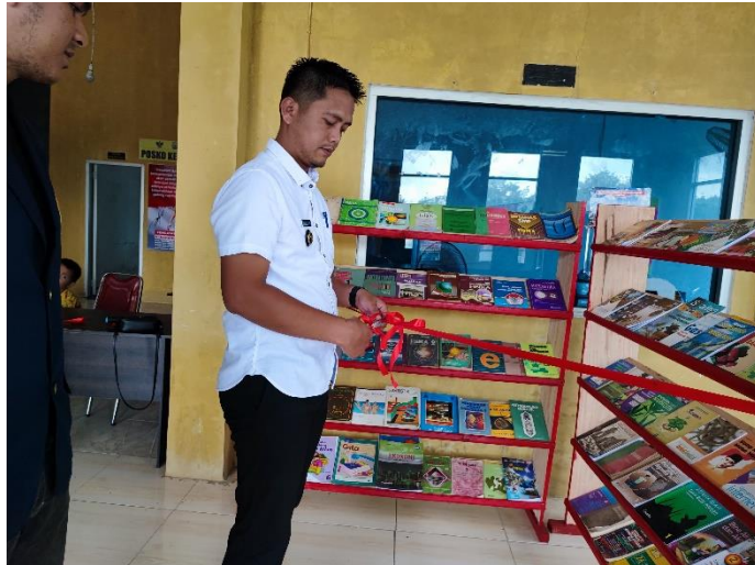
Gambar 2.28 Peresmian TBM