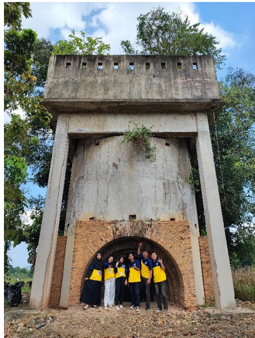
Gambar 2.14 Kunjungan Cagar Budaya

Benteng company merupakan suatu bangunan dimana dulunya bangunan ini dijadikan tempat pembuatan besi dan koin mata uang zaman Belanda dahulu. Disini kami diajak oleh kepala desa untuk melihat tempat bersejarah, selain itu kami juga membantu bergotong royong dalam membersihkan tempat bersejarah.