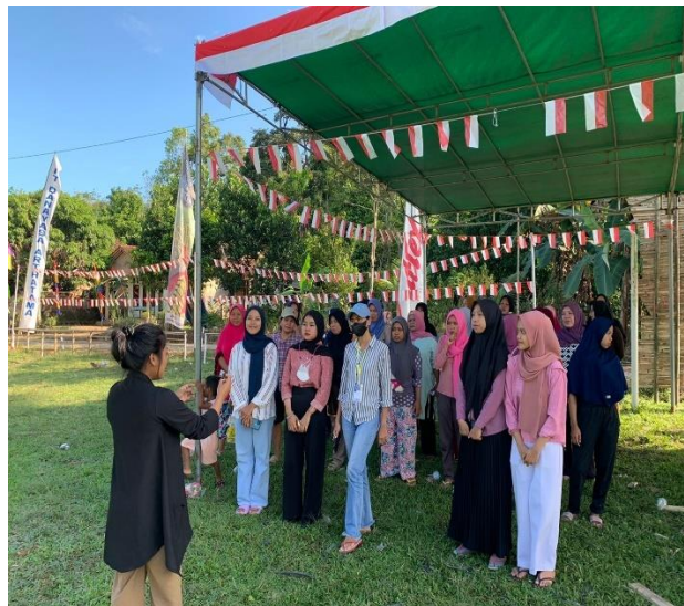
Gambar 2.20 latihan Paduan Suara

Membantu mengikuti perayaan HUT RI di desa Galih Lunik dimana rekan-rekan mahasiswa diminta untuk bertugas pada upacara HUT RI ke-77. Seperti bertugas menjadi danton, paduan suara maupun derijen. Pada tanggal 16 Agustus kami melakukan gladi resik untuk upacara menyambut 17 Agustus.