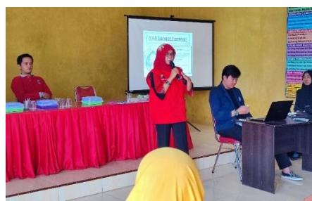
Gambar 2.25 Sosialisasi Stunting

Stunting adalah kondisi gagal tumbuh pada anak balita (bayi dibawah umur 5 tahun) akibat dari kekurangan gizi kronis sehingga anak terlalu pendek untuk usianya. Pencegahan stunting dapat dilakukan saat masa kehamilan dengan cara memakan makanan yang bergizi serta meminum vitamin.