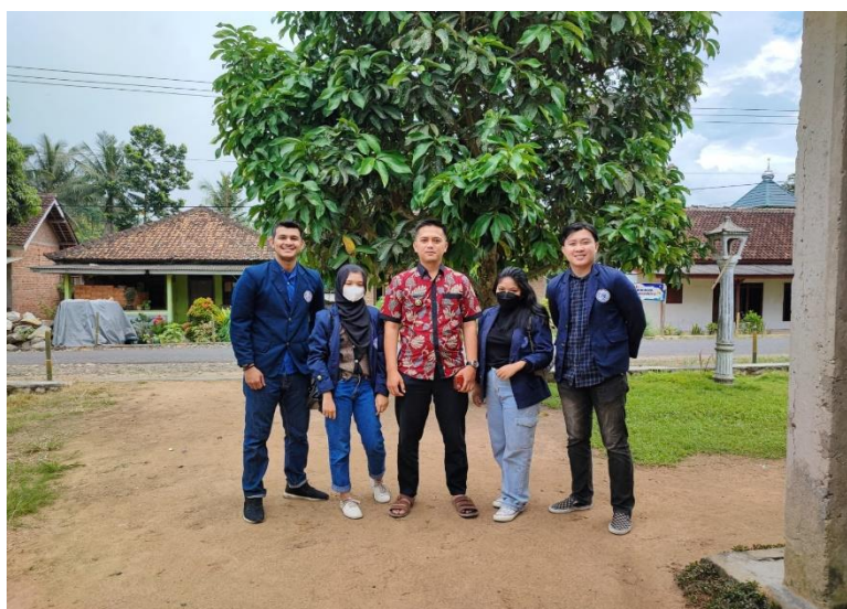
Gambar 2.1 Permohonan Izin Kepada Kepala Desa