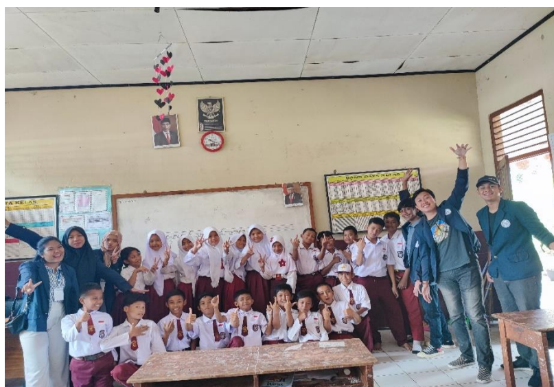
Gambar 2.18 Foto Bersama Siswa Siswi