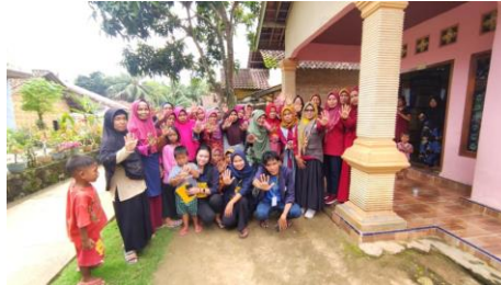
Gambar 4. Kegiatan Stunting

Hasil dari kegiatan penyuluhan Stunting adalah penyuluhan dapat member pengetahuan kepada masyarakat bagaimana cari menghindari stunting dan cara memenuhi gizi kepada anak agar tumbuh normal.