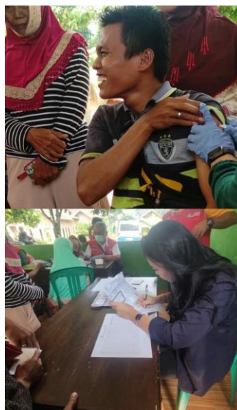
Gambar 6. Kegiatan Vaksinasi

Mahasiswa membantu dalam administrasi vaksinisasi di Desa Karang Jaya, pemberian vaksin COVID-19 memiliki banyak manfaat diantaranya meningkatkan kekebalan tubuh dari paparan COVID-19 serta mencegah mutasi baru dari COVID-19. Selain itu, vaksin COVID-19 yang disuntikkan kepada masyarakat sudah melalui serangkaian pengujian ketat, sehingga dipastikan aman, bermutu dan berkhasiat.