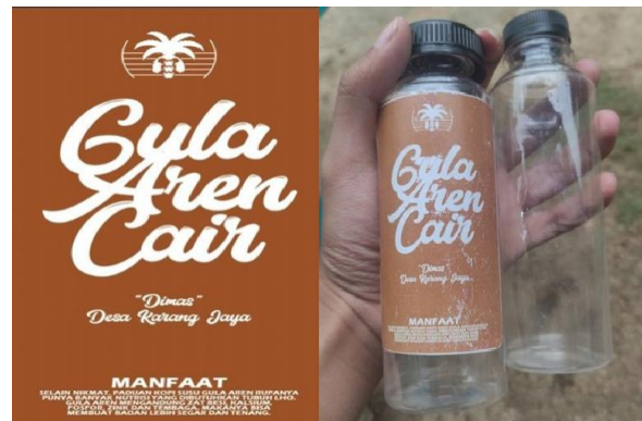
Gambar 1. Logo dan Kemasan Produk

pisang diganti dengan menggunakan botol plastik. Kemasan yang dibuat juga tertera logo dari merek yang kami buat dengan tujuan sebagai pemasaran tidak langsung sekaligus membentuk citra merek dari produk yang dihasilkan.