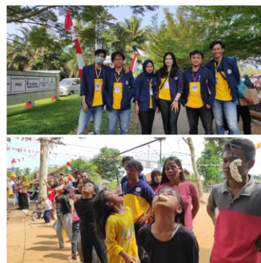
Gambar 2. Perayasn HUT RI ke-77

Bulan Agustus menjadi bulan bersejarah bagi Bangsa Indonesia, pada tanggal 17 Agustus Indonesia meraih kemerdekaannya setelah dijajah oleh bangsa asing, bebas dari belenggu penjajahan. Kerap kali dalam peringatan hari kemerdekaan, banyak masyarakat memeriahkan dengan berbagai perlombaan. HUT Kemerdekaan Indonesia yang ke-77 ini sangat berkesana, setelah 2 tahun lalu tidak bisa memeriahkan dikarenakan Virus Covid-19 yang sedang melanda Tanah Air. Pemuda Pemuda bersama warga Masyarakat Desa Karang Jaya Pada HUT ke -77 akan ikut berpartisipasi dalam memeriahkan hari kemerdekaan Indonesia yang ke-77.