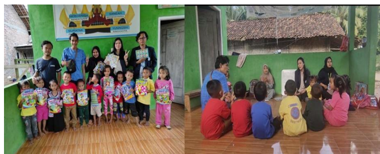
Gambar 5. Kegiatan Pendampingan Paud

Pada kegiatan kali ini mahasiswa PKPM membantu para guru dalam proses pembelajaran murid PAUD. Kegiatan ini diharapkan dapat membantu guru dalam proses mengajar dan membimbing para murid. Mahasiswa melakukan beberapa kegiatan seperti mewarnai, menyanyi dan belajar berdoa dan memberikan sarana pembelajaran berupa buku baca dan mewarnai.