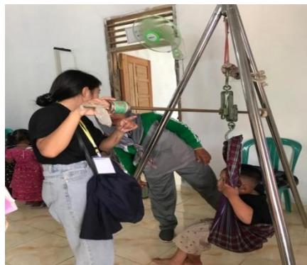
Gambar 1. 4 Kegiatan posyandu di desa Trimulyo

Posyandu dapat mencegah anak terkena berbagai faktor risiko stunting melalui program program yang diselenggarakan .Beberapa program Posyandu sebagai upaya pencegahan stunting adalah pemberian vitamin A, penanggulangan diare,sanitasi dasar serta peningkatan gizi Posyandu bukan hanya terkait vaksinasi.