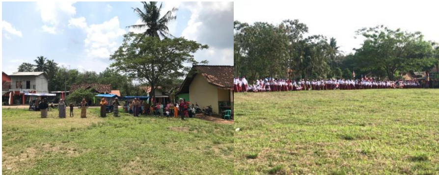
Gambar 1. 2 Kegiatan upacara HUT RI Ke-77