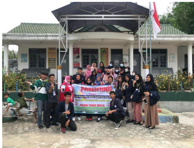
Gambar 1. 5 Kegiatan Parenting di Desa Trimulyo

Parenting adalah orang yang sedang melakukan atau mengerjakan aktivitas sebagai orang tua. Selanjutnya kata parenting berdasar makna atau arti merupakan ilmu tentang mengasuh, membimbing, serta mendidik anak dengan cara baik dan benar. Melalui parenting orang tua akan memiliki keterampilan dan pengetahuan yang sangat bermanfaat khususnya bagi anak, misalnya seperti pengetahuan tentang pola pengasuhan yang baik akan membentuk kepribadian anak. Kegiatan parenting ini bertempat di TK Harapan Bunda di Dusun Tanjung Jaya Desa Trimulyo.