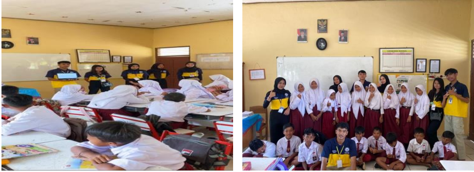
Gambar 1. 3 Sosialisasi dan pendampingan belajar di SDN 1 Trimulyo