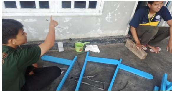
Gambar 1. 7 Pembuatan plang jalan

Tujuan kegiatan pembuatan plang jalan adalah untuk memberikan informasi kepada masyarakat dan pengguna jalan lainnya yang ingin mencari tata letak dusun atau jalan tertentu di Desa Trimulyo.