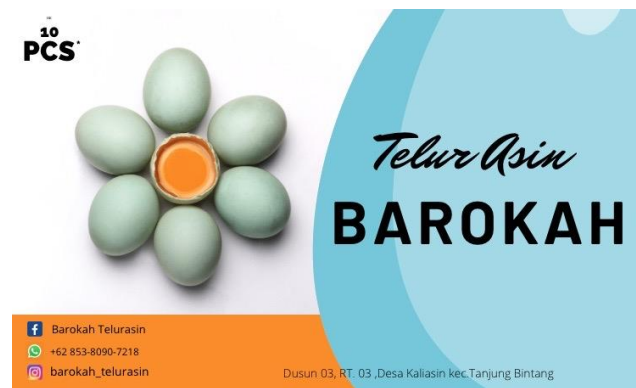
Gambar 6 : Tampilan Desain Kemasan