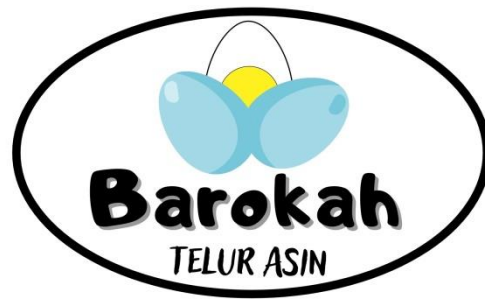
Gambar 5 : Tampilan Logo