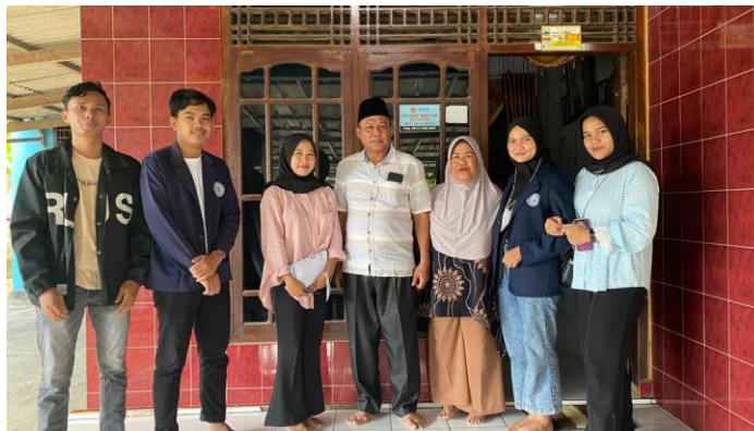
Gambar 9 : Kunjungan ke Desa Kaliasin

Berikut gambar dokumentasi yang diambil selama melakukan Praktek Kerja Pengabdian Masyarakat :