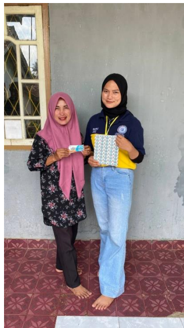
Gambar 13 : Penyerahan Logo dan Desain Kemasan kepada pemilik UMKM