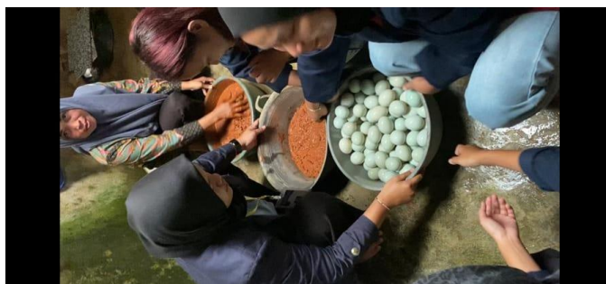
Gambar 10 : Proses Pembuatan Telur Asin