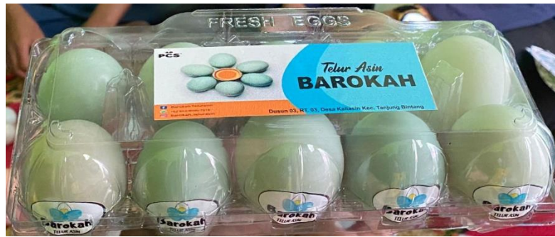
Gambar 8. Kemasan Sebelum di Lakukan Inovasi