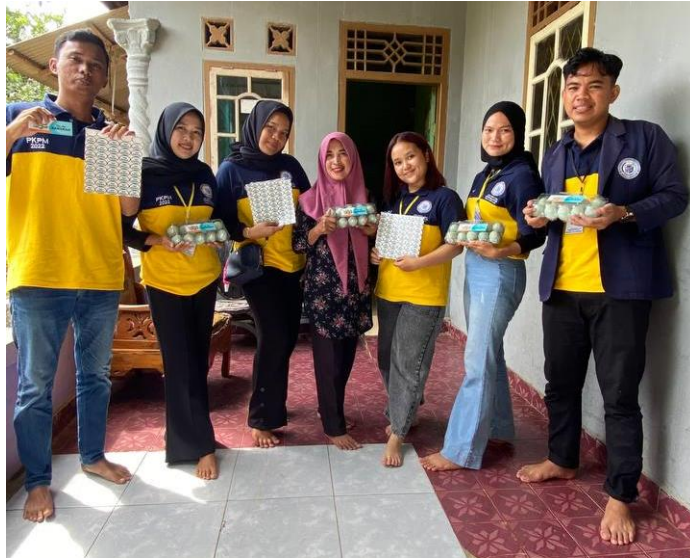
Gambar 14 : Perpisahan Dengan Pemilik Barokah Telur Asin