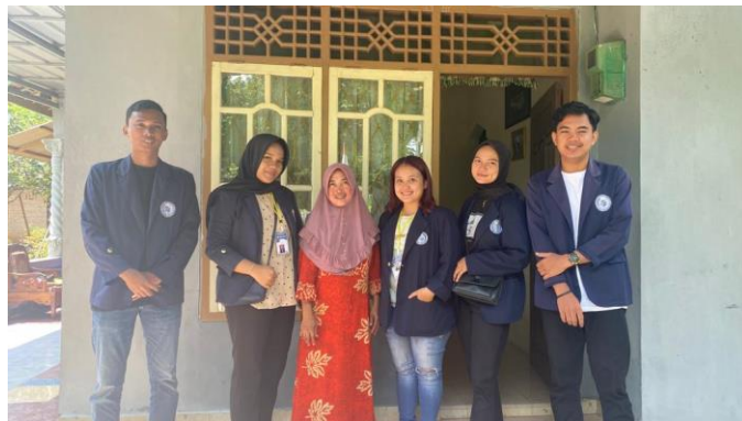
Gambar 2. Kunjungan UMKM

Kunjungan yang dilakukan ke UMKM pada tanggal 12 Agustus 2022 adalah untuk mengetahui bagaimana usaha Barokah Telur Asin selama berdiri. Selain itu, berdiskusi dengan pemilik usaha apa saja hambatan yang di alami selama menjalankan usaha. Dari hasil diskusi ini di dapatkan hasil berupa inovasi pembuatan media sosial (Instagram dan Facebook) dan pembuatan logo serta desain kemasan untuk memberikan informasi terkait Barokah Telur Asin dari usaha UMKM tersebut.