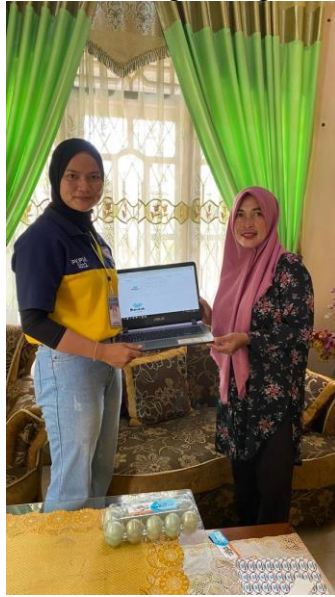
Gambar 12 : Penyerahan Akun Instagram dan Facebook kepada pemilik UMKM