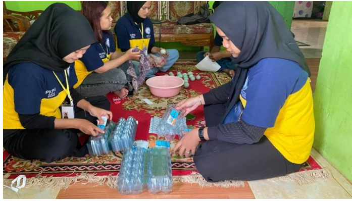
Gambar 11 : Proses Pemasangan Logo dan Desain Kemasan