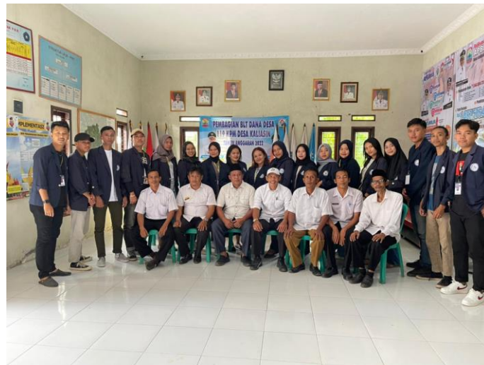
Gambar 15 : Perpisahan Dengan Aparatur Desa Kaliasin