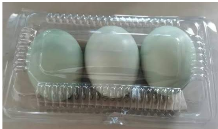
Gambar 7 . Kemasan Sebelum di Lakukan Inovasi

Di sini inovasi yang di laksanakan oleh penulis adalah sebuah inovasi pada sosial media serta membuat logo dan desain kemasan, di mana sebelumnya pada UMKM Barokah Telur Asin itu belum ada media sosial serta logo dan desain kemasan, jadi penulis memiliki ide untuk membuat media sosial serta desain logo untuk UMKM Barokah Telur Asin.