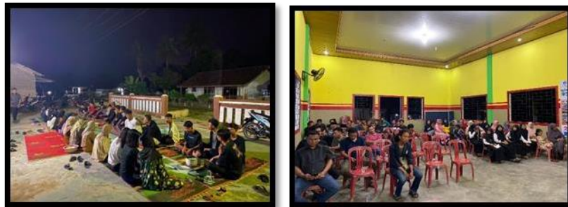
Gambar 17. Perpisahan dengan Karang Taruna dan Warga desa Tanjung Harapan

Sebelum penarikan mahasiswa PKPM, Karang Taruna dan Aparat Desa membuat acara perpisahan dengan mahasiswa PKPM. Acara perpisahan ini menjadi momentum untuk mengucapkan terimakasih kepada warga desa yang telah menerima dengan baik mahasiswa PKPM di desa Tanjung Harapan.