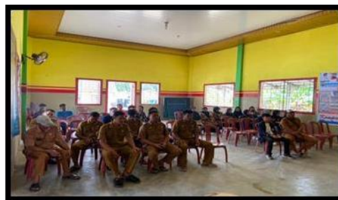
Gambar 2. Menghadiri Undangan Aparat Desa Tanjung Harapan

Mahasiswa PKPM diundang Aparat Desa Tanjung Harapan di Balai Desa untuk membahas kegiatan HUT-RI Ke 77 dalam pembentukan panitia maupun persiapan Upacara Pengibaran Bendera