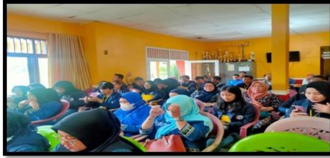
Gambar 18. Penarikan Mahasiswa PKPM di Kecamatan Merbau Mataram