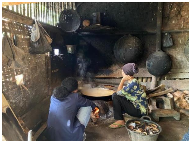
Gambar 10. Berdiskusi dengan pemilik UMKM

Berdiskusi bagaimana meningkatkan kualitas produk melalui inovasi packaging agar meningkatkan penjualan produk gula aren