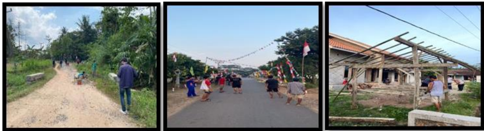
Gambar 5. Gotong Royong di Desa Tanjung Harapan

Kegiatan gotong royong ini bertujuan membantu kegiatan warga desa Tanjung Harapan seperti Perbaikan Jembatan di Dusun Ringing Sari, pemasangan plastik umbul-umbul, dan membantu membuat Gardu di Dusun Wates.