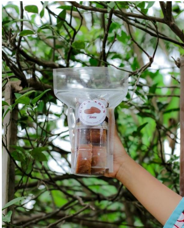
Gambar 12. Hasil dari inovasi Packaging

Dari hasil diskusi tersebut kami mulai menginovasi bentuk kemasan, pembuatan logo, lokasi tempat pembuatan gula aren, dan sosial media agar jangkauan penjualan produk gula aren ini lebih luas.