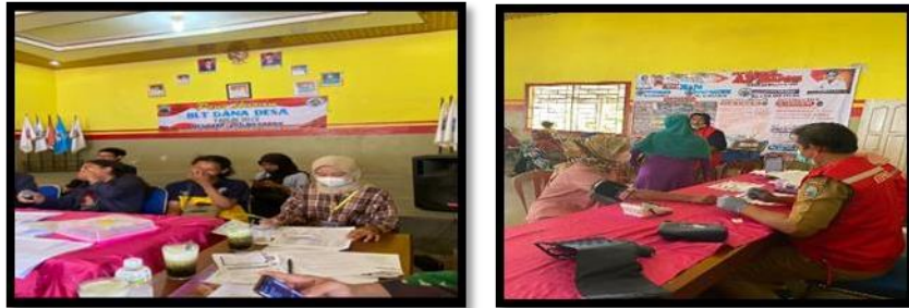
Gambar 15. Vaksinisasi di balai desa Tanjung Harapan