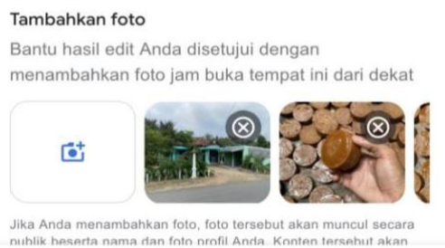
Gambar 13. Pembuatan