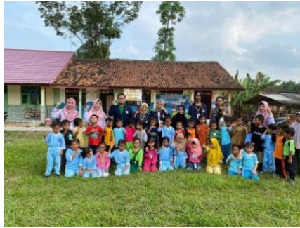
Gambar 4 Kunjungan Ke Sekolah yang ada di Desa Tanjung Harapan