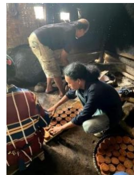
Gambar 11. Proses produksi gula aren