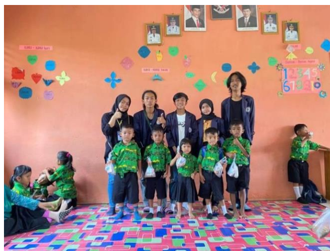
Gambar 16. Foto saat kegiatan PMT

Pemberian Makanan Tambahan adalah program intervensi bagi balita yang menderita kurang gizi dimana tujuannya adalah untuk meningkatkan status gizi anak serta untuk mencukupi kebutuhan zat gizi anak agar tercapainya status gizi dan kondisi gizi yang baik sesuai dengan umur anak tersebut.