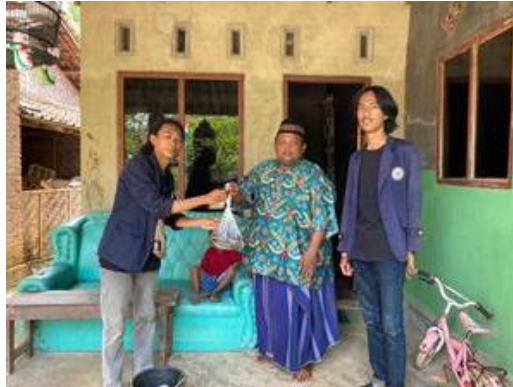
Gambar 6. Membagikan ikan lele hasil budidaya desa Tanjung Harapan untuk program stunting

serta yang berat badannya pada KMS ( Kartu Menuju Sehat) terletak dibawah garis merah