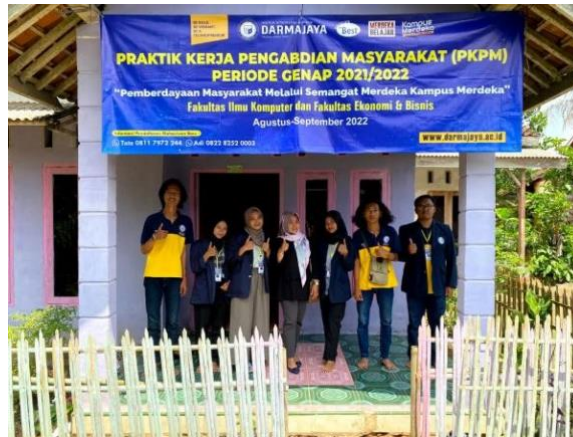
Gambar 9. Kunjungan DPL ke Desa Tanjung Harapan