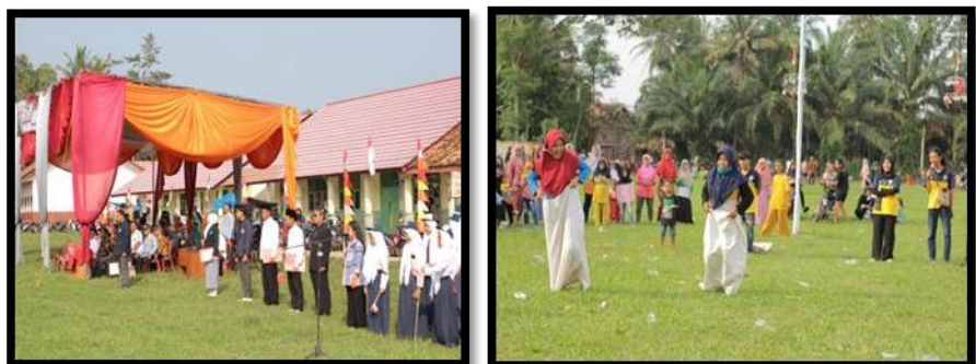
Gambar 7. Upacara HUT-RI dan Memeriahkan HUT-RI Ke 77

Kegiatan ini dilaksanakan dalam rangka hari ulang tahun kemerdekaan Republik Indonesia yang ke 77, yaitu mengikuti upacara bendera dan membantu perlombaan dalam memeriahkan HUT-RI. Kami membantu menyelenggarakan perlombaan di setiap dusun khususnya Dusun Tanjung Harapan, Dusun Wates, dan Dusun Simpang Tiga.