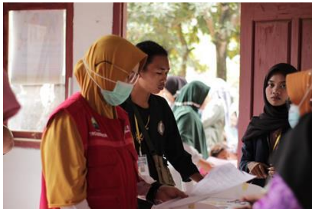
Gambar 3 Kegiatan Posyandu Balita dan Lansia

Kegiatan ini merupakan kegiatan yang dilakukan oleh puskesmas desa Tanjung Harapan untuk mengecek pertumbuhan anak-anak balita dan memberikan vitamin sebagai program pengecekan stunting, selain itu juga melakukan posyandu terhadap lansia dengan mengecek tensi darah guna mendeteksi adanya kemungkinan atau risiko hipertensi. Kami juga membagikan makanan kepada anak-anak balita dan lansia setelah pengecekan