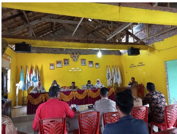
Gambar 16 Acara Monitoring PBB