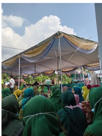
Gambar 12 Pengajian Akbar NU