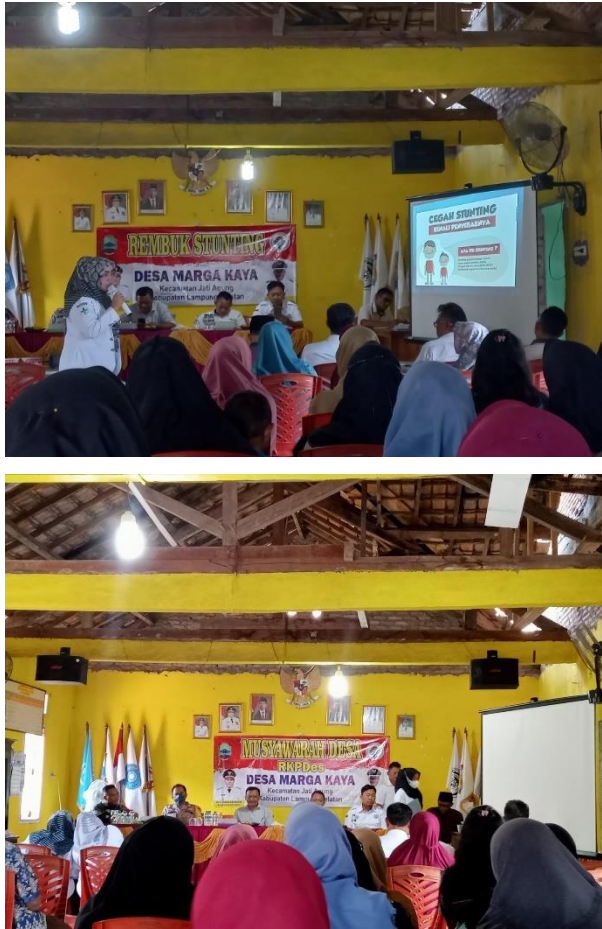
Gambar 17 Acara Rembuk Stunting dan RKPDes di Balai Desa Marga Kaya