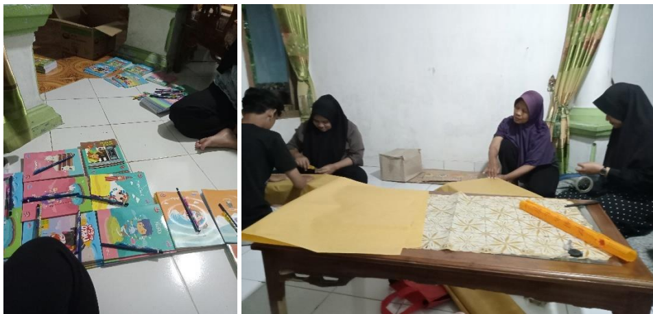
Gambar 8 Persiapan lomba 17an