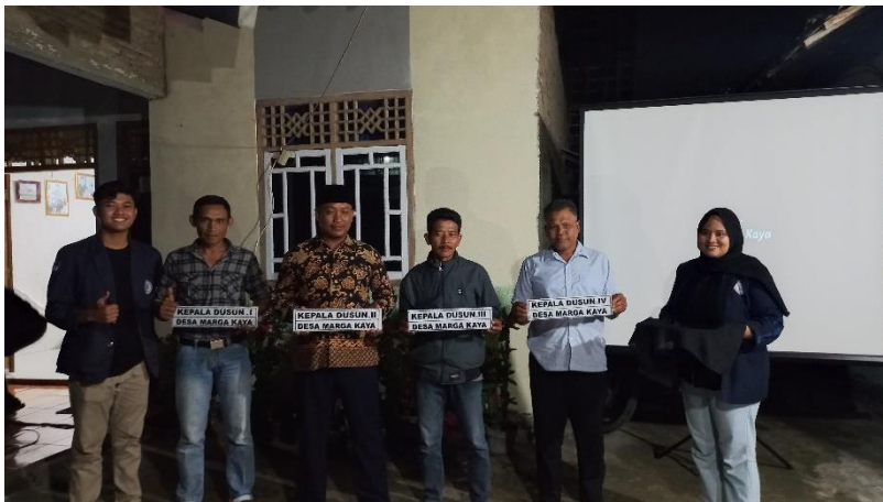
Gambar 20 Serah terima plakat dan papan nama untuk Desa Marga Kaya