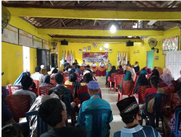
Gambar 13 Acara pembagian BLT di Balai Desa Marga Kaya