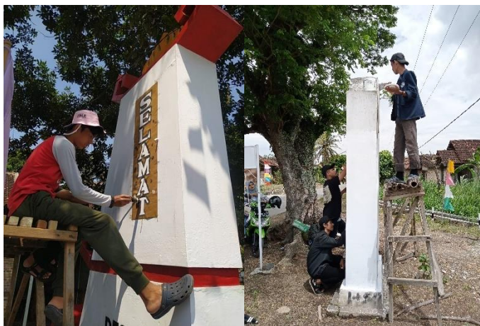
Gambar 6 Gotong royong