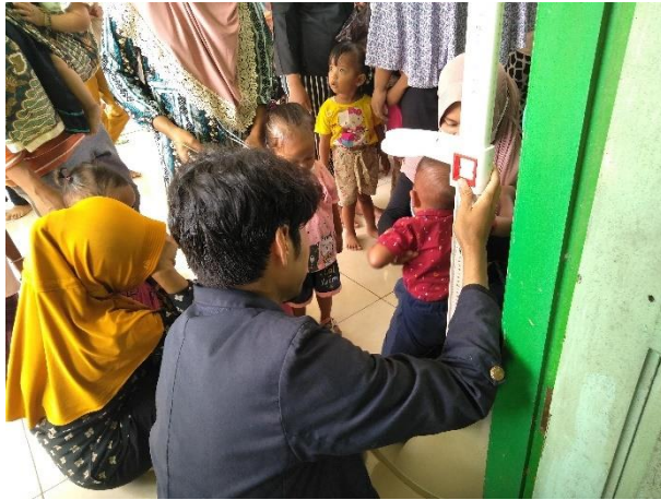
Gambar 4 Membantu Kader dalam pendataan anak.