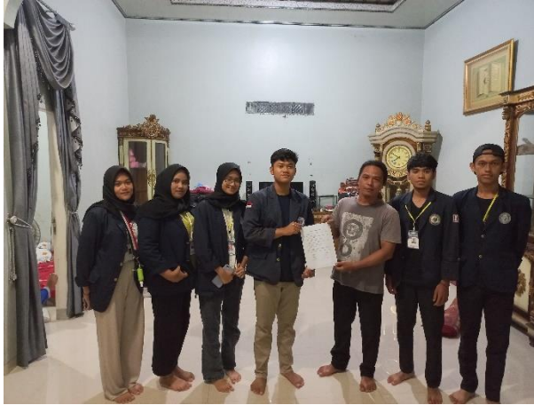
Gambar 19 Serah terima UMKM Kopi Bubuk Lampung Cap Jempol