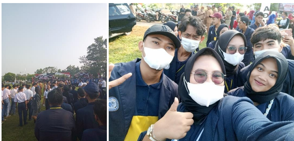
Gambar 9 Ucapara HUT RI