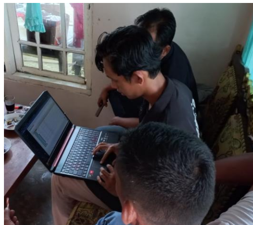
Gambar 1 Pelatihan dasar Hosting dan Domain