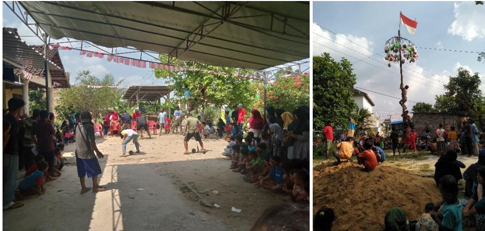
Gambar 10 Perlombaan di Dusun 2, Desa Marga Kaya