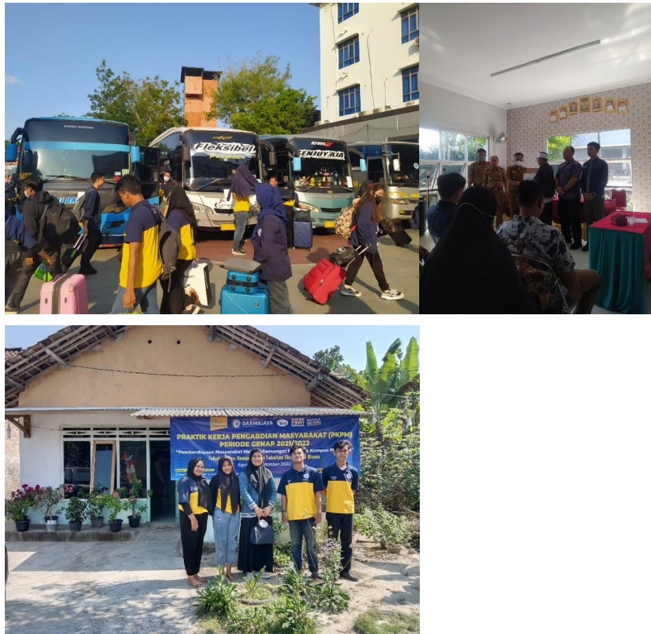
Gambar 3 Keberangkatan Mahasiswa, Penyerahan di Kecamatan Jati Agung, dan Kunjungan DPL.