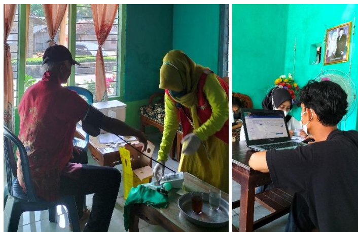
Gambar 18 Vaksinasi