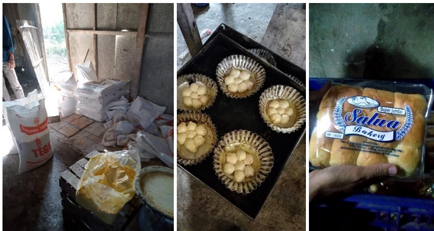
Gambar 11 Kunjungan ke UMKM Roti Salwa