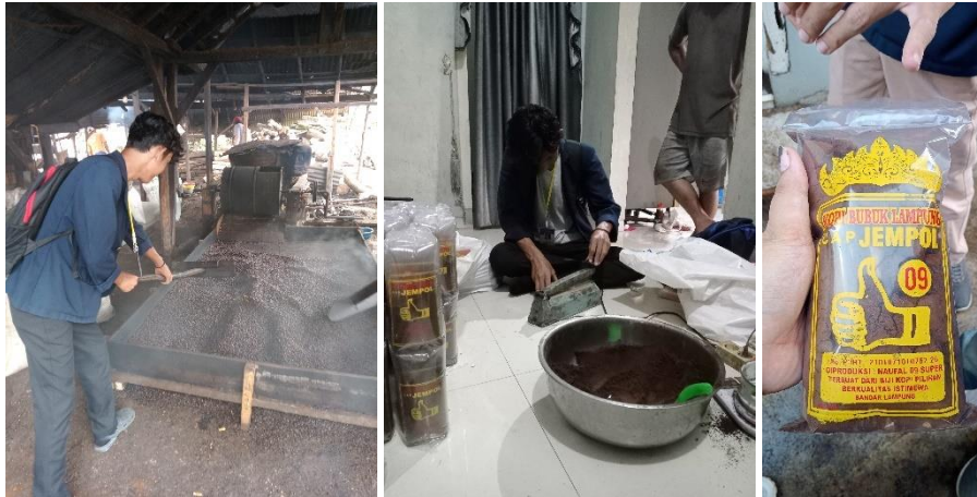
Gambar 7 Kunjungan ke UMKM Kopi Bubuk Lampung Cap Jempol