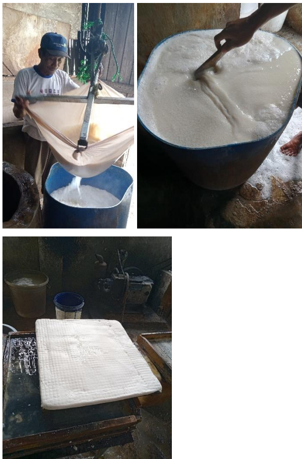
Gambar 14 Kunjungan ke UMKM Tahu