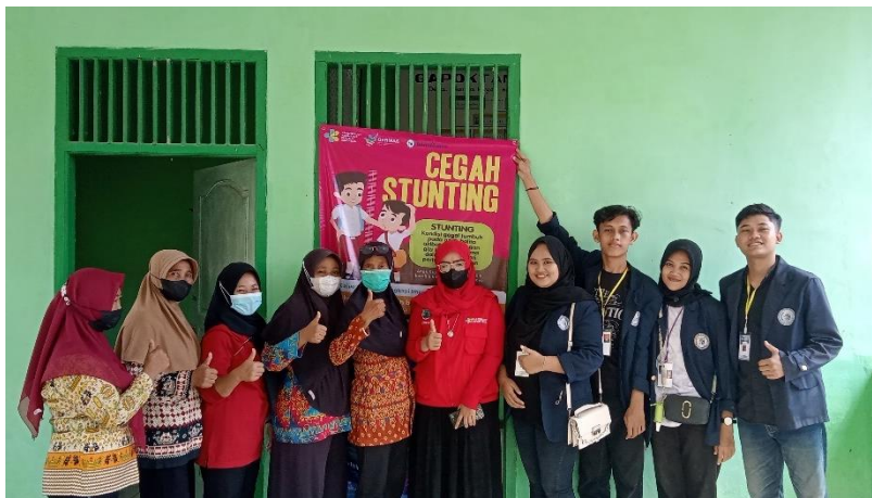
Gambar 5 Penyerahan banner cegah Stunting