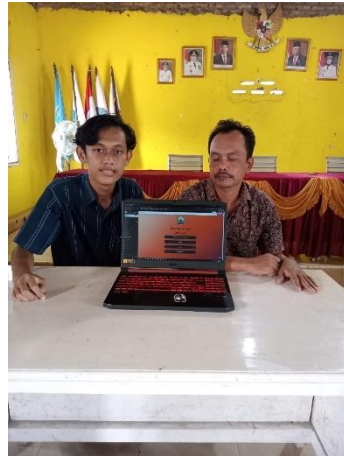
Gambar 2 Pelatihan dasar Wordpress sebagai Bio Link