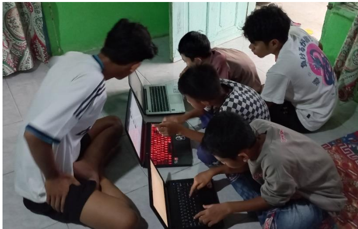
Gambar 15 Bimbel anak-anak