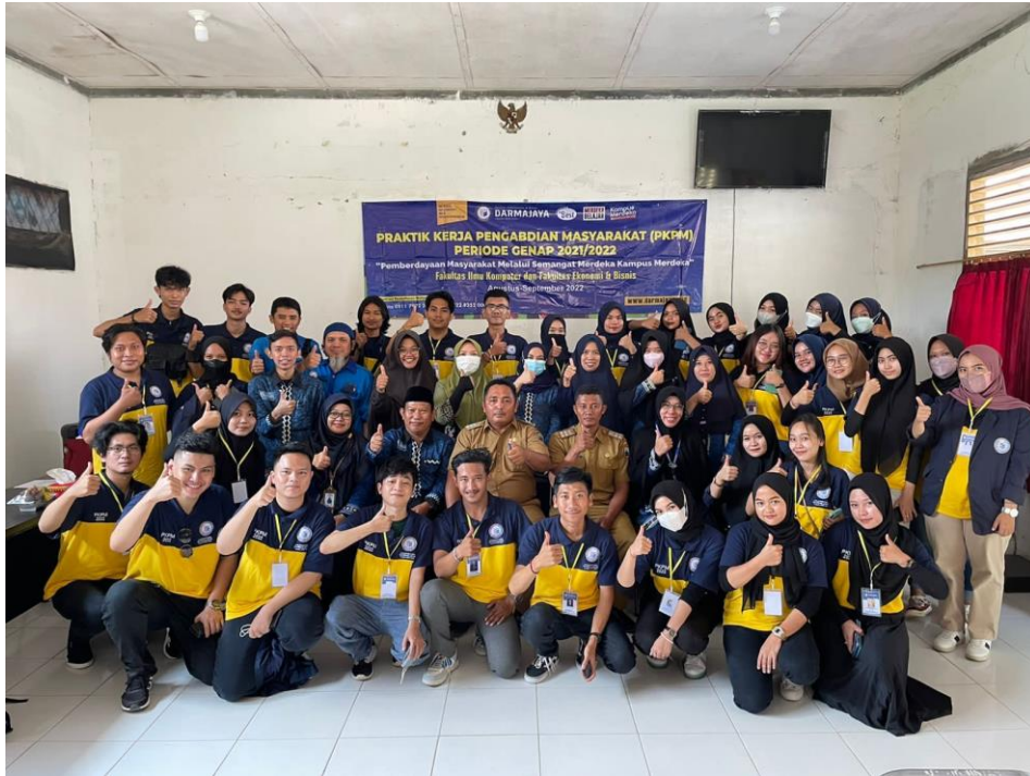
Gambar 2.1 Pelepasan di Kantor Kecamatan Tanjung Bintang