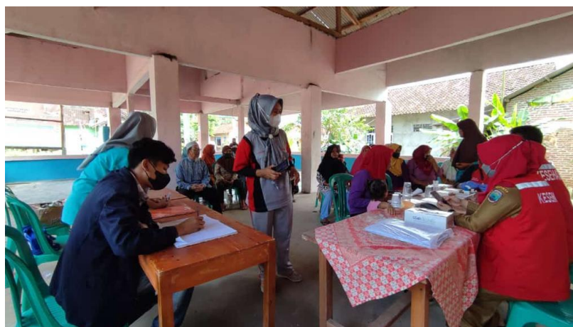
Gambar 2.8 Kegiatan Sosialisasi Di Posyandu Desa Rejomulyo

Sosialisasi kegiatan posyandu berupa stunting . Stunting adalah kondisi gagal tumbuh pada anak balita akibat dari kekurangan gizi kronis sehingga anak terlalu pendek untuk usianya. Selanjutnya membantu kegiatan imunisasi yang bertepatan sedang dilakukannya di hari itu, dengan adanya kegiatan imunisasi dan sosialisasi terkait stunting hal ini diharapkan dapat membantu masyarakat dalam mempermudah dilakukannya pencegahan untuk penanggulangan stunting itu sendiri.