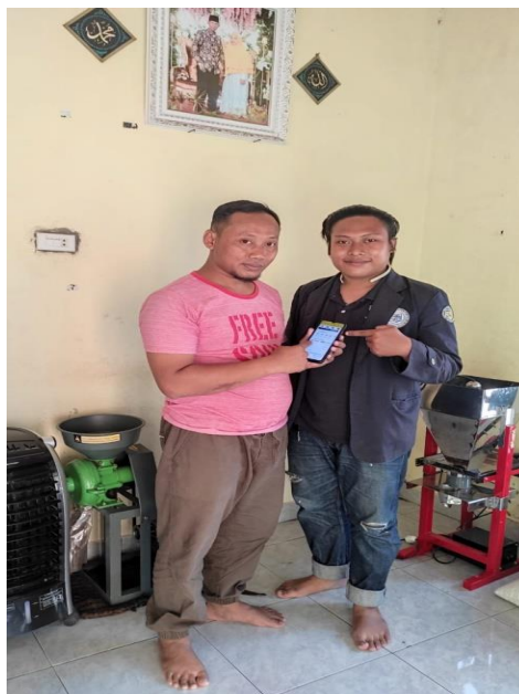
Gambar 2.6 Bersama Pemilik UMKM

Secara tidak langsung bertemu dengan pemilik UMKM Kopi Cap Dua Jempol, setelah memberitahukan program kerja yang ingin dilakukan. Pemilik langsung menanggapi untuk memberikan pengajaran serta pelatihan kepada pemilik secara langsung yaitu memberikan pelatihan kepada pemilik dalam membuat laporan keuangan berbasis aplikasi, saya membuat laporan keuangan UMKM Kopi Cap Dua Jempol dari tanggal 01 September – 07 September. Dalam hal ini yang digunakan adalah aplikasi Buku Kas untuk membantu dalam memperlancar program kerja tersebut.