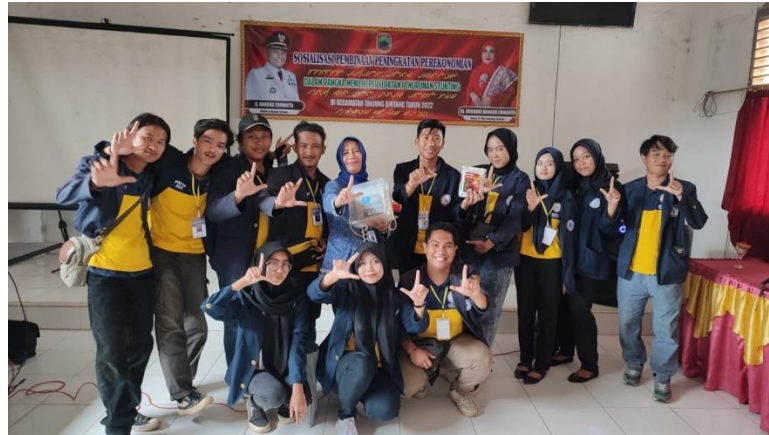
Gambar 2.9 Pengembalian Mahasiswa Di Kantor Kecamatan Tanjung Bintang

Kegiatan penyerahan kembali mahasiswa kepada kampus IIB DARMAJAYA yang dilakukan di Kantor Kecamatan Tanjung Bintang. Kegiatan ini dilakukan karena telah selesai nya kegiatan PKPM mahasiswa IIB DARMAJAYA yang telah terlaksana dari tanggal 08 Agustus – 08 September 2022.