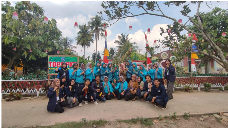
Gambar 2.3 Pemberdayaan Kebun Toga

Kegiatan sosialisasi bersama dengan ibu - ibu PKK dalam rangka membersihkan dan merawat kebun toga yang berada di Desa Rejomulyo, kegiatan ini di laksanakan bersama dengan seluruh ibu – ibu yang tergabung dengan perkumpulan ibu - ibu PKK yang ada di Desa Rejomulyo dalam rangka kegiatan kunjungan serta penilaian kebun yang akan dikunjungi dari kumpulan organisasi ibu – ibu PKK Tanjung Bintang. Selanjutnya dari hasil penilaian diharapkan akan memberikan rasa percaya ibu – ibu untuk semangat melestarikan kebun toga lebih baik lagi kedepannya.