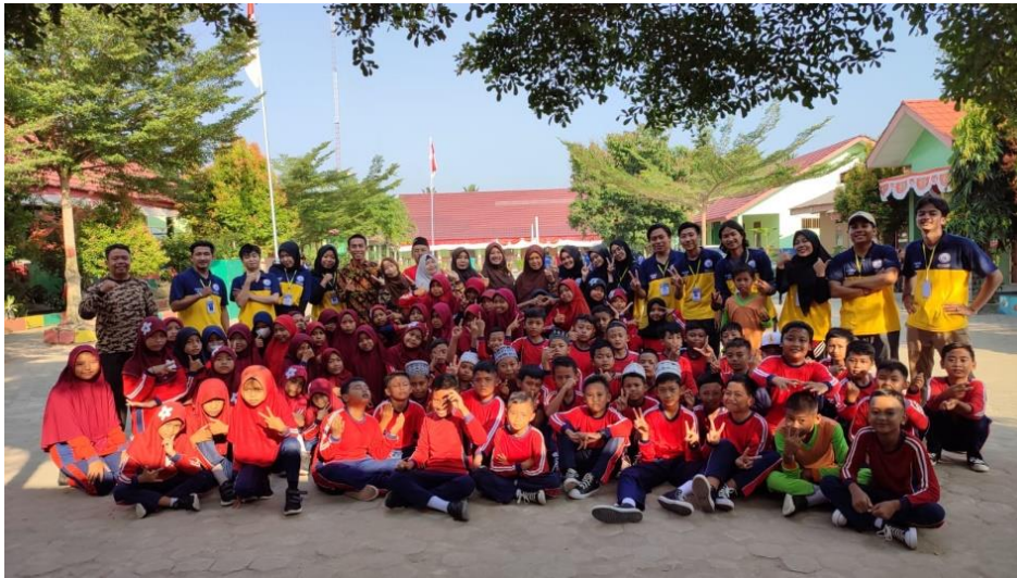
Gambar 2.4 Kunjungan ke Sekolah Dasar

Kunjungan ke Sekolah Dasar Rejomulyo adalah untuk melakukan kegiatan senam bersama adik – adik, disamping itu membantu melatih drum band untuk persiapan kegiatan karnaval dan memperingati perayaan Hari Ulang Tahun Negara Kesatuan Republik Indonesia yang ke-77. Antusias dan perhatian dari pihak sekolah baik sehingga memudahkan dalam melatih drum band dan membaur bersama siswa tersebut.