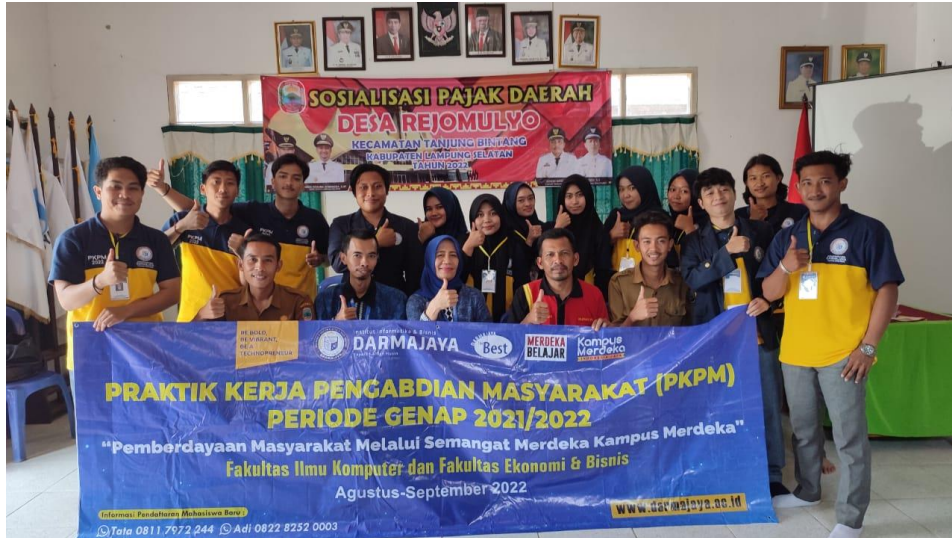
Gambar 2.2 Serah Terima Di Balai Desa