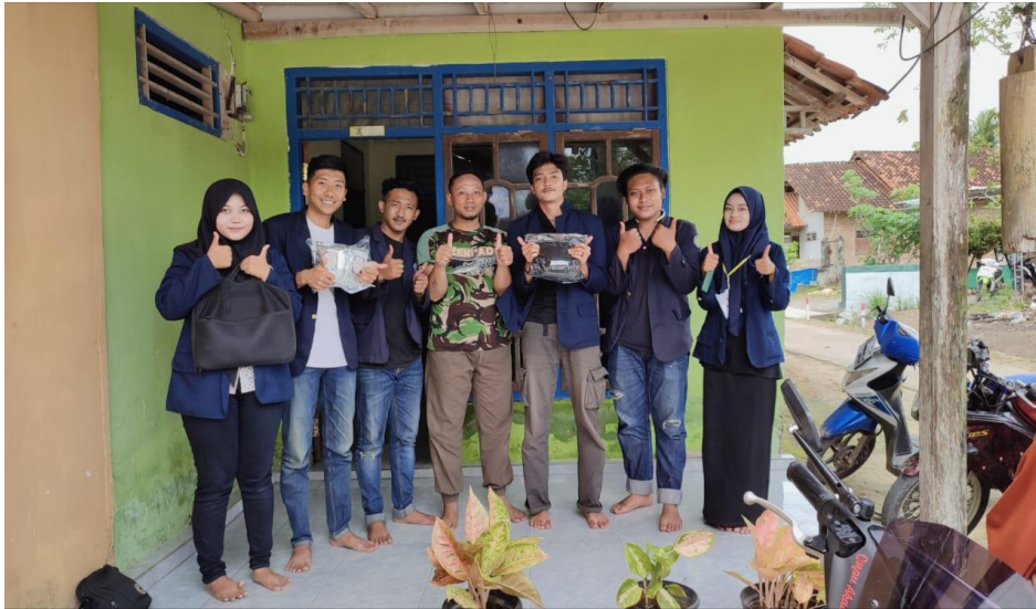
Gambar 2.5 Sosialisasi ke UMKM