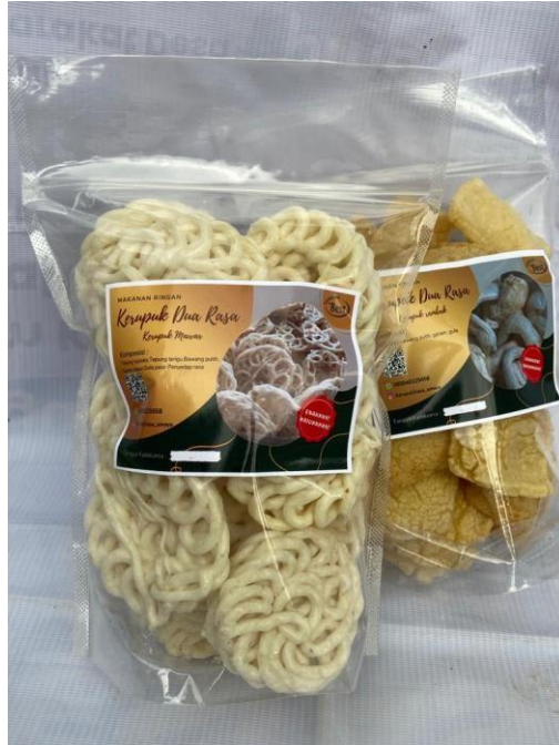
Gambar 2.3.8 Pemberian sample kemasan baru