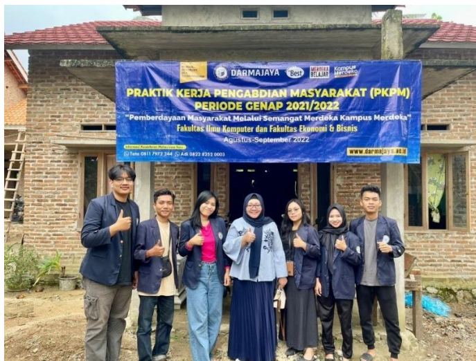
Gambar 2.3.11 kunjungan DPL kedua