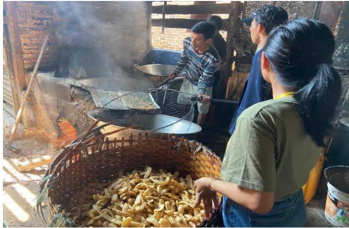
Gambar 2.3 Proses produksi