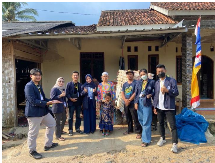
Gambar 2.2 kunjungan pertama ketempat UMKM kerupuk dua rasa