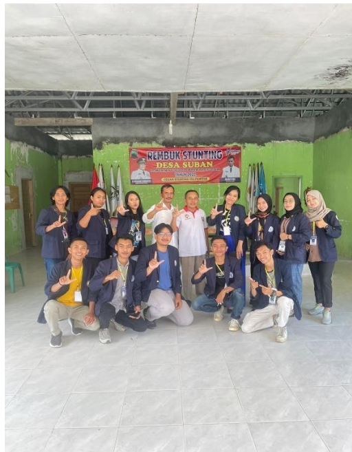
Gambar 2.1 penyambutan mahasiswa dikantor desa

Penyambutan Peserta PKPM di Kantor desa, Kec Merbau mataram, Lampung Selatan,acara penyambutan ini didatangi langsung oleh sekretaris desa dan kadus Desa suban Kec Merbau mataram, dan dihadiri oleh peserta PK