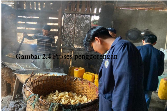
Gambar 2.4 Proses penggorengan