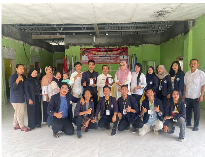
Gambar 2.3.15 Pelepasan mahasiswa dibalai desa suban