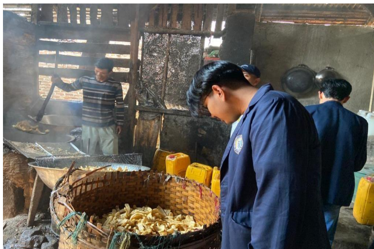
Gambar 2.4 Proses penggorengan