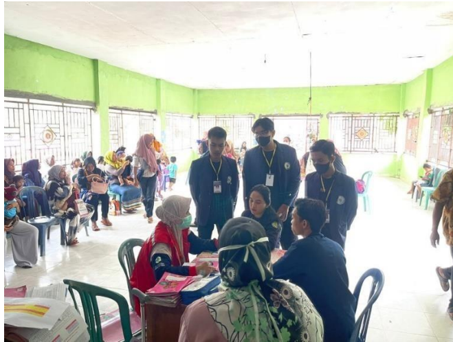
Gambar 2.3.10 Membantu kegiatan posyandu