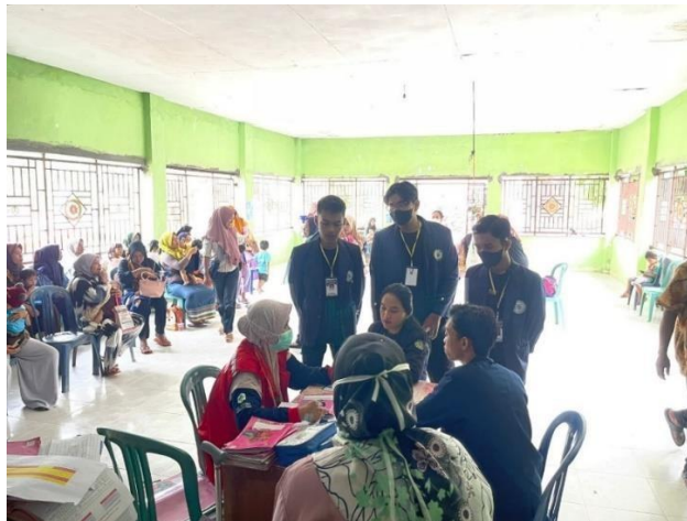
Gambar 2.3.14 kegiatan posyandu