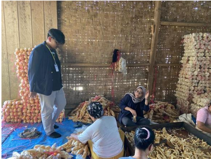
Gambar 2.3.5 Pengemasan kerupuk dua rasa