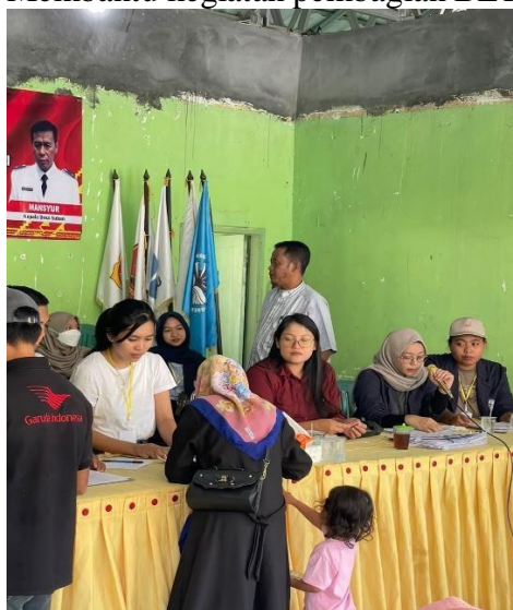
Gambar 2.3.12 Membantu kegiatan pembagian BLT balai desa