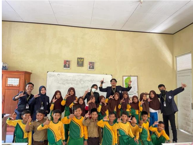
Gambar 2.3.13 kunjungan ke sekolah dasar