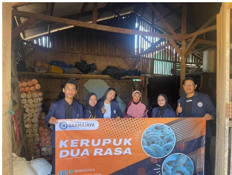
Gambar 2.3.9 Silaturahmi dan pemberian benner kepada UMKM