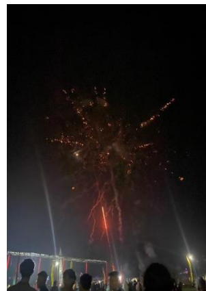
GAMBAR 2. 7 JATI INDAH BERSHOLAWAT