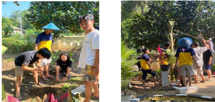
GAMBAR 2. 3 KERJA BAKTI TANAMAN TOGA