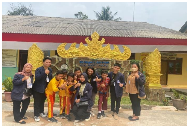
GAMBAR 2. 5 SOSIALISASI DAMPAK PEMBULIAN DAN BAHAYA ROKOK

Proses sosialisasi ini di lakukan minggu ke-3 pelaksanaan PKPM dari hari rabu , kamis dan jumat pada pukul 09.30.-12.00. Kami memberikan sosialisasi tentang dampak pembulian terhadap anak-anak sekolah dasar SD dan tentang bahayanya merokok. Tujuan dari kegiatan sosialisasi ini agar mereka paham dampak positif dan negatif nya agar bisa di terapkan di kemudian hari.