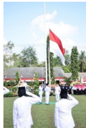
GAMBAR 2. 8 UPACARA HUT-RI KE-77