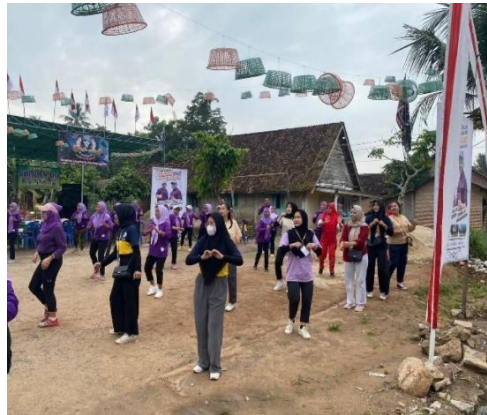
GAMBAR 2. 6 SENAM BERSAMA