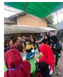
GAMBAR 2. 9 LOMBA BERSAAMA KARANG TARUNA GPS