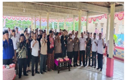
Kegiatan Mengikuti Acara Workshop Kebangsaan Dalam Rangka Menjaga Persatuan dan Kesatuan Demi Keutuhan NKRI