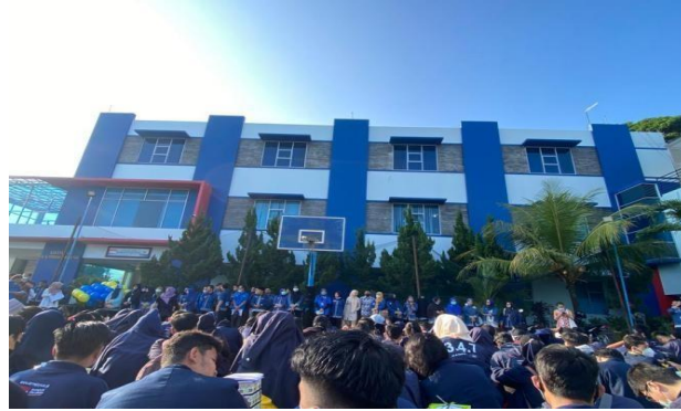
Pemberangkatan Para Peserta PKPM Di Kampus IIB Darmajaya