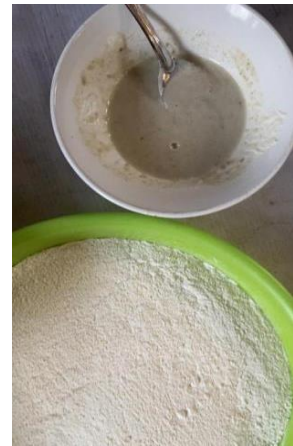
Kegiatan Membuat Jamur Janggel Krispy