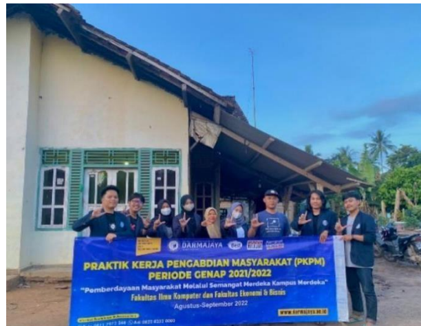
Kegiatan Kunjungan ke UMKM