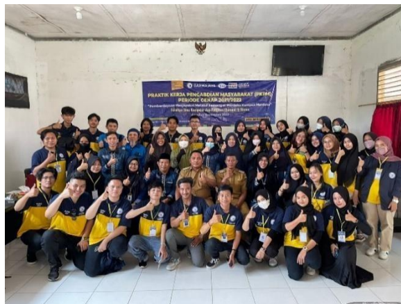
Pelepasan Para Peserta PKPM Di Kecamatan Tanjung Bintang