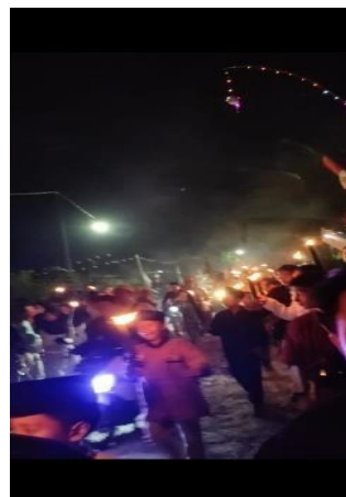
Kegiatan Membawa Obor Acara Jati Indah Bersholawat