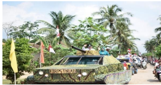
Kegiatan Pawai HUT RI Ke-77