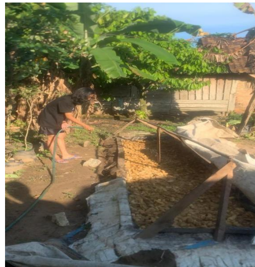
Kegiatan Penyiraman Rutin Jamur Janggal Serta Pengambilan Hasil Panen