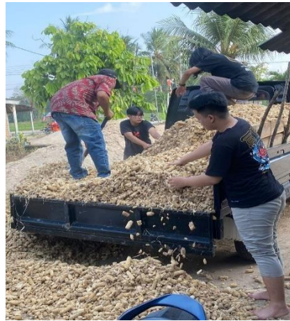
Kegiatan Pengambilan Janggal Jagung