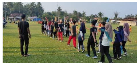
Kegiatan Latihan Paskriba