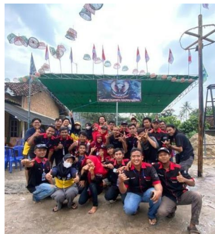
Lomba Bersama Karang Taruna Gerakan Pemuda Sejahtera (GPS)