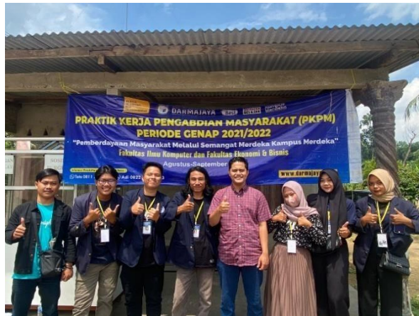
Kegiatan Foto Bersama Dosen Pembimbing Lapangan Di Tempat Tinggal Peserta