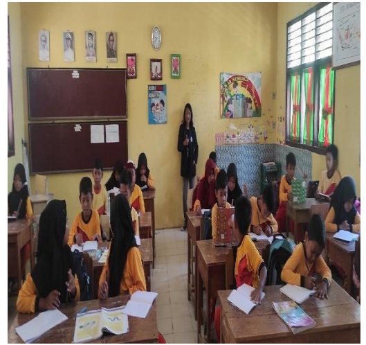
Kegiatan Mengedukasi Siswa-Siswi Tentang Bahaya Rokok dan Dampak Dari Bullying