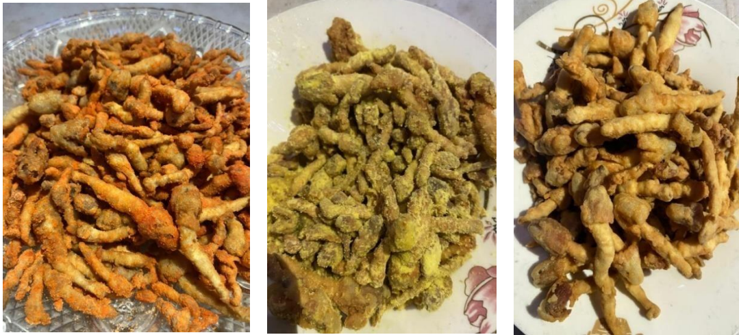
Kegiatan Membuat Jamur Janggel Krispy Dengan Varian Rasa Balado dan Jagung Bakar