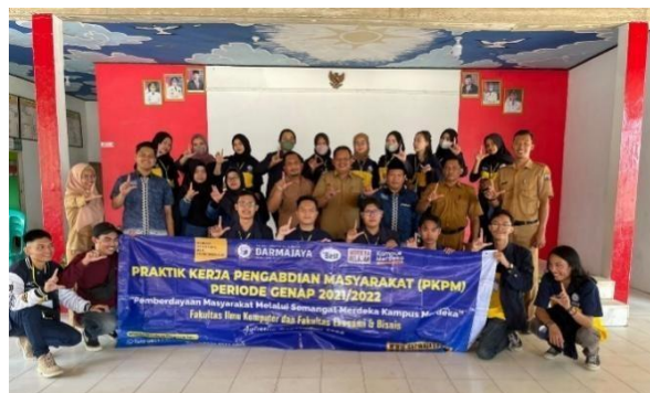
Pelepasan Mahasiswa PKPM Di Desa Jati Indah