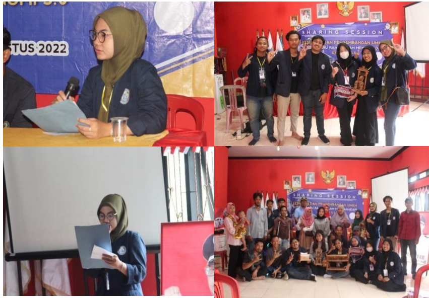
Gambar 2.4 : Sharing session pelaku UMKM desa Baru Ranji