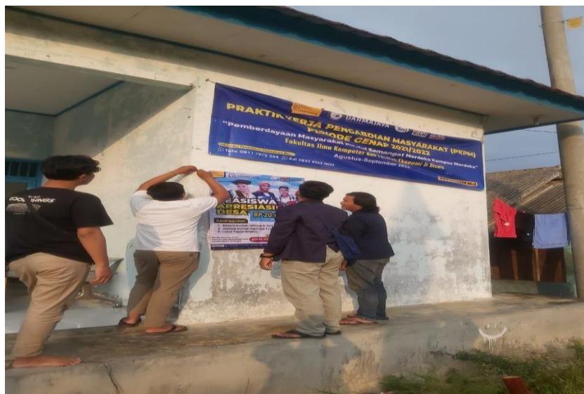
Gambar 2.10 Proses Pemasangan Banner