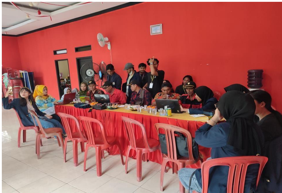
Gambar 2.14 : pelatihan ke aparat desa