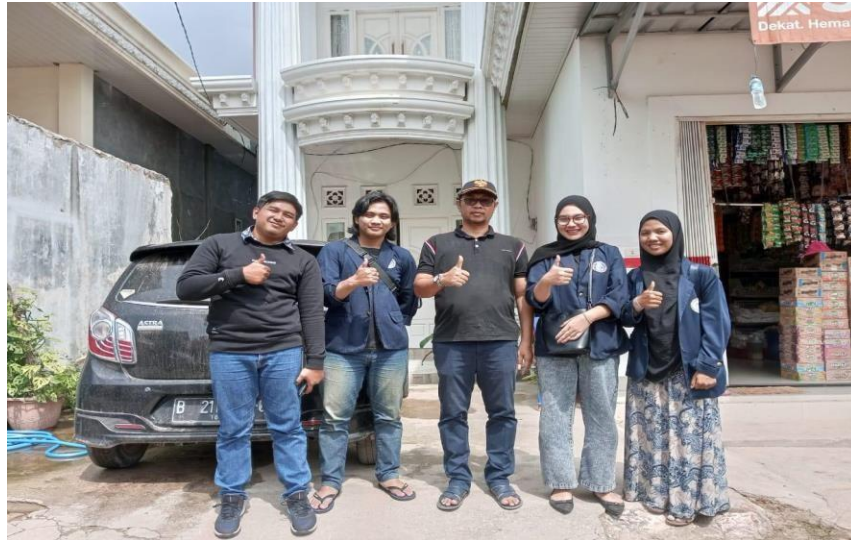
Gambar 2.9 Kunjungan ke desa baru ranji

Berikut gambar dokumentasi yang diambil selama melakukan Praktek Kerja Pengabdian Masyarakat :