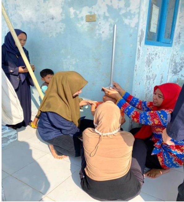
Gambar 2.11 : Pengukuran stunting berat badan dan tinggi badan