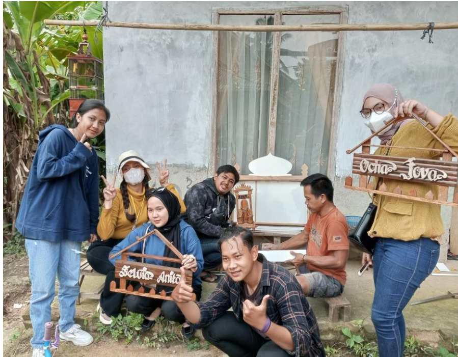
Gambar 2.13 : survei umkm kayu