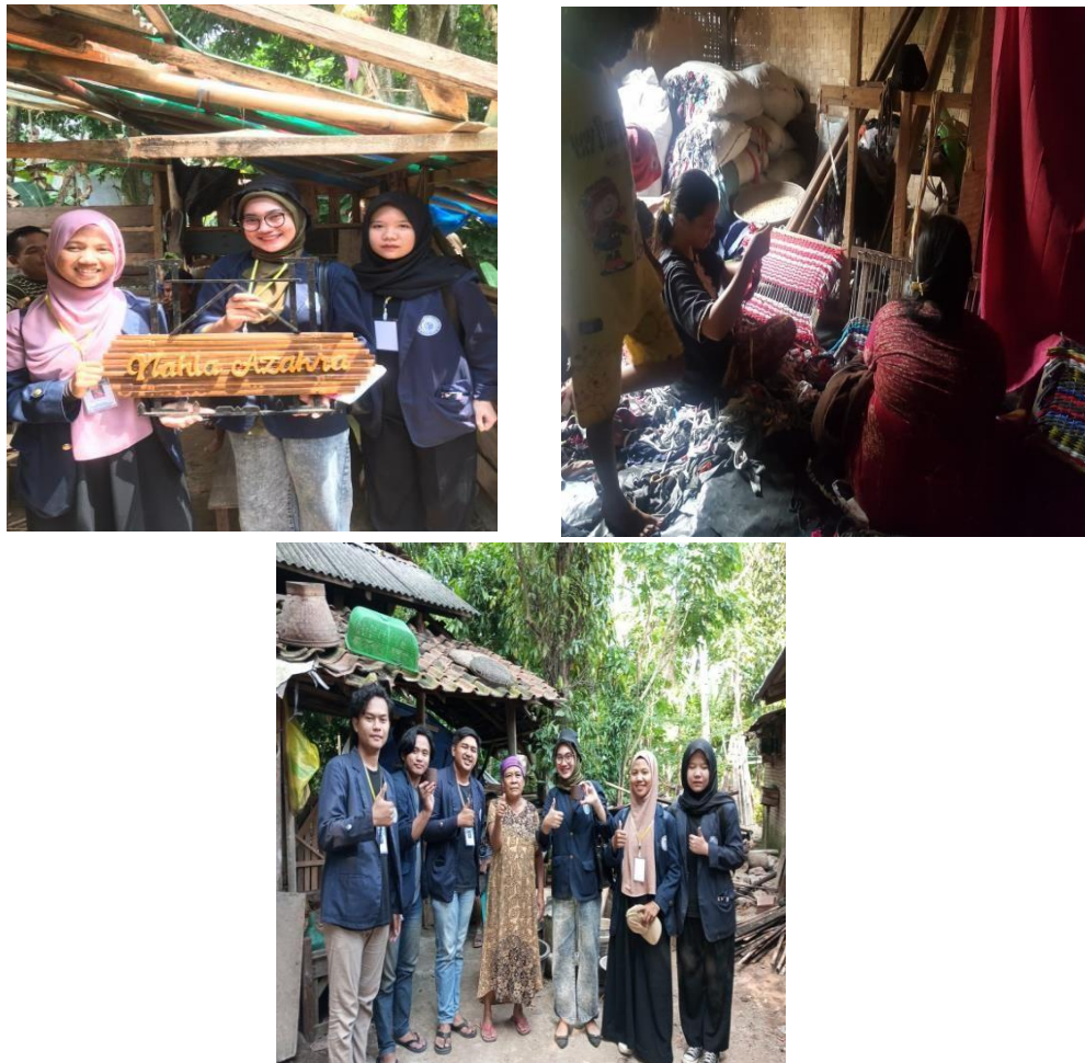
Gambar 2.2 Kunjungan UMKM di Desa Baru Ranji

Kunjungan yang dilakukan ke UMKM desa pada tanggal 24 Agustus 2022 adalah untuk mengetahui apa saja hambatan dalam pemasaran dan pengelolaan UMKM yang ada di Desa Baru Ranji