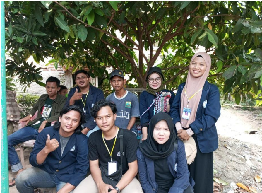
Gambar 2.12: survei UMKM keset