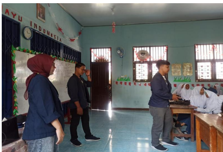
Gambar 2.7 Kunjungan ke smp PGRI

Kunjungan ke SMP PGRI 1 merbau mataram pada tanggal 15 agustus 2022 bersama anggota kelompok untuk sosialisasi tentang pentingnya pendidikan untuk masa depan dan tentang pentingnya teknologi beserta dampak positif dan negatifnya.