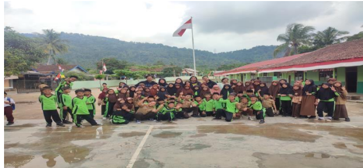
Gambar 2.5 : senam bersama

Senam bersama yang dilakukan pada tanggal 19 agustus 2022 bersama anak anak MTs nurul falah baru ranji yang bertujuan untuk menjaga kesehatan jasmani serta pendekatan penulis dan masyarakat agar saling mengenal.