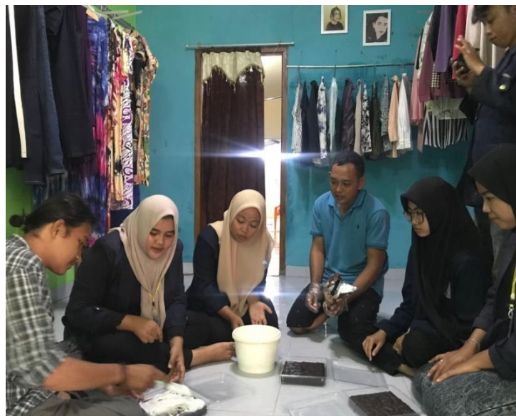
Gambar 2.3 Membantu proses produksi

Kegiatan kali ini bertujuan untuk mengetahui proses pembuatan Kue basah di UMKM Sellena Cake's.