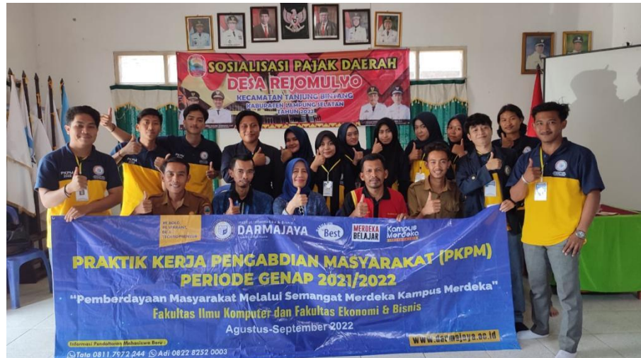
Gambar 2.2 Pengantaran peserta PKPM 2022