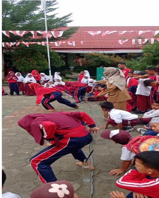
Gambar 2.6 Perlombaan HUT RI

Sehubung diadakannya peringatan Hari Kemerdekaan Republik Indonesia, Kami berpartisipasi menjadi panitia lomba lomba Kemerdekaan.