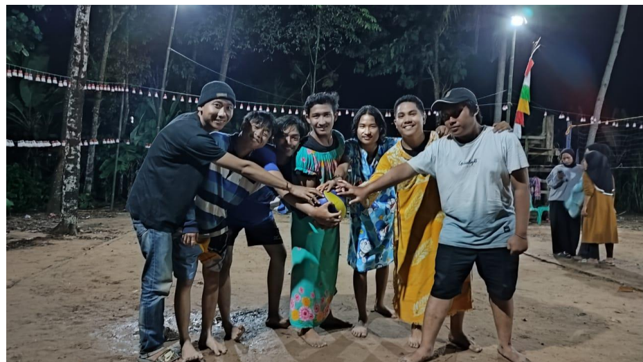
Gambar 2.7 Mengikuti kegiatan perlombaan 17an