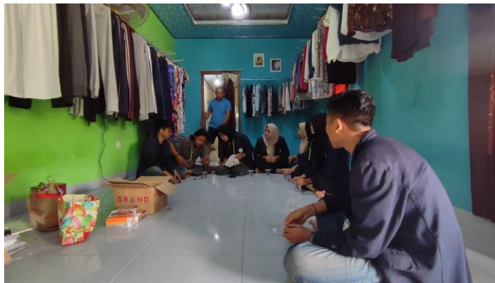
Gambar 2.4 Pembuatan Video Produk UMKM Sellena Cake's

Kegiatan ini bertujuan untuk membantu pengembangan produk sellena Cake's melalui video dan foto-foto produk yang akan di share di Instagram serta mengenalkan cara pemasaran produk melalui Media Sosial.