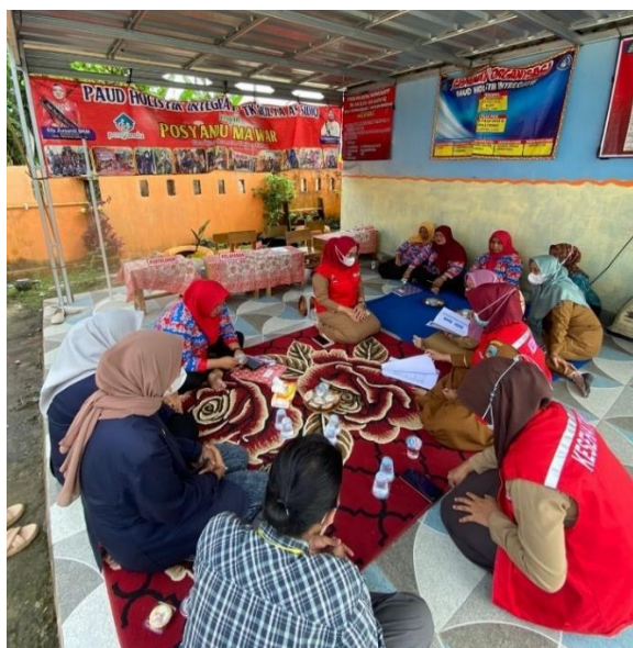
Gambar 2.9 Kegiatan Posyandu dalam Pencegahan Stunting

Kegiatan ini dilakukan untuk mengetahui tumbuh kembang balita yang terdapat pada desa Rejomulyo dan mencegah terjadinya stunting pada balita.