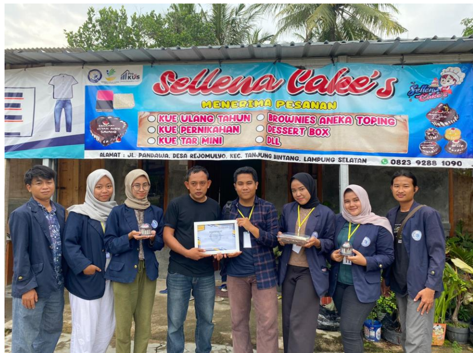
Gambar 2.11 Pemberian Cindramata Kepada pemilik UMKM