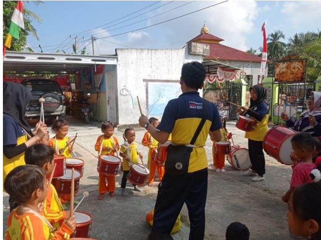
Gambar 2.8 Mengajarkan drum band

Tujuan pembearan drum band adalah agar siswa dapat memiliki kemampuan dan minat serta bakatnya di masa yang akan datang. Dengan cara ini mereka dapat mengembangkan kemampuan belajar dan bekerja secara optimal.