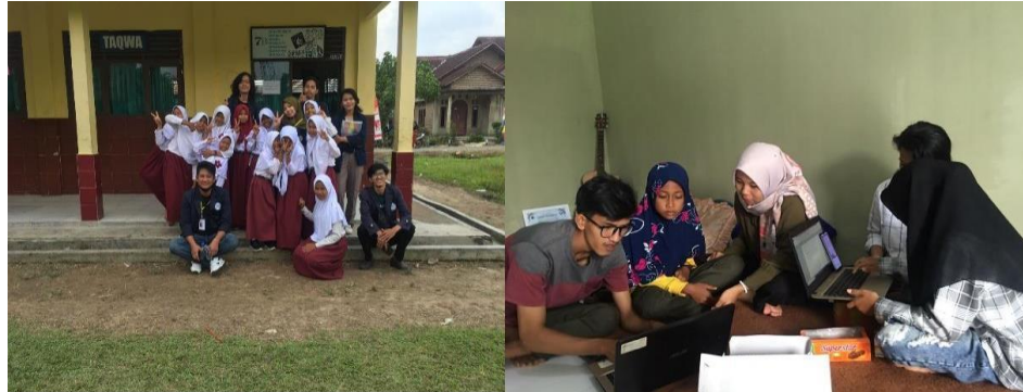
Gambar 2.5 Pelatihan IT

Memberikan Pelatihan IT pada anak Perkembangan teknologi sangat memberikan pengaruh besar terhadap perkembangan anak, terutama anak usia dini. Sedari dini, anak harus mengenal teknologi agar boleh memahami dan tidak tertinggal mengenai penggunaan teknologi. Dampak dari pelatihan teknologi terhadap anak- anak, diantaranya yaitu :