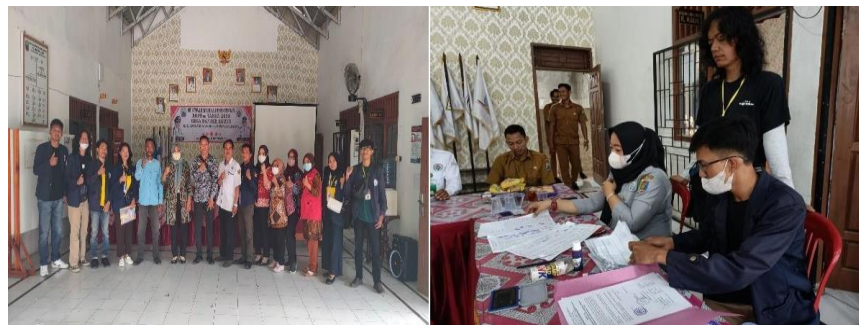
Gambar 2.3 Rembug stunting dan sosialisasi RKPDes

Stunting adalah masalah gizi kronis akibat kurangnya asupan gizi dalam jangka waktu panjang sehingga mengakibatkan terganggunya pertumbuhan pada anak. Stunting juga menjadi salah satu penyebab tinggi badan anak terhambat, sehingga lebih rendah dibandingkan anak-anak seusianya. Dan juga pada acara RKPDes dijelaskan bahwa rancangan RKP Desa memuat rencana penyelenggaraan Pemerintahan Desa, pelaksanaan pembangunan, pembinaan kemasyarakatan, dan pemberdayaan Masyarakat Desa.