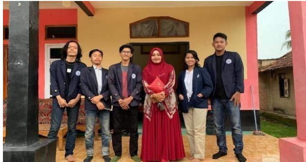
Gambar 2.1 Survei Lokasi

Mencari tempat untuk kegiatan PKPM di Banjar Agung, Lampung Selatan yang sesuai dengan UMKM yang diarahkan kampus dengan tema yakni “Pemberdayaan Masyarakat Melalui Semangat Merdeka Kampus Merdeka”.