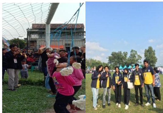
Gambar 2.4 Perayaan HUT RI