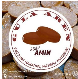
Pembuatan Instagram untuk produk gula aren