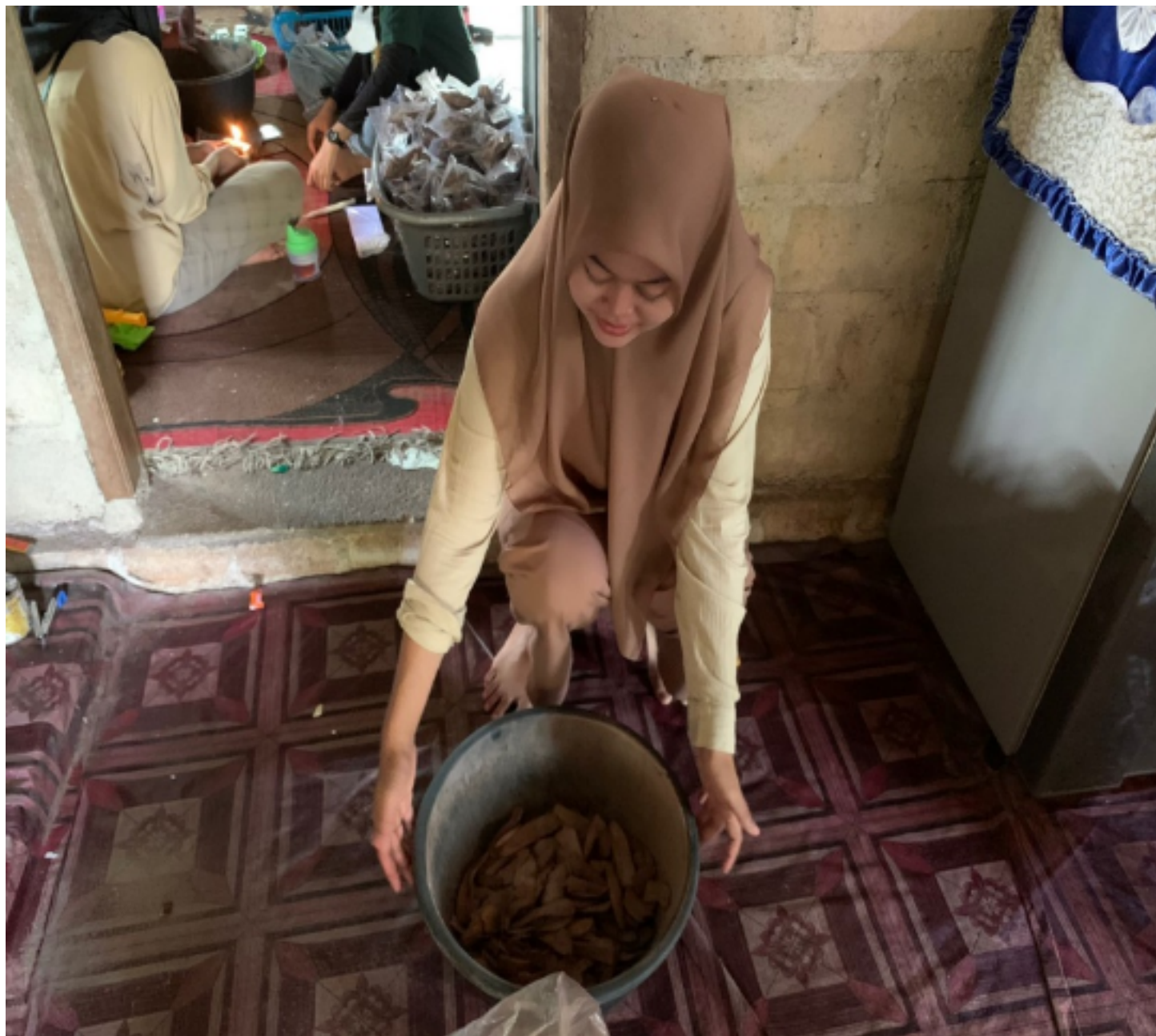
Gambar 2.3 proses pembumbuan keripik pisang