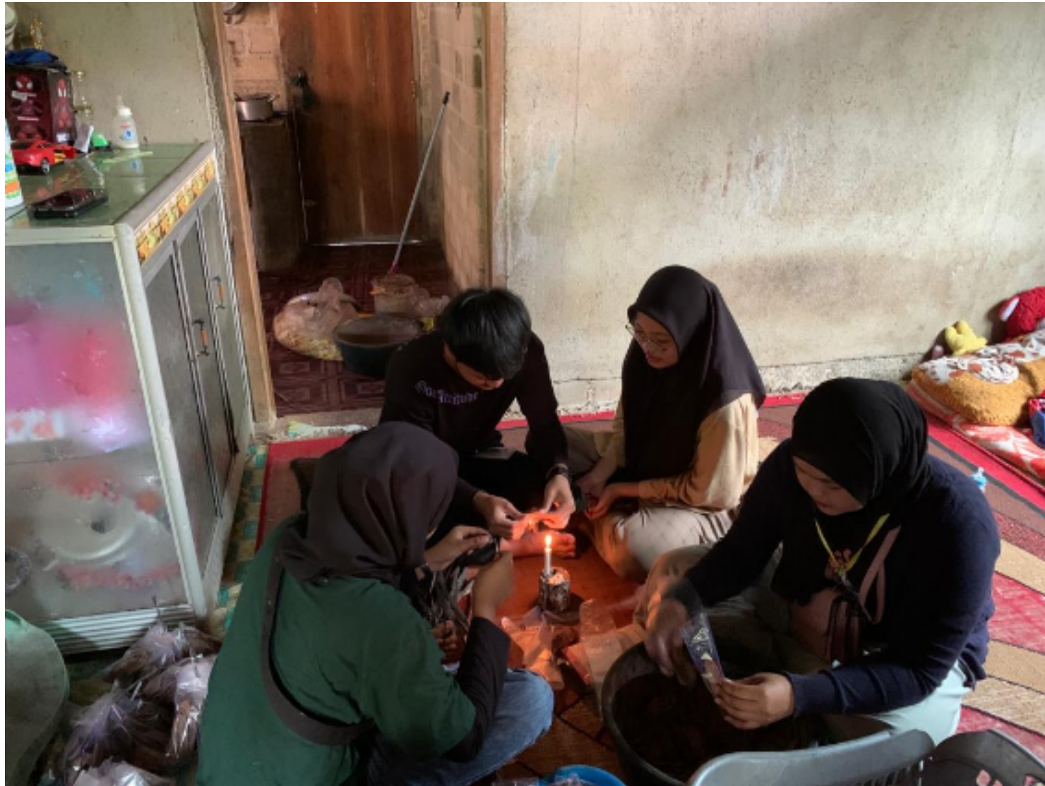
Gambar 2.2 Proses Pembuatan Keripik di UMKM