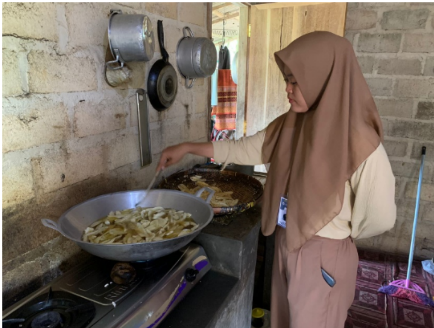
Gambar 2.4 proses penggorengan keripik pisang