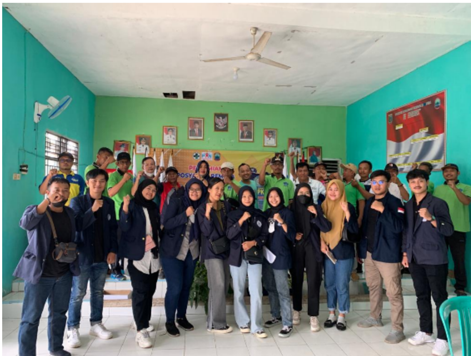
Gambar 2.1 Survei di Desa Purwodadi Simpang

Agar selama PKPM berlangsung berjalan dengan baik kami mengunjungi Balai desa Purwodadi Simpang yang terletak di JCR8+C5P, Purwodadi Simpang, Kec. Tj. Bintang, Kabupaten Lampung Selatan, Lampung dan menyerahkan surat izin pelaksanaan PKPM dan meminta arahan dan dukungan.