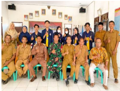
Gambar 2.5 Bertemu dengan Aparatur Desa Margo Mulyo

Dalam kegiatan kali ini kami berkesempatan bertemu dengan para aparatur desa Margo Mulyo. Yang mana dalam pertemuan ini di adakan sesi tanya jawab terkait dengan Desa Margo Mulyo serta sesi perkenalan dari kami para mahasiswa serta mahasiswa KKN IIB Darmajaya dengan para aparatur Desa Margo Mulyo.