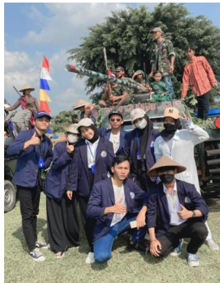
Gambar 2.9 Berpartisipasi dalam acara 17 Agustus di Margo Mulyo