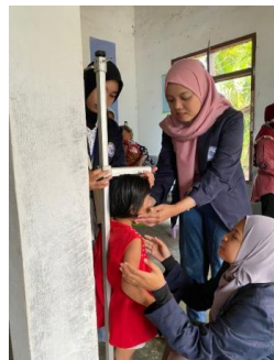
Gambar 2.6 Membantu Kegiatan Posyandu Anggrek di Dusun 3

Program ini dimana kami membantu serta para bidan serta ibu – ibu untuk mengukur tinggi serta berat badan dari para bayi maupun balita yang ada di dusun 2 dan 3 Desa Margo Mulyo.