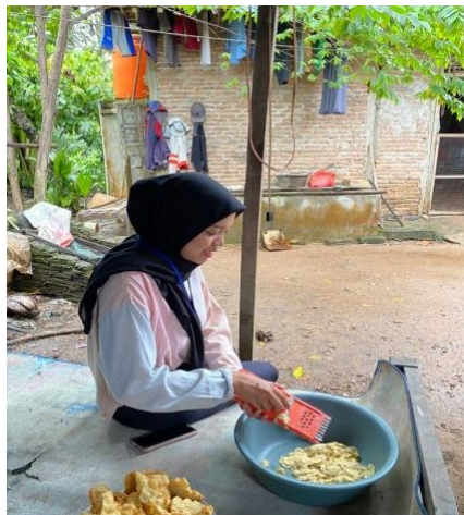
Gambar 2.15 Melakukan proses pembuatan salai pisang