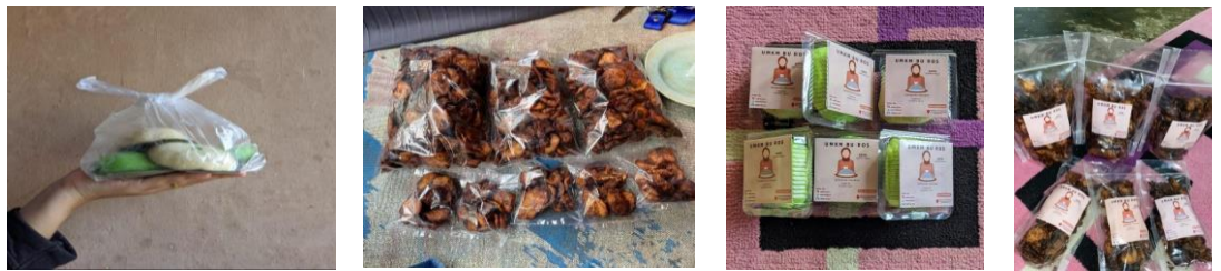
Gambar 2.2 Melakukan Inovasi pada kemasan di UMKM

Dengan adanya kemasan menjadikan produk makanan yang dijualakan menjadi lebih terjamin kualitasnya untuk dikonsumsi.