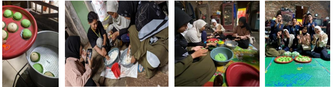
Gambar 2. 1 Melakukan Proses Pembuatan Kue Bakpao