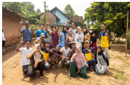
Gambar 2.11 Menjadi panitia dalam HUT RI ke-77 di Dusun 3

Dalam kegiatan kali ini kami di minta oleh salah satu aparaturnya dari dusun 3 untuk bergabung membantu serta menjadi panitia dalam acara 17 agutusan untuk memerikan Hut RI ke – 77 di Dusun 3.