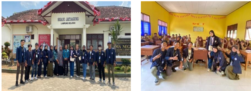
Gambar 2.7 Melakukan Motivasi Belajar pada SMA Negeri 1 Jati Agung

Dalam kegiatan ini kita memberikan materi terkait Motivasi Belajar pada murid-murid di SMA Negeri 1 Jati Agung guna meningkatkan semangat belajar mereka.