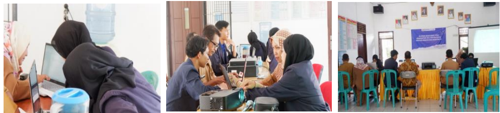
Gambar 2.16 Mengadakan pelatihan Ms. Word kepada Aparatur Desa

Kami melakukan kegiatan pelatihan ms. word kepada aparatur Desa Margo Mulyo yang mana alasan kami untuk melakukan kegiatan pelatihan tersebut didasarkan dari pengamatan yang telah kami lihat bahwasanya banyak dari aparatur Desa di Margo Mulyo yang masih belum terbiasa menggunakan perangkat komputer yang mana hal itu tidak terlepas dari tingkat pendidikan yang mereka tempuh, karena itu kami mengadakan pelatihan terkait dasar penggunaan ms. word kepada para aparatur Desa Margo Mulyo yang mana diharapkan melalui pelatihan tersebut dapat meningkatkan standar dan kualitas dari para aparatur Desa Margo Mulyo.