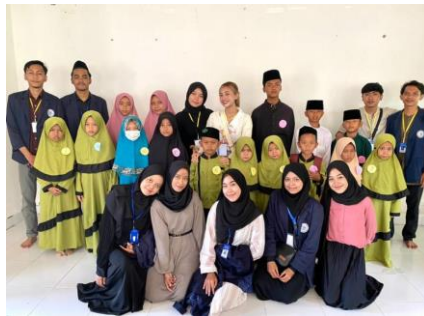
Gambar 2.8 Berpartisipasi panitia & juri lomba keagamaan Pesantren

Dalam program ini kami ikut serta dan menjadi panitia serta juri dalam acara lomba ke agama di Pondok Pesantren Muhammad Natsir. Dimana para panitia dari Desa Margo Mulyo sendiri merasa sangat senang dan terbantu.