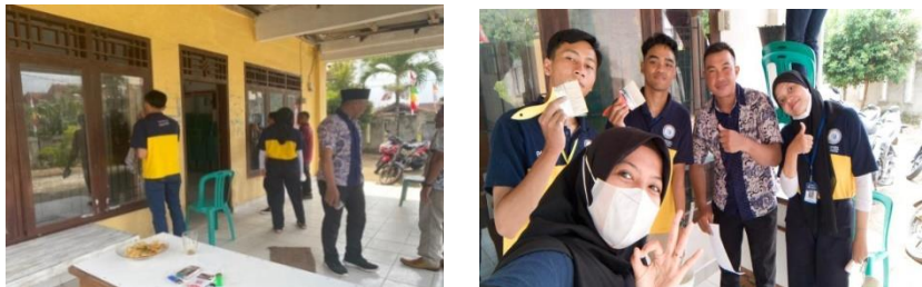
Gambar 2.13 Melakukan kegiatan jumat bersih di Balai Desa

Program ini merupakan program yang memiliki tujuan untuk menjaga kebersihan Balai Desa serta meningkatkan rasa kekeluargaan maupun gotong royong antar sesama Aparatur Desa Margo Mulyo. Adapun hasil dari kegiatan ini adalah Aparatur Desa Margo Mulyo menjadi rutin melakukan kegiatan pembersihan Balai Desa.