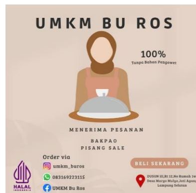
Gambar 2. 4 Desain Merk dari UMKM Bu Ros

Merk ini digunakan untuk membedakan produk Kue Bakpao dengan produk pesaingnya. Merk merupakan salah satu tahapan penting dalam proses pengembangan pangsa pasar produksi Bakpao, karena Merk merupakan identitas dari usaha tersebut. Dengan adanya warna kemasan untuk mempresentasikan rasa atau penyajian dari makanan tersebut, Untuk mendapatkan nilai tambah untuk memberikan keuntungan kepada para konsumen. Salah satu usaha yang dapat ditempuh untuk menghadapinya adalah melalui desain produk. Daya tarik suatu produk tidak dapat terlepas dari kemasannya karena kemasan merupakan pemicu utama yang langsung berhadapan dengan konsumen. Oleh karena itu, kemasan harus dapat memengaruhi konsumen untuk memberikan respon yang positif, yaitu membeli produk. Desain kemasan produk memang memegang pengaruh yang cukup penting dalam upaya menarik minat pembeli dan meningkatkan penjualan suatu produk.