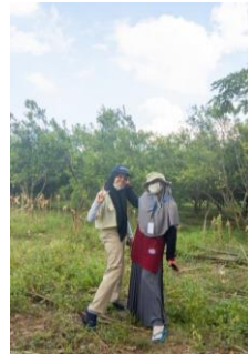
Gambar 2.10 Melakukan Kunjungan ke salah satu Potensi Pariwisata Kebun Jeruk di Desa Margo Mulyo

Dalam kegiatan kali ini kami melakukan kunjungan ke salah satu potensi pariwisata di Desa Margo Mulyo yaitu Kebun Jeruk, yang mana saat ini sendiri potensi pariwisata Kebun Jeruk ini di tutup sementara, karena sempat terjadi covid-19 yang membuat kebun jeruk ini menjadi tidak terurus, dan menurut informasi yang kami dapatkan dari warga setempat bahwa potensi pariwisata Kebun Jeruk ini, sedang di upayakan agar bisa hidup kembali.