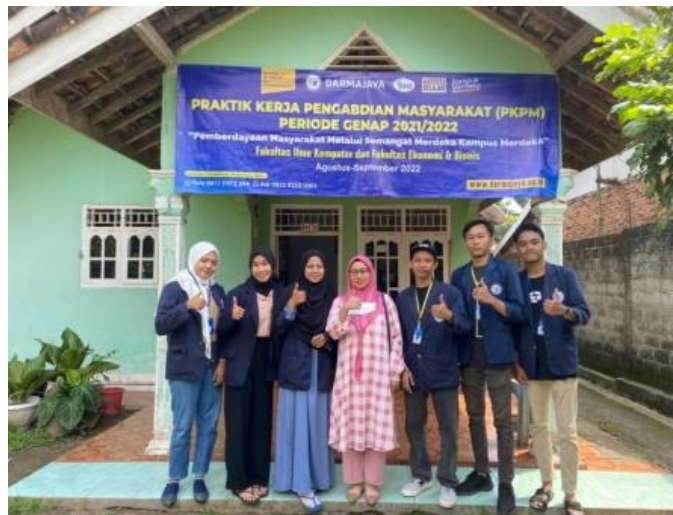
Gambar 2.14 Kunjungan DPL ke lokasi PKPM