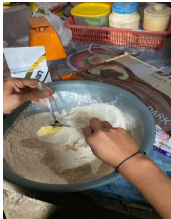
Proses Pencampuran Bahan Bakpao