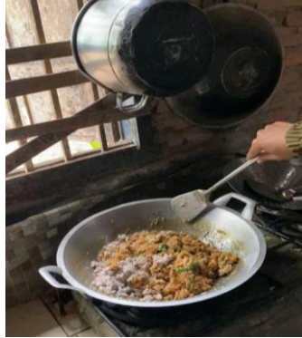
Proses Pembuatan Isian Kue Bakpao