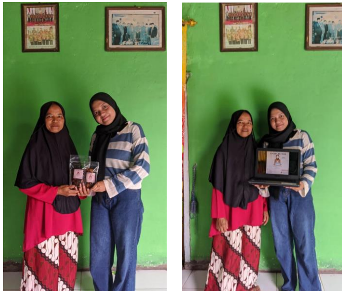
Melakukan Penyerahan terkait dengan Invoasi terhadap Kemasan (Branding)