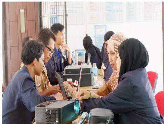
Pelatihan Dasar Penggunaan Ms. Word kepada Aparatur Desa Margo Mulyo