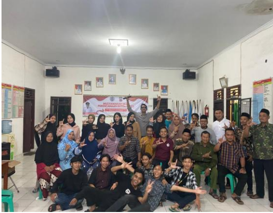
Pemberian plakat dan acara perpisahan dengan des