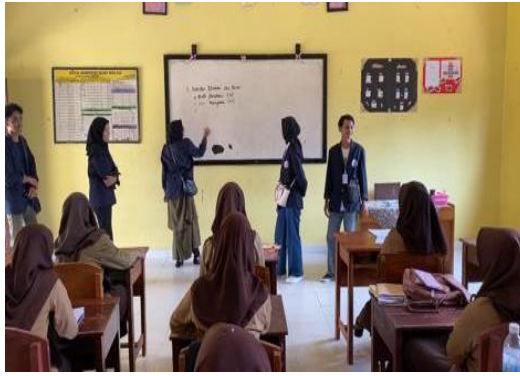
Penyampaian Materi Motivasi Belajar