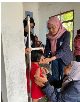
Membantu Posyandu Mengukur Tinggi Badan Anak