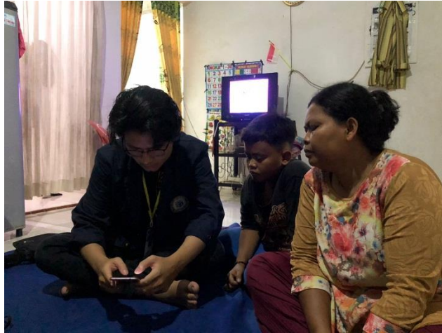
Gambar 2.4 Pelatihan Penentuan Harga Pokok Penjualan

Harga pokok penjualan dalam Bahasa Inggris dikenal dengan istilah cost of goods manufactured . Tujuan perhitungannya ialah untuk mengukur perhitungan biaya yang dikeluarkan selama proses produksi, menentukan harga jual yang tepat, dan untuk mengendalikan biaya pembelian serta tenaga kerja.