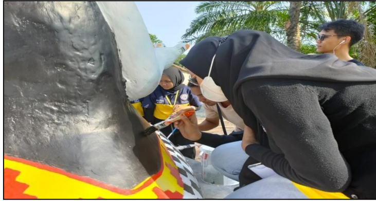
Gambar: 2.4 Membantu Pembuatan Maskot Karnaval Desa