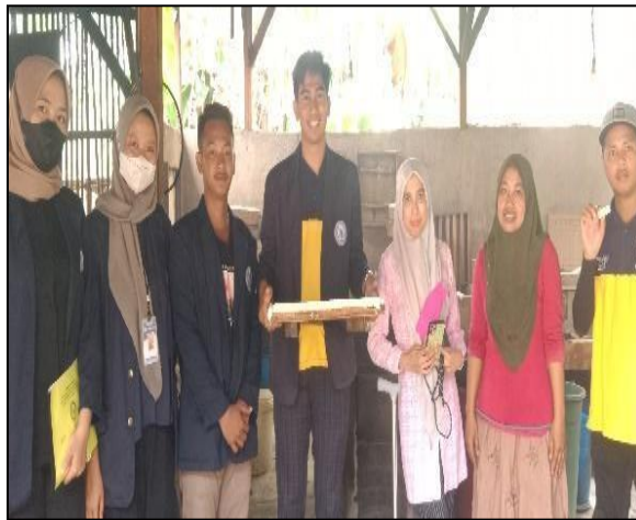
Gambar : 2.6 Kunjungan UMKM Tahu di Desa Talang Jawa

Usaha Mikro Kecil Menengah (UMKM) adalah istilah umum dalam dunia ekonomi yang merujuk kepada usaha ekonomi produktif yang dimiliki perorangan maupun badan usaha sesuai dengan kriteria yang ditetapkan oleh Undang-Undang No.20 Tahun 2008. Selain itu UMKM adalah usaha produktif yang dimiliki perorangan maupun badan usaha yang telah memenuhi kriteria sebagai usaha mikro. di Desa Talang Jawa salah satu UMKM yang ada yaitu UMKM Tahu.