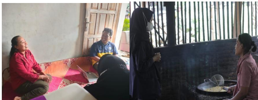
Gambar: 2.2 Pemberian sosialisasi pada UMKM tahu

Menurut Robbins (2016) terdapat empat tipe kepemimpinan yaitu kharismatik, transaksional, transformasional dan visioner. Kepemimpinan kharismatik merupakan kepemimpinan yang menunjukkan sikap pemimpin yang percaya diri, kepemimpinan transaksional merupakan kepemimpinan yang memberikan imbalan kepada karyawan yang berprestasi, kepemimpinan transformasional merupakan kepemimpinan yang memberikan motivasi dan inspirasi kepada karyawan, dan kepemimpinan visioner merupakan kepemimpinan yang berfokus pada visi dan misi organisasi.