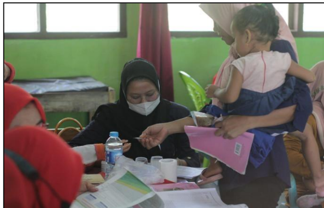
Gambar: 2.5 Membantu Kegiatan Posyandu

Posyandu adalah jenis pelayanan kepada anak berupa penimbangan untuk memantau pertumbuhan anak. Manfaat dari kegiatan posyandu adalah memberikan layanan Kesehatan ibu dan anak, KB, Imunisasi, Gizi, dan Penanggulangan diare. Adapun tujuan dari kegiatan Posyandu adalah untuk menurunkan angka kematian bayi (AKB), angka kematian ibu (Ibu Hamil), melahirkan dan nifas. Seperti yang dilakukan pada Desa Talang Jawa Kecamatan Merbau Mataram, Lampung Selatan yang rutin melakukan kegiatan posyandu pada tanggal 18 Agustus 2022.