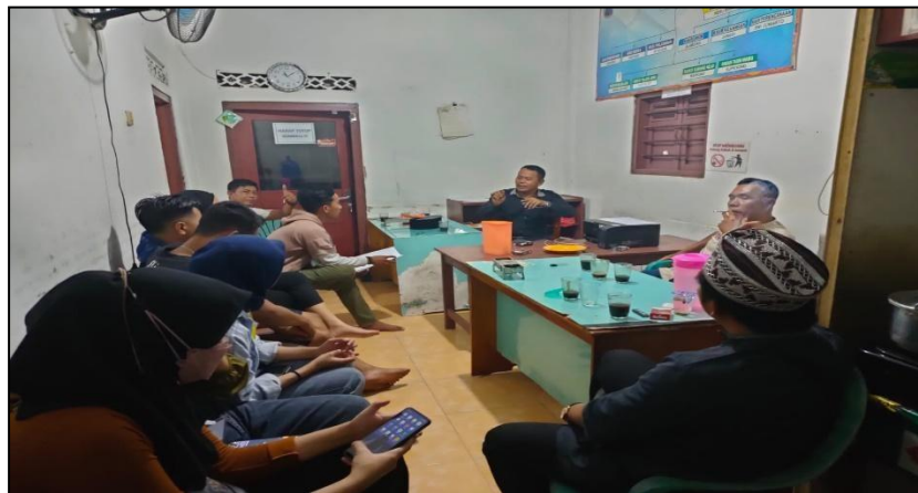
Gambar: 2.3 Rapat Persiapan Perayaan HUTRI ke 77

Dalam menyambut Hari Kemerdekaan Republik Indonesia (HUTRI) Sebagian besar masyarakat diseluruh Indonesia menyambutnya dengan semarak dan semangat. Salah satu bentuknya yaitu dengan mengadakan rapat sebelum menyongsong kegiatan 17 agustus yang diadakan dibalai Desa.