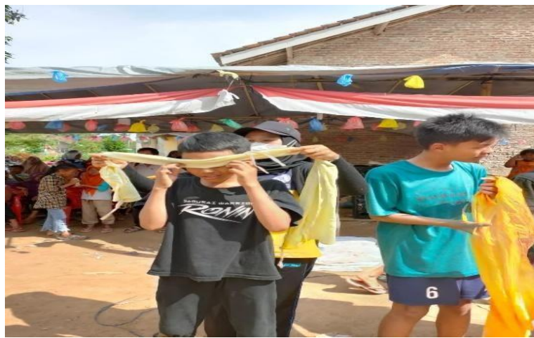
Gambar: 2.8 Lomba 17 Agustus

Dalam menyambut Hari Kemerdekaan Republik Indonesia (HUTRI) Sebagian besar masyarakat diseluruh Indonesia menyambutnya dengan semarak dan semangat dengan memberikan beberapa perlombaan yang dapat diikuti oleh masyarakat tempat tinggalnya. Salah satunya Desa Talang Jawa dengan mengadakan lomba Balap Karung. Kegiatan ini dilaksanakan dan diikuti oleh anak-anak.