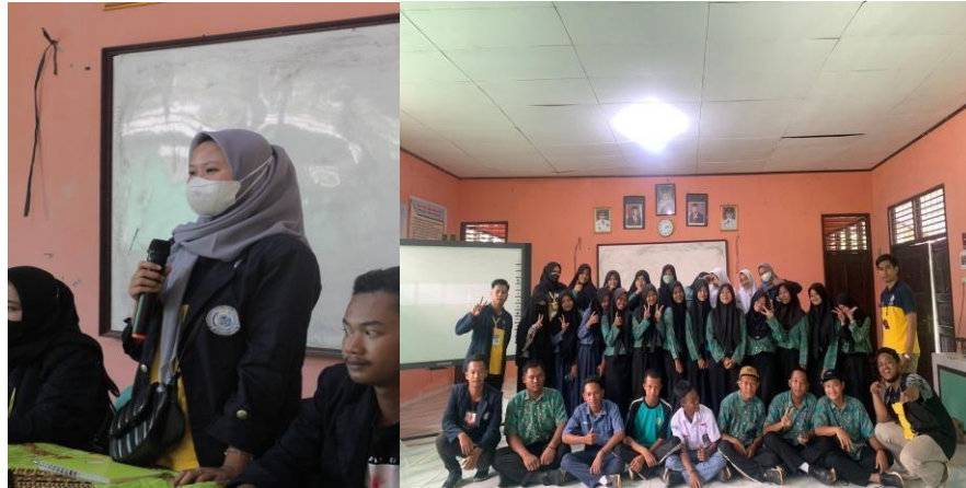
Gambar: 2.1 Pembekalan materi Di Sekolah SMAN1 Merbau Mataram

Salah satu tujuan dalam PKPM adalah memberikan Pendidikan, yang dimana kali ini kami memberikan pembekalan materi kepada siswa- siswi yang ada di SMAN 01 Merbau Mataram, yang berlokasi di Jl. Batin Putra No.41, Talang Jawa, Kec. Merbau Mataram, Kabupaten Lampung Selatan, Lampung 35357. Materi yang kami berikan tentang “Kepemimpinan Dan Manajemen Organisasi Di Sekolah”, yang dimana dibutuhkan oleh murid di SMA tersebut karena kurangnya manajemen keorganisasian.