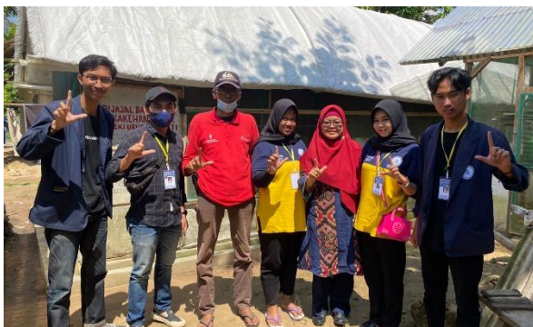
Foto Bersama Dosen Pembimbing Lapangan dan Pemilik UMKM Maggot