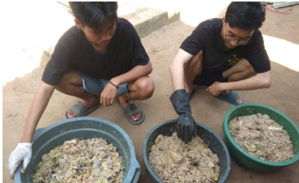
Cara Pengolahan Organik Sampah Untuk Pakan Maggot