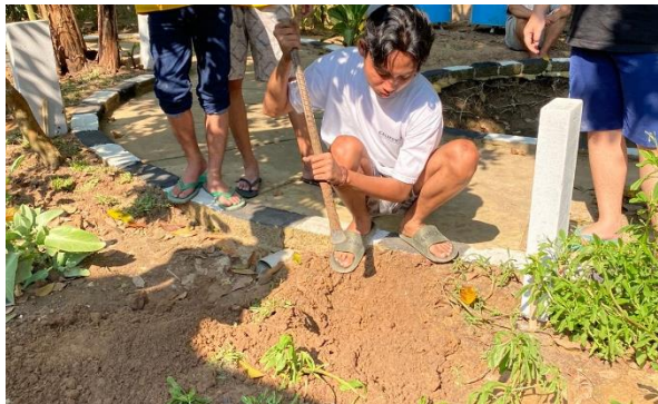
Persiapan Lomba Toga