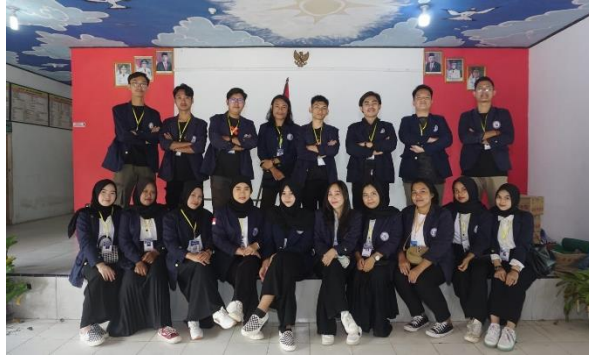
Foto Bersama Setelah Kegiatan Di Balai Desa