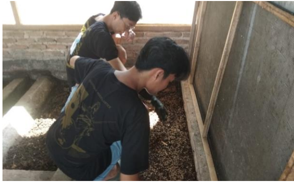
Pemberian Makan Pada Maggot