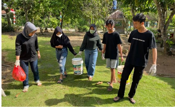
Pengambilan Sampah Sebagai Pakan Maggot