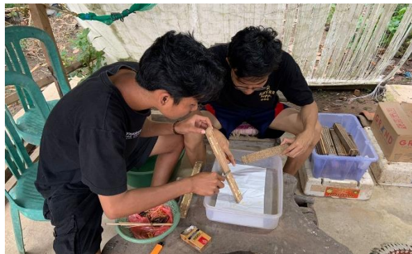
Pengikisan Telur Lalat BSF