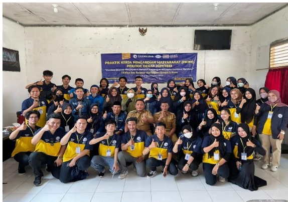
Pelepasan Mahasiswa PKPM Di Kecamatan Tanjung Bintang