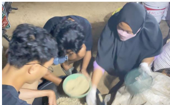
Penyiapan Media Penetasan Telur Lalat BSF