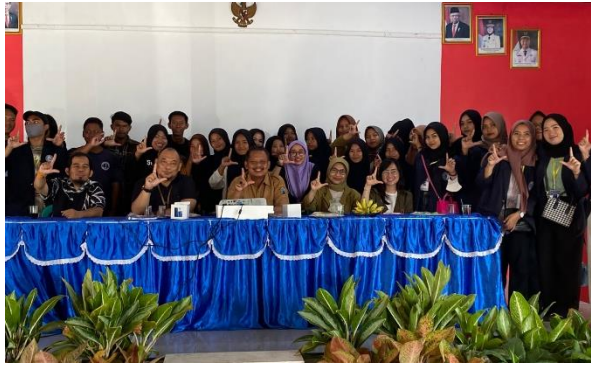
Kegiatan Workshop Kominfo