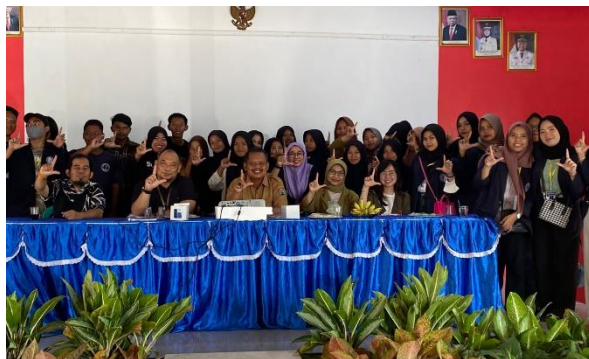
Kegiatan Workshop Kominfo