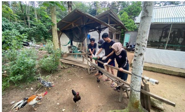
Pengaplikasian Maggot Sebagai Pakan Ternak Ayam