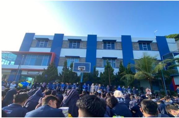
Pelepasan Mahasiswa PKPM di Kampus Darmajaya