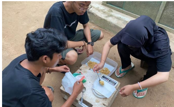
Penimbangan Telur Lalat BSF