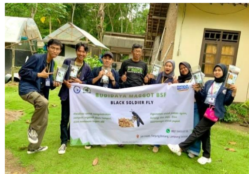
Foto Bersama Pemilik UMKM MAGGOT BSF STBM Sekaligus Pamitan Mengakhiri Kegiatan PKPM Di Desa Jati Indah