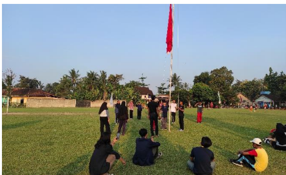
Pelatihan Paskibraka Di Lapangan Desa Jati Indah