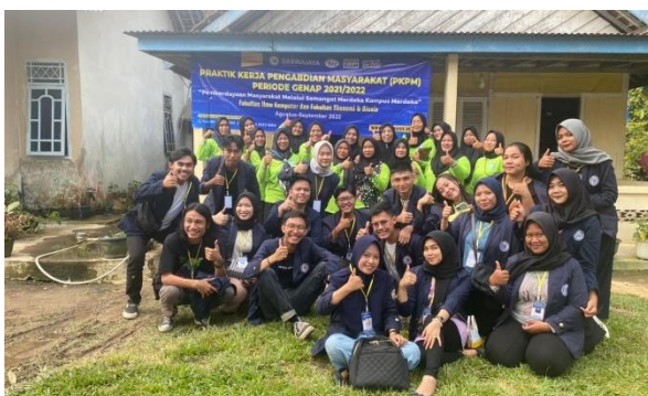
Foto Bersama Ibu-Ibu PKK Setelah Lomba TOGA