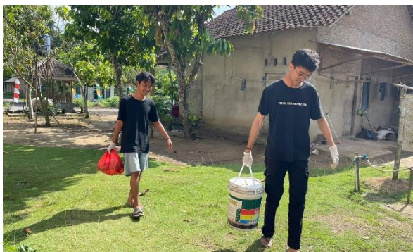
Pengambilan Sampah Yang Nantinya Menjadi Pakan Maggot