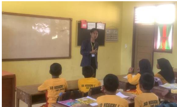
Sosialisai Bullying Dan Dampak Penggunaan Gadget Di Kelas 5 SDN 1 Jati Indah