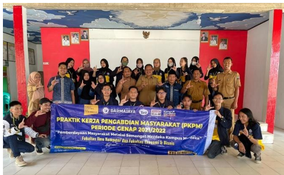
Pelepasan Mahasiswa Di Balai Desa Jati Indah