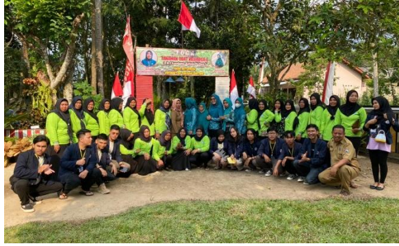
Kegiatan Lomba Ibu-Ibu PKK TOGA