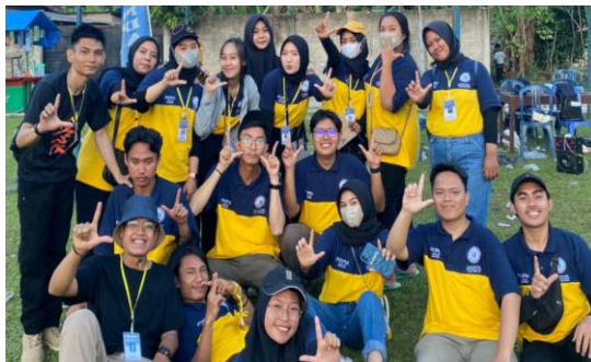
Pengadaan Lomba 17 Agustus oleh Mahasiswa PKPM