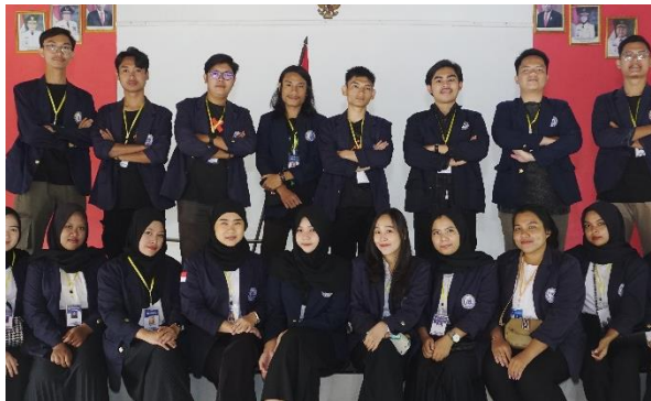
Dokumentasi Pertama Kali Di Desa