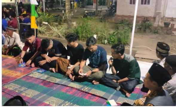
Yasinan Selamatan Gerhana Bulan