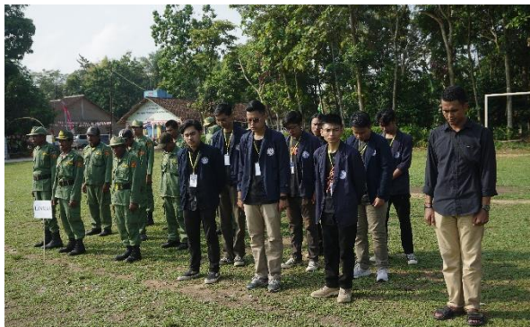
Mengikuti Upacara HUT-KE77