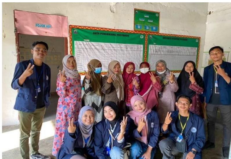
Gambar 1.6 Kegiatan Posyandu

Membantu kegiatan Posyandu Balita di Posyandu Anggrek mulai dari menimbang berat badan, mengukur tinggi badan dan lingkar kepala, dan pemberian Vitamin A.