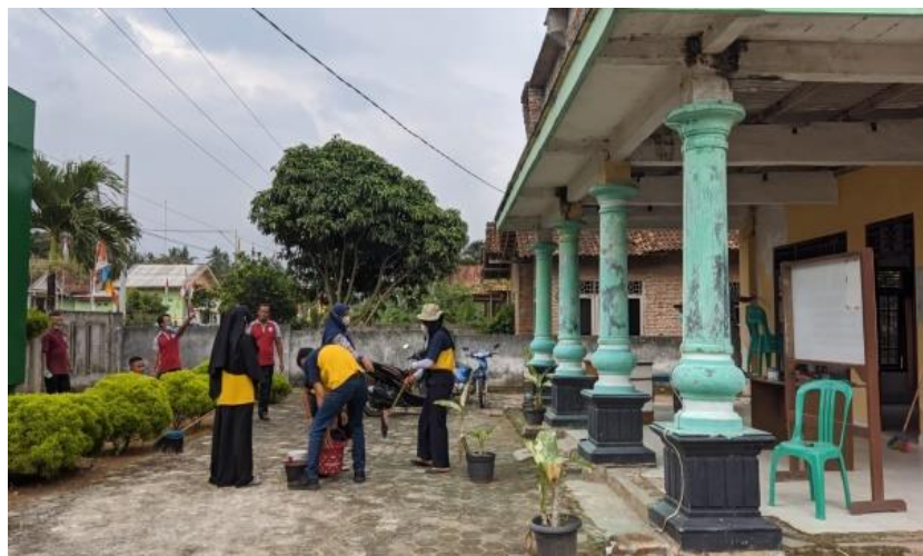
Gambar 1.12 Jumat Bersih

Melaksanakan kegiatan jum'at bersih di balai desa Margo Mulyo demi menjaga kebersihan lingkungan sekitar balai desa serta meningkatkan rasa gotong royong sesama Aparatur Desa.