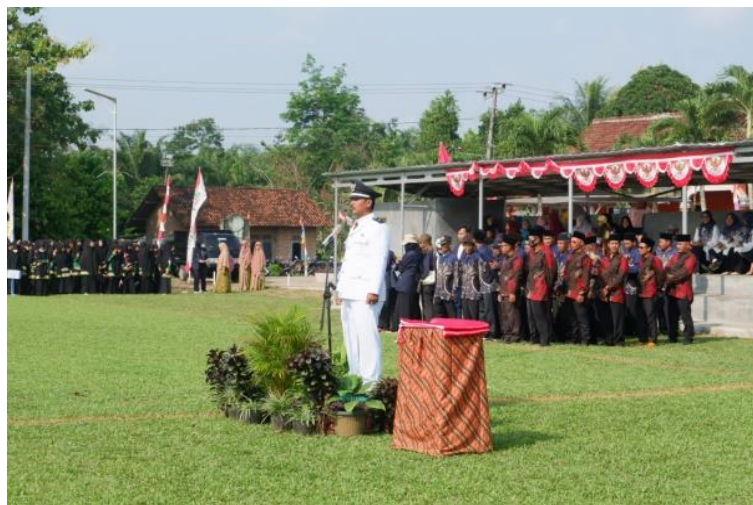
Gambar 1.10 Mengikuti Upacara

Menjadi peserta upacara dalam rangka memperingati Hut RI ke 77 di lapangan desa Margo Mulyo serta berpartisipasi sebagai panitia dalam acara lomba.