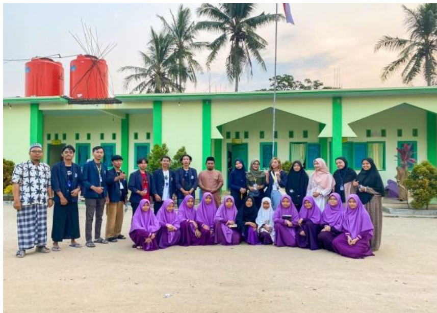
Gambar 1.4 Silaturahmi Ke Ponpes Muhammad Natsir

Mengunjungi salah satu pondok pesantren di desa Margo Mulyo guna menjalin tali silaturahmi.