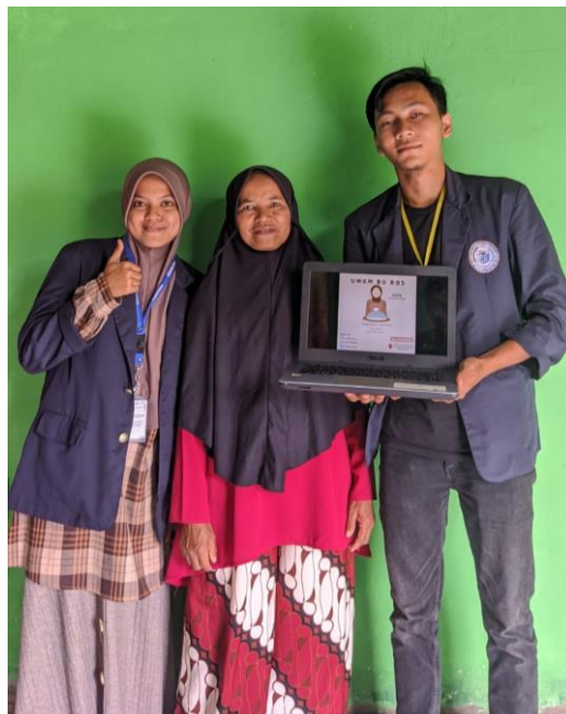
Gambar 1.21 Inovasi Kemasan

Inovasi yang diberikan berupa desain logo UMKM serta inovasi kemasan yang pertama menggunakan kantong plastik untuk kemasan Bakpao dan Salai Pisang digantikan dengan Standing Pouch serta diberikan label kemasan guna meningkatkan daya tarik pembeli.