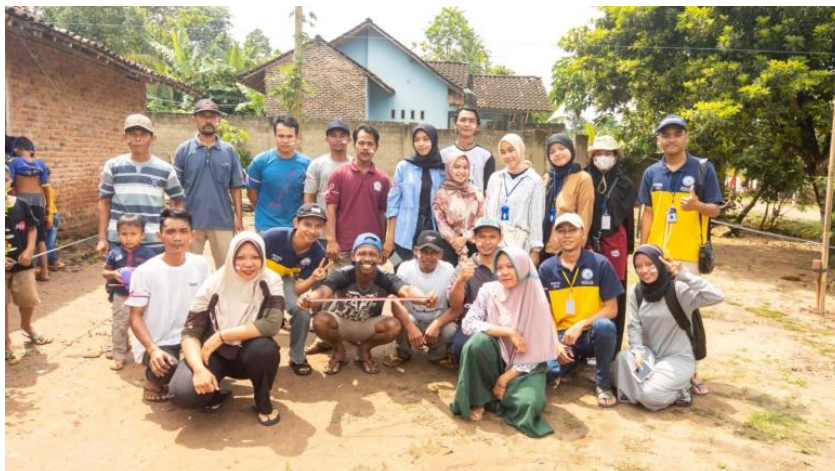
Gambar 1.14 Membantu Kegiatan Lomba HUT RI Di Dusun III

Membantu kegiatan perlombaan di Dusun III dalam rangka HUT RI ke 77 mulai dari ambil bagian dalam kepanitiaan, pembukaan acara serta pemandu acara.