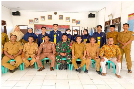
Gambar 1.1 Foto Bersama Aparatur Desa

Kunjungan lokasi PKPM untuk memperoleh informasi dan permasalahan yang ada di Desa Margo Mulyo. Informasi yang diperoleh dikumpulkan demi mencari solusi permasalahan yang terjadi. Menyerahkan surat pengantar sebagai pembuka kegiatan serta meminta izin untuk melakukan kegiatan selama 1 bulan di Desa Margo Mulyo kepada Kepala Desa.