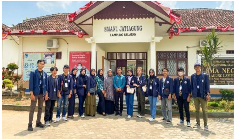
Gambar 1.5 Berkunjung Ke SMA N 1 Jati Agung

Kegiatan ini bertujuan untuk memperkenalkan kampus IIB Darmajaya ke siswa siswi Sma N 1 Jati Agung khususnya kelas XII yang nantinya akan melanjutkan pendidikannya ke perguruan tinggi dan memberikan sedikit motivasi betapa pentingnya pendidikan.