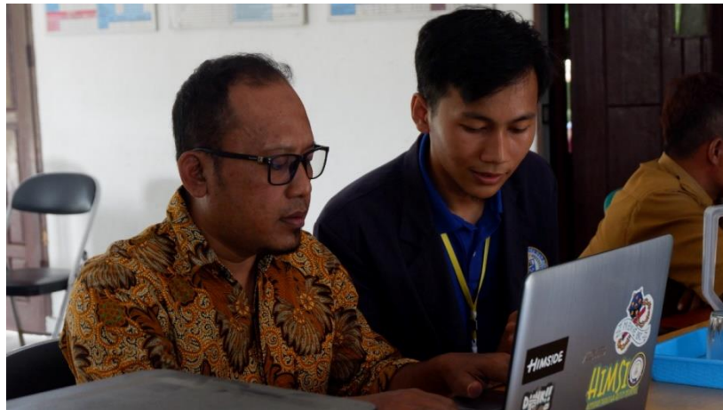
Gambar 1.22 Pelatihan Microsoft Word

Mengadakan pelatihan dasar Microsoft Word kepada Aparatur Desa Margo Mulyo guna menyalurkan ilmu yang sudah di dapatkan selama di perkuliahan serta bertujuan untuk meningkatkan kualitas sumber daya manusia (Aparatur Desa).