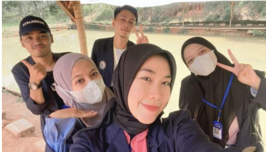
Gambar 1.3 Meninjau Lokasi Budidaya Ikan

Survei ini dilakukan untuk melihat bagaimana program ketahanan Pangan di desa Margo Mulyo berjalan.