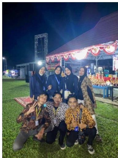
Gambar 1.16 Kegiatan Closing Ceremony

Membantu mempersiapkan perlengkapan serta kebutuhan untuk acara puncak dan pembagian hadiah (Closing Ceremony) di lapangan desa Margo Mulyo serta menghadiri acara Closing Ceremony.