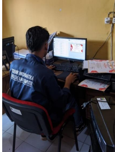
Gambar 1.17 Membantu Kegiatan Di Balai Desa

Melaksanakan piket rutin di balai desa serta membantu pencetakan sertifikat HUT RI.