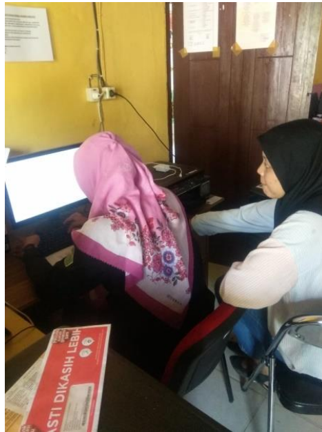
Gambar 1.11 Membantu Aparatur Desa

Membantu operator desa dalam penginputan data.