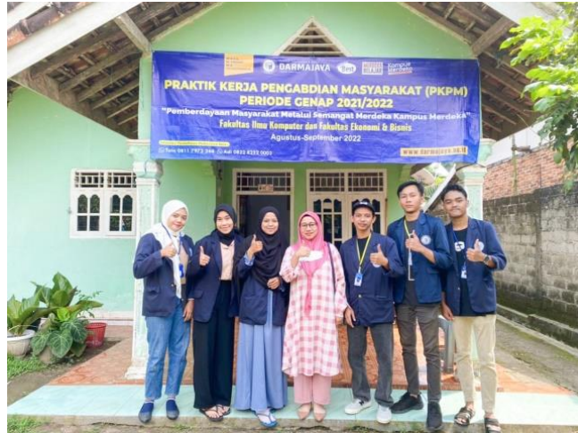
Gambar 1.17 Foto Bersama DPL

DPL berkunjung untuk berdiskusi terkait program kerja yang dilaksanakan oleh mahasiswa di desa serta bagaimana perkembangan laporan dan juga jurnal.