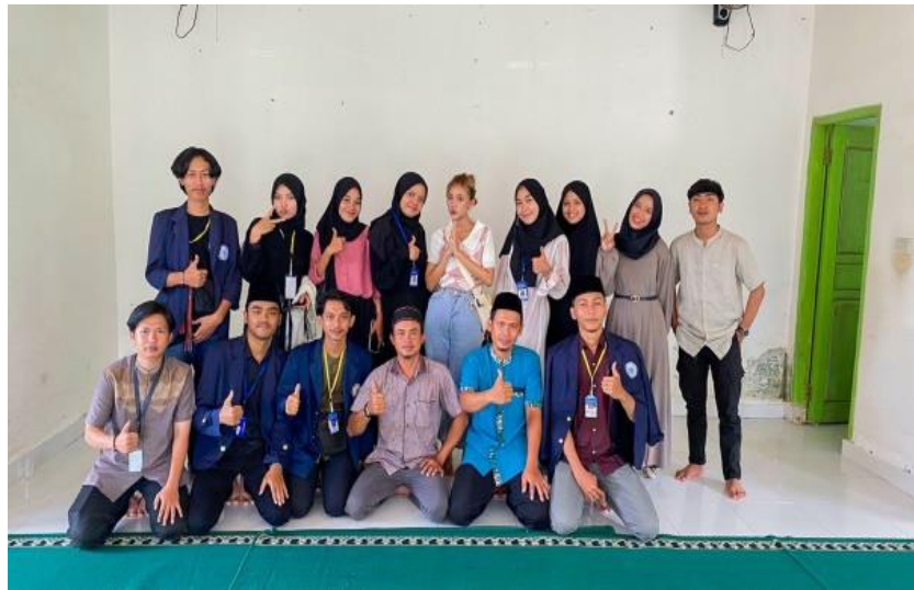
Gambar 1.7 Kegiatan Lomba Keagamaan

Ikut ambil bagian dalam lomba keagamaan di pondok pesantren Muhammad Natsir dalam rangka Hut RI ke 77 sebagai juri dalam lomba Adzan, Mewarnai dan Hifdzil.