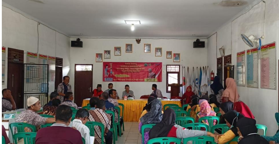
Gambar 1.20 Rumbuk Stunting

Ikut menghadiri acara dalam kegiatan Rumbuk Stunting Sosialisasi dan Suasembaga Gizi di Balai Desa Margo Mulyo.