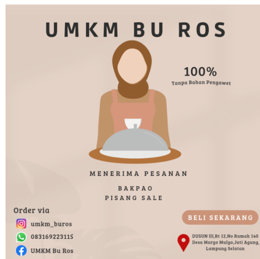
Gambar 1.19 Pembuatan Logo dan Label