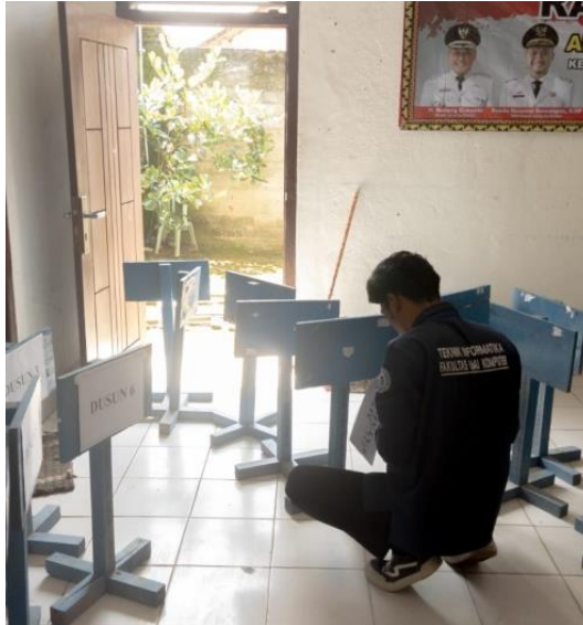
Gambar 1.9 Mempersiapkan Plang

Membantu persiapan mulai dari pemasangan plang peserta upacara dan malamnya memasang atribut untuk upacara.