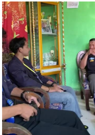
Gambar 1.2 Foto Pemilik UMKM

Mengunjungi lokasi pembuatan Salai Pisang Dan Bakpao untuk kebutuhan informasi terkait UMKM mulai dari harga jual, kemasan yang digunakan serta pemasaran.