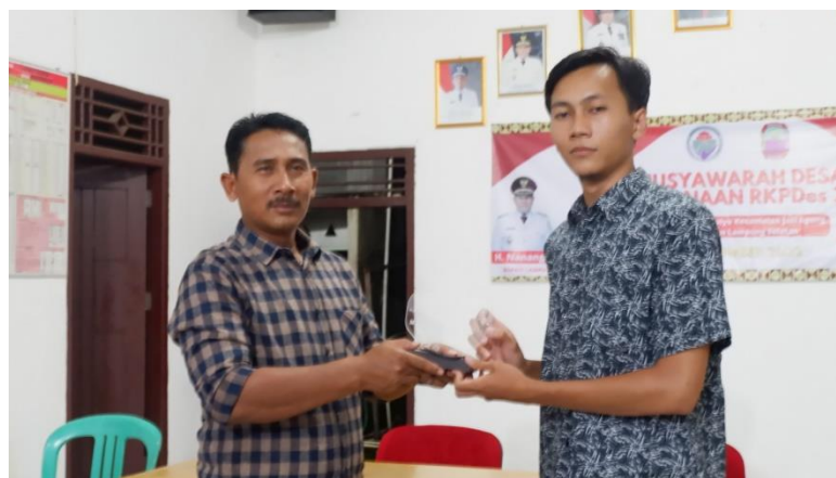
Gambar 1.22 Penyerahan Pelakat

Acara pelepasan dilaksanakan malam hari dan diadakan acara makan bersama dengan Aparatur Desa Margo Mulyo, Pemuda serta Pamong Desa di Balai Desa Margo Mulyo, dan memberikan kenang-kenangan berupa Pelakat.