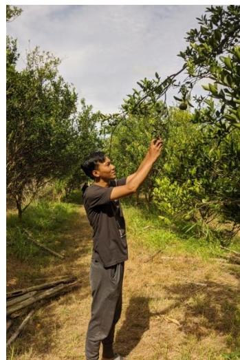
Gambar 1.8 Foto Di Kebun Jeruk BW

Berkunjung ke kebun jeruk BW milik warga desa Margo Mulyo untuk melihat potensi pariwisata yang bisa di kembangkan.