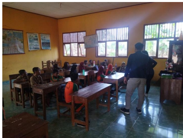
Gambar 2.8 Mengajar SD Bangun Sari