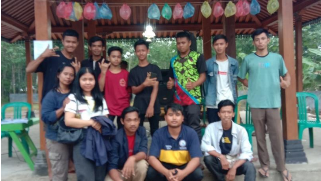
Gambar 2.13 Kegiatan Perlombaan 17 Agustus