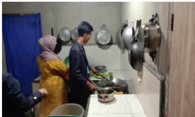
Gambar 2.6 Proses Penggorengan Peyek