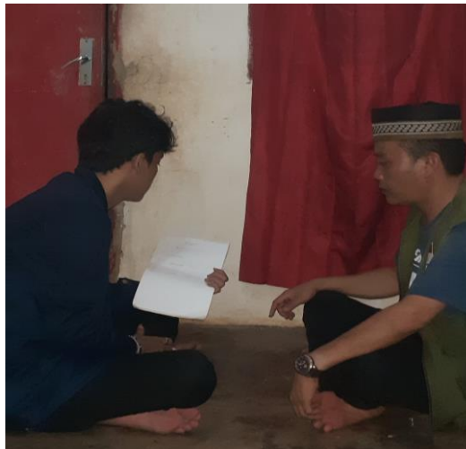
Gambar 2.1 Proses Edukasi Manajemen Dan Manajmen Sumber Daya Manusia