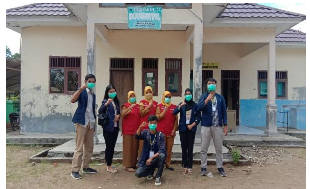
Gambar 2.12 Kegiatan Posyandu