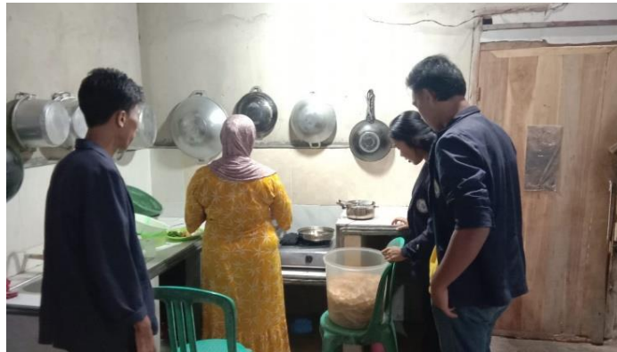
Gambar 2.7 Proses Pembuatan Adonan Peyek