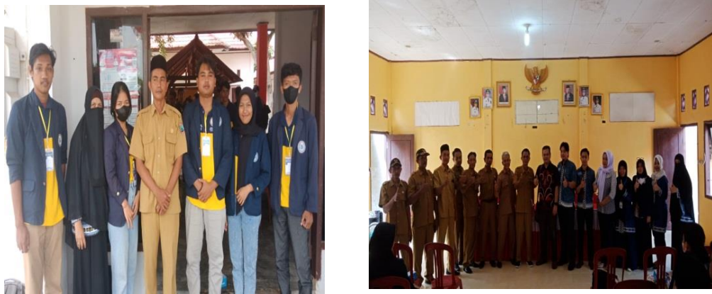
Gambar 2.5 Penyerahan Mahasiswa PKPM di Kecamatan Tanjung Sari

Kegiatan PKPM diawali dengan penyerahan mahasiswa di kecamatan Tanjung Sari kemudian melanjutkan ke desa-desa yang telah ditentukan.