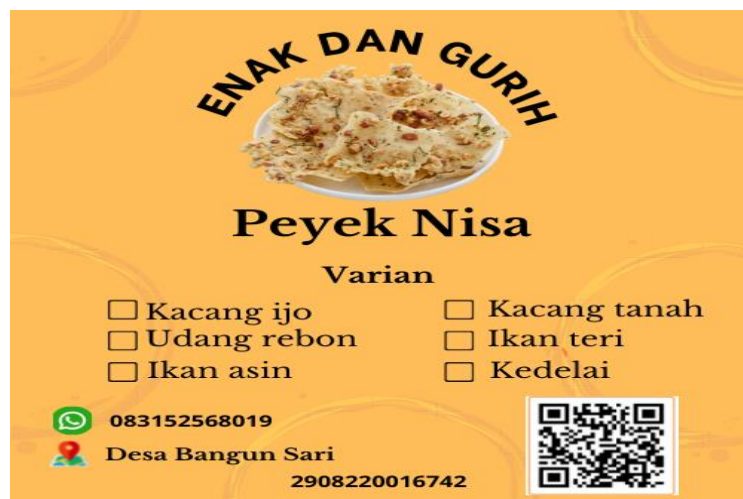
Gambar 2.2 Tampilan logo baru UMKM peyek Nisa

Logo merupakan hal yang sangat penting bagi sebuah usaha, logo merupakan sebuah identitas bagi produk yang akan dipasarkan. Logo juga dapat dijadikan sebagai visual yang akan membantu sebuah produk menjadi lebih menarik. Pembuatan logo pada UMKM peyek sebagai perbaikan dari logo yang sebelumnya sudah dimiliki oleh UMKM peyek.