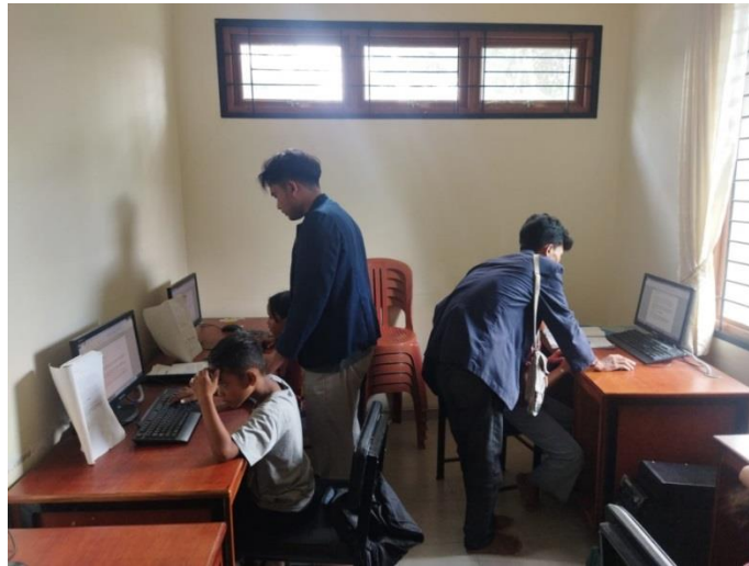
Gambar 2.9 Mengajar di Rumah pintar