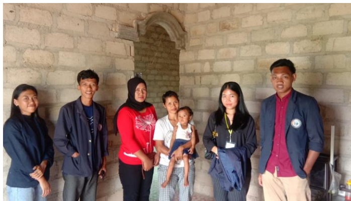
Gambar 2.10 Melakukan kunjungan ke pengidam stunting

Stunting adalah kondisi gagal tumbuh pada anak balita (bayi di bawah 5 tahun) akibat dari kekurangan gizi kronis sehingga anak terlalu pendek untuk usianya. Kekurangan gizi terjadi sejak bayi dalam kandungan pada masa awal setelah bayi lahir akan tetapi, kondisi stunting baru nampak setelah bayi berusia 2 tahun. Program kami adalah ,melakukan kunjungan dan melakukan edukasi terkait bagaimana masyarakat lebih sadar terkait dengan masalah stunting.