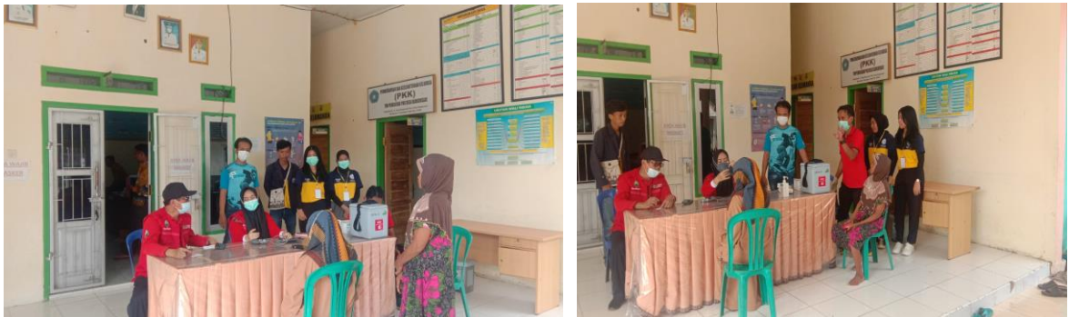
Gambar 2.11 Kegiatan Vaksin

pada masa Covid-19 seluruh masyarakat diwajibkan untuk melakukan vaksinasi sebanyak 3 kali di Desa Bangun Sari vaksinasi dilkuaqn oleh Puskesmas Kecamatan Tanjung Sari.