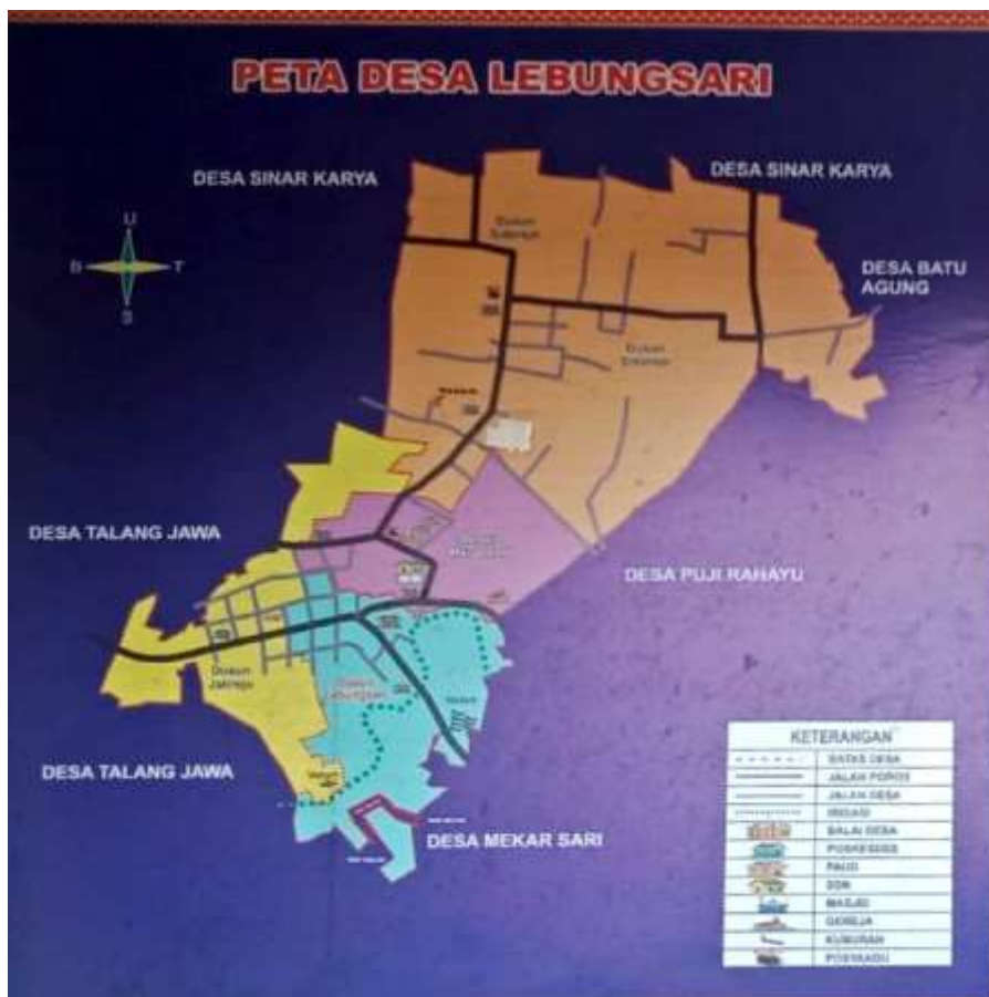
Gambar 1. Peta Desa Lebung Sari.